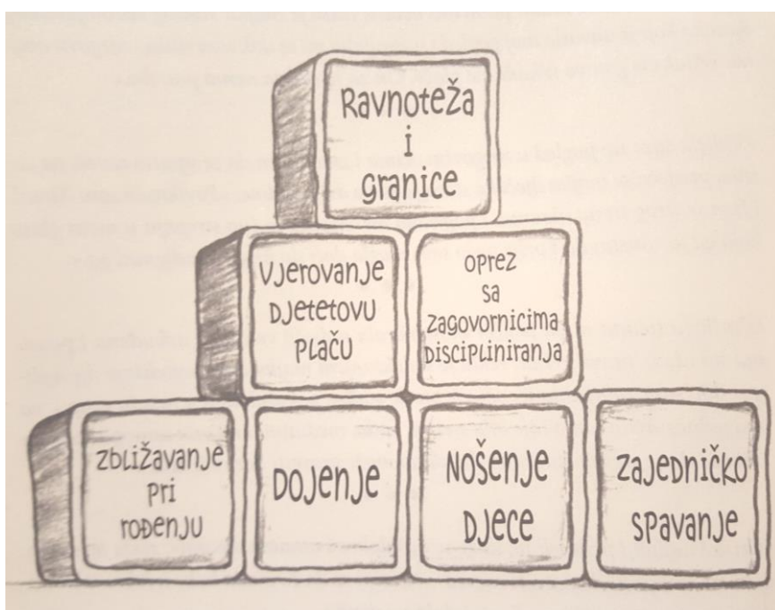
Slika 2. Alati povezujućeg roditeljstva (Sears, 2008: 12)

Povezujuće roditeljstvo je način odgoja djece kroz razvijanje zajedničkih vještina, uvažavanja i razvijanje povjerenja. „Povezujuće roditeljstvo prije svega znači otvoriti srce i um za individualne djetetove potrebe i pustiti da vam poznavanje vlastita djeteta bude vodič u donošenju odluka o tome što je u određenom trenutku najbolje za vas oboje. Najsažetije rečeno, povezujuće roditeljstvo znači naučiti čitati znakove koje vam vaše dijete šalje i pravilno na njih odgovarati.“ (Sears, 2008: 13) Stil povezujućeg roditeljstva trebalo bi početi koristiti i osvještivati već od djetetova rođenja. Alate koji pružaju početak izgradnje povezujućeg odnosa možemo vidjeti na slici 2.