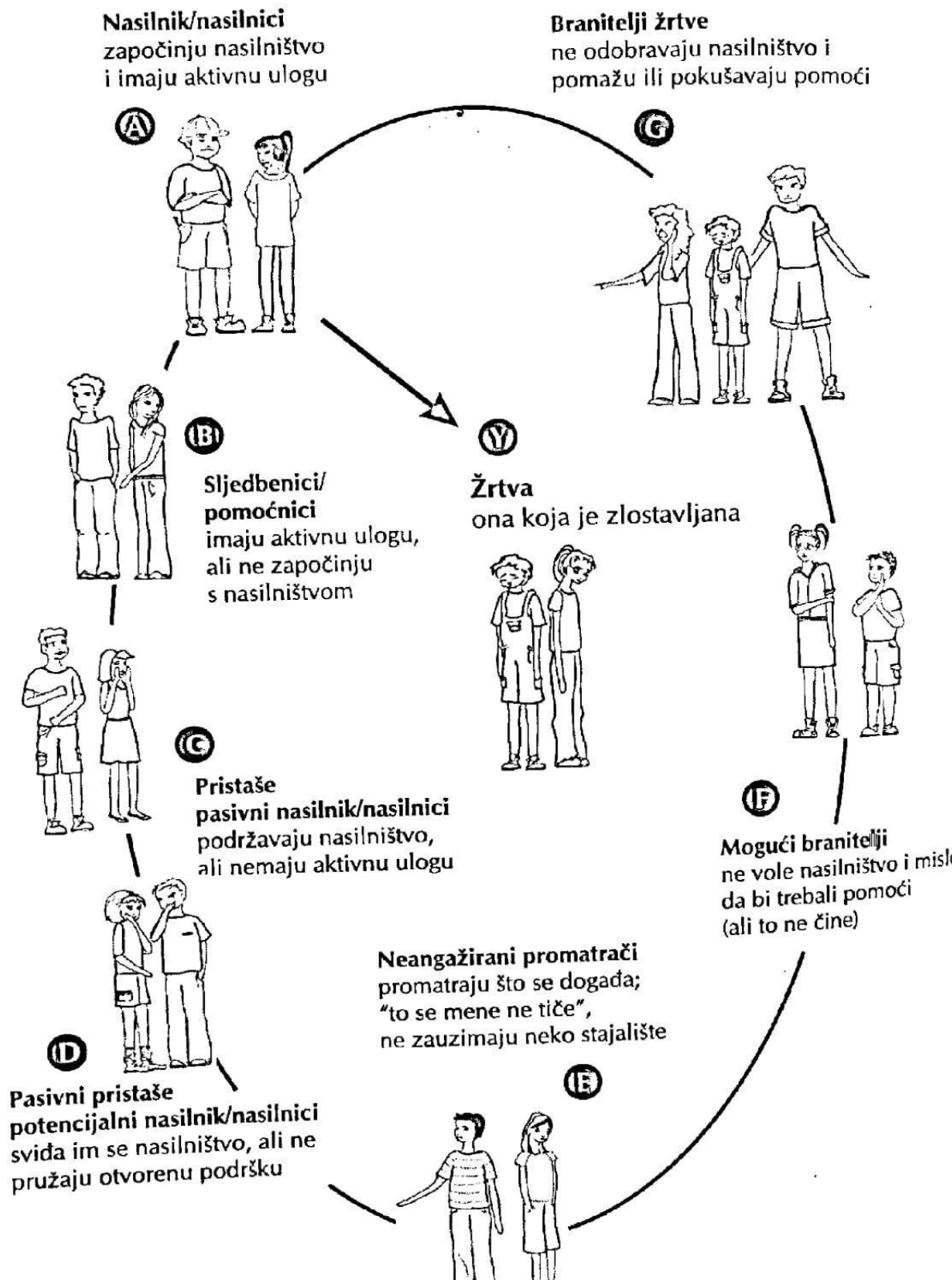
Slika1. Krug nasilja (preuzeto iz Bilić, Buljan Flander i Hrpka, 2012)