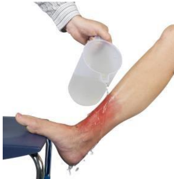
Slika 6. Hlađenje opečenih dijelova tijela tekućom vodom

prekriti antibiotskom kremom i jastučićem gaze. Potrebno je pratiti reakciju kože nakon opekline jer može doći do crvenila, otjecanja, pojačane osjetljivosti kože te istjecanja tekućine iz opekline a to su svi znakovi infekcije, te treba potražiti liječničku pomoć. Liječnik može prepisati kremu koja je primjerena djetetovoj dobi. Kako bi se ublažila upalna reakcija, djetetu se može dati i antihistaminik. Ako djetetova odjeća još tinja, potrebno je dijete odnijeti pod tuš i isprati prije nego mu se skine odjeća, skida li se dok još tinja, dijete se može dodatno opeći. Bilo bi pametno dijete naučiti, kada je dovoljno staro, o općim mjerama sigurnosti od požara, da se ne smije igrati svijećama ili šibicama. Pokazati djetetu izlaze iz kuće ili vrtića u slučaju požara. Vježbati s djetetom metodu zaustavi se, legni, pokrij lice i otkotrljaj se. Opekline od vruće tekućine mogu izazvati jednake reakcije kao i one od vatre. Vrlo je važno uvijek provjeriti rukom temperaturu vode za kupanje prije negoli dijete spustite u kadu. Kad je dijete u kuhinji dok se priprema ručak, sve ručke na loncima i tavama trebaju biti okrenute prema zidu, a vruće napitke nikad ne ostavljati ondje gdje ih mogu prevrnuti nestašna ili jako mala djeca. Također ne bi trebali biti stolnjaci na stolu dok djeca na narastu dovoljno da znaju koja posljedica slijedi ako ga povuku sa stola. (Bralić i sur., 2014.; Oz i Roizen, 2014.; [5] )