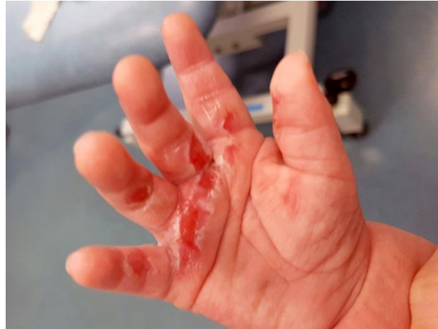
Slika 4. Opeklina drugog stupnja

( https://www.thesun.co.uk/news/2261357/nine-month-old-boy-left-with-second-degree-burns-and-severe-blisters-after-grabbing-exposed-hot-radiator-pipes/ PRIBAVLJENO 17.05.2017.)