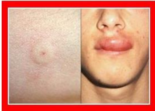
Slika 9. Ubod pčele

( http://www.pcelinjak.hr/OLD/index.php/Iskustva-i-savjeti/to-ako-vas-pela-ubode.html