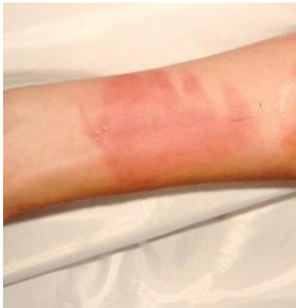
Slika 3. Opeklinu prvog stupnja

Ciljevi prve pomoći kod opeklinu su otklanjanje uzroka ozljeđivanja te hlađenje opečenih površina, zaštita opečenih površina sprječavanjem naknadnih komplikacija i osiguranje nužne medicinske pomoći. (Sekelj i sur., 2006.)