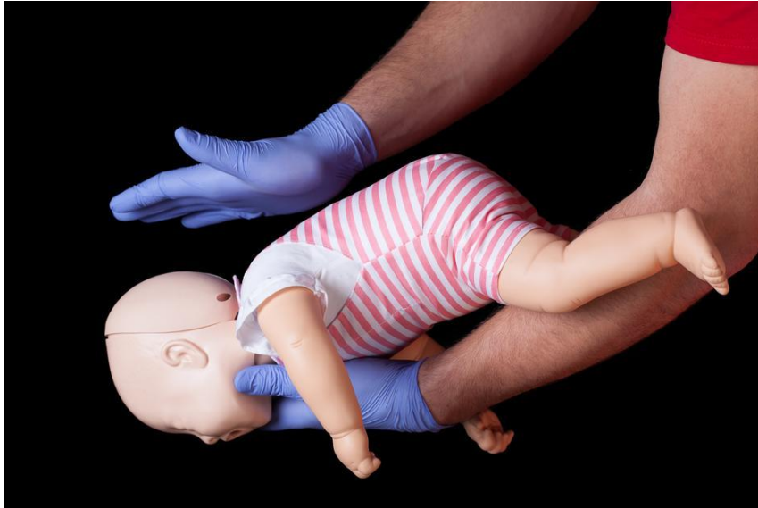
Slika 8. Djeca u dobi do godine dana

( http://klokanica.24sata.hr/jaslice/zdravlje/znete-li-sto-napraviti-ako-se-dijete-pocne-gusiti-komadicem-hrane-6382 PRIBAVLJENO 17.05.2017.)