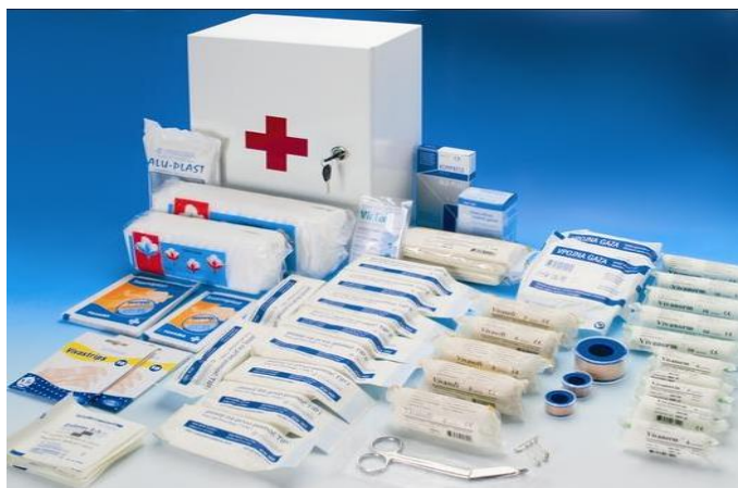
Slika 1. Sadržaj ormarića za prvu pomoć ( http://www.tosama-trgovina.hr/internet-trgovina/109_Prva-pomoc/i_113_ormaric-za-prvu-pomoc PRIBAVLJENO 19.6.2017.)