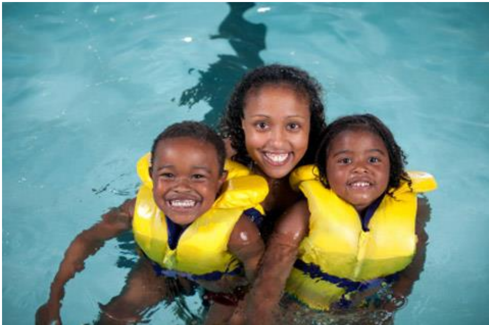
Slika 2. Djeca sa zaštitnim prslukom u društvu odrasle osobe

odrasle osobe, jer ništa nije važnije od djetetova života. Dijete u vodi mora paziti isključivo odrasla osoba, ne stariji brat ili sestra. Ako se zaboravi ponijeti ručnik u kupaonicu, dijete treba izvaditi iz vode i požuriti ga osušiti. Dijete u čamcima mora nositi pojas za spašavanje, dijete koje pliva nikada ne ispuštati iz vida čak i ako ima pojas ili narukvice. Ako je dijete nađeno u vodi, odmah pozvati hitnu pomoć i okrenuti dijete na stranu. Snažno mu protrljati ili lupiti ga po leđima kako bi mu se pomoglo da iskašlja vodu iz pluća. Osoba koja nađe dijete mora biti pribrana kako bi mogla to sve napraviti jer je vrijeme vrlo važan čimbenik kod ove vrste ozljede. U slučaju ovakve ozljede nema mjesta panici jer se može djetetu samo pogoršati što je dulje bez zraka. (Bralić i sur., 2014.; Oz i Roizen, 2014.)