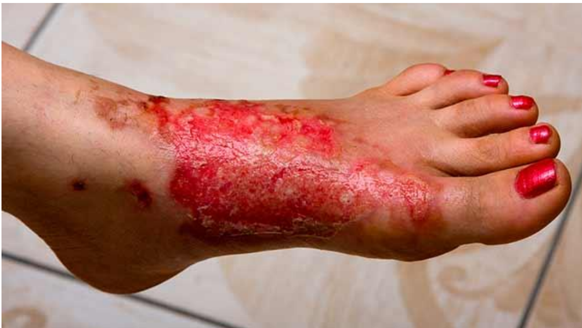
Slika 5. Opeklina trećeg stupnja