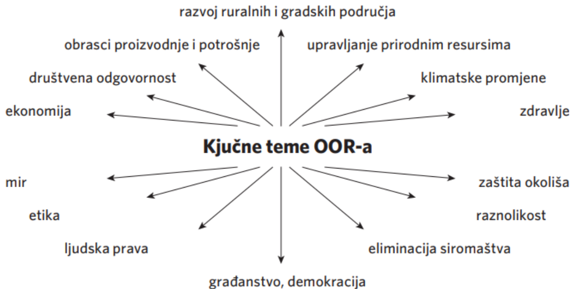
Slika 4. Teme obrazovanja za održivi razvoj, slika preuzeta iz priručnika za osnovne i srednje škole, Obrazovanje za održivi razvoj , Zagreb, 2011.

stvarnosti, pokazuju da se održivost zaista može ostvariti, inspiracija su i poticaj. Stoga je u pripremi programa obrazovanja za održivi razvoj važno prikupiti pozitivne i uspješne primjere, te se usmjeriti na moguće i ostvarivo, s pogledom u budućnost koju sami oblikujemo i koju ovisno o našim svakodnevnim izborima, možemo učiniti svijetlom i optimističnom.