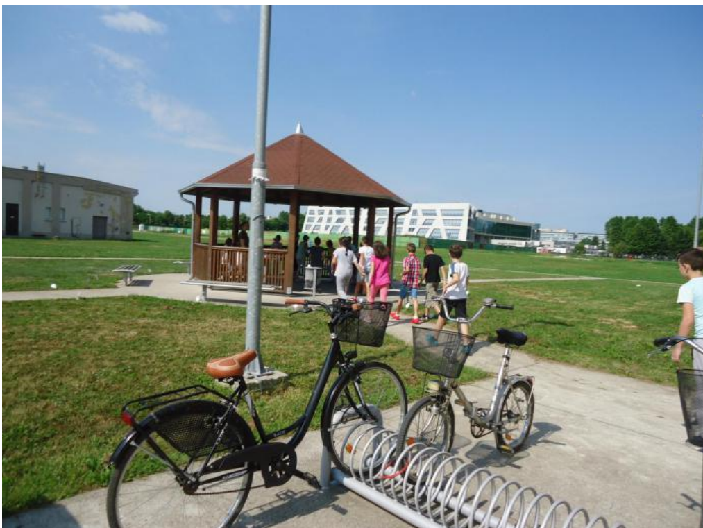
Slika 9. Boravak u prirodi i razgovor pod sjenicom