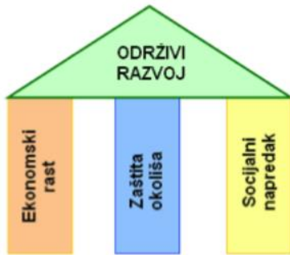
Slika 3. Stupovi održivog razvoja (Frajman-Jakšić i sur., 2010:469).

Navedeno je moguće sistematizirati slikom koja prikazuje stupove, odnosno spomenute komponente održivog razvoja.