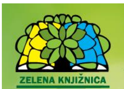
Slika 5. Logotip Zelene knjižnice

Teom Hatadi. Budući da je projekt započeo 2011. godine, koja je bila Međunarodna godina šuma, stablo se na logotipu nametnulo kao logičan izbor. Otvorena knjiga koja se stapa s krošnjom stabla simbolizira knjižnice, a žuta i plava boja predstavljaju sunce i vodu. Sunce, voda i stablo predstavljaju život, a knjiga predstavlja učenje i spoznaju održivog sustava koji ne ugrožava život na planeti.