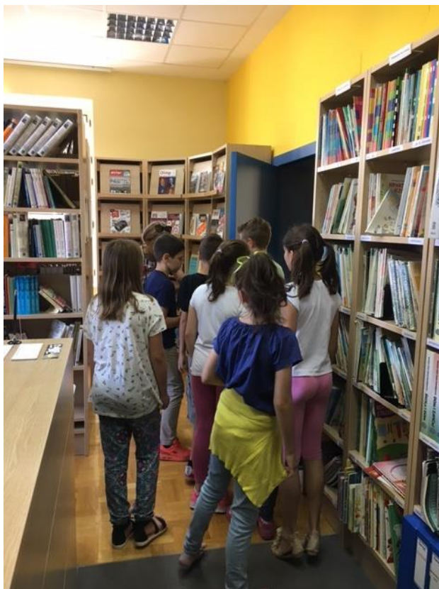
Slika 6. Učenici se upoznaju sa Knjižnicom Fakulteta za odgojne i obrazovne znanosti

Nakon toga učenici su zajedno sa učiteljicom prošetali do zgrade fakulteta, u prostoriju za predavanja koja se nalazi u prizemlju. Tamo sam im preko projektora pustila edukativni film Eko sutra . Film traje 15 min i govori, između ostalog, o smogu i kiselim kišama te globalnom zagrijavanju naše planete. „Tvornice, elektrane i motorna vozila donijeli su čovječanstvu veliku dobrobit, ali su i uzrokovali mnoge probleme. Energetske rezerve i sirovi materijal koristimo u alarmantnim količinama, proizvodeći veliku količinu otpadnih produkata kojih se ne znamo riješiti.“ (Scott, 1994:144)