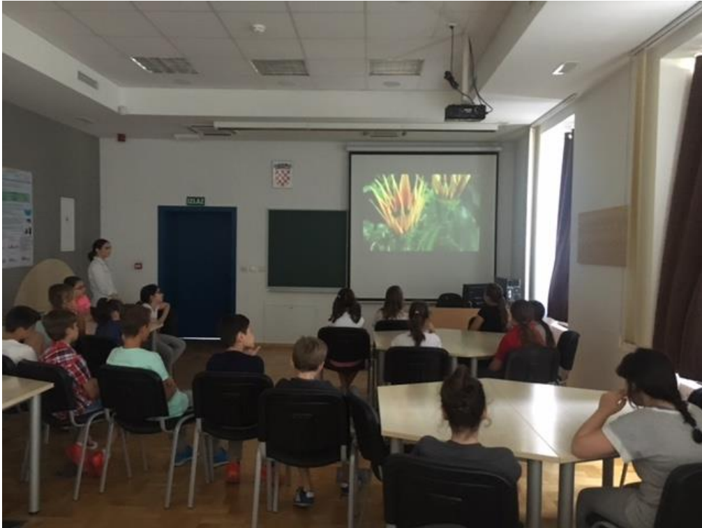
Slika 7. Edukativni film Eko sutra