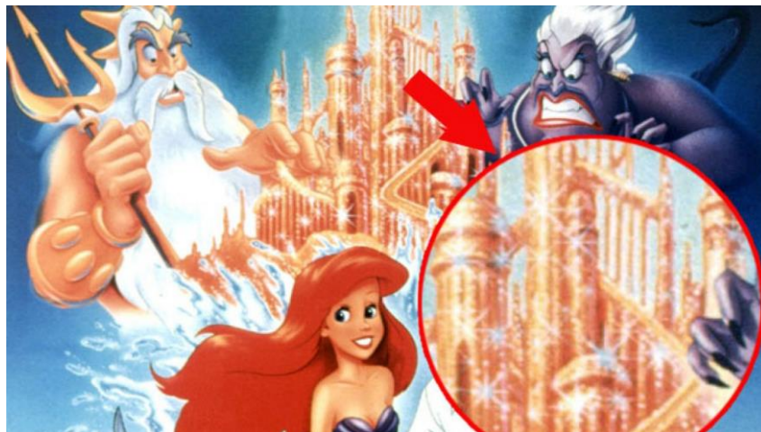
Slika 2. Subliminalna poruka u crtanom filmu Mala sirena

stupova dvorca u pozadini, slika muškoga spolnoga organa. U filmu Fantasia opetovano se pojavljuju slike nagih ženskih likova“ (Miliša i sur., 2012:136).