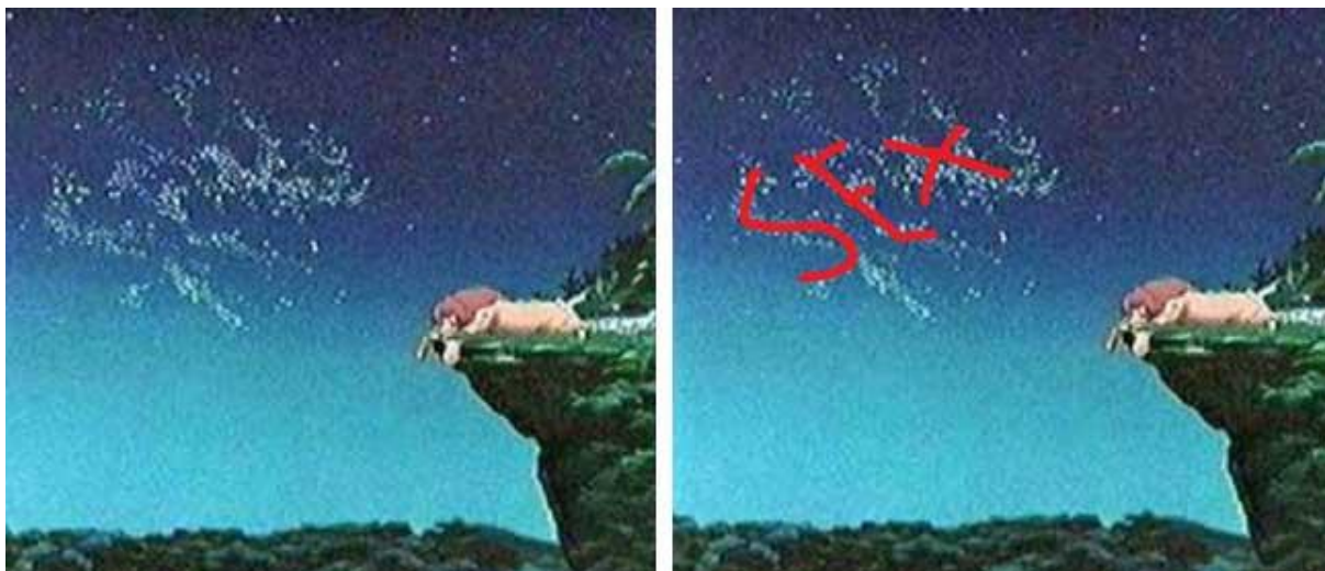
Slika 3. Subliminalna poruka u crtanom filmu Kralj lavova

Današnji popularni kratkometražni filmovi su Ben 10, Winx, Bratz, Pokemoni, Yu-Gi-Oh, Dragon Ball Z i drugi. Spomenuti filmovi puni su agresivnog ponašanja i negativnih poruka. Ben 10 je postao idol gotovo svoj djeci. Priča je to o dječaku koji se s pomoću posebnog sata na ruci može pretvoriti u 10 različitih izvanzemaljaca. Yu-Gi-Oh je priča o dječaku koji je odličan u igri s kartama koje upravljaju različitim čudovištima koja se međusobno bore i uništavaju. Cilj je uništiti protivnika, a glavnog lika Yugija s vremena na vrijeme opsjeda duh faraona koji mijenja dječakovo ponašanje te on postaje okrutniji. Cijeli crtani Dragon Ball Z