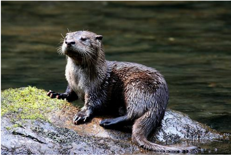
Slika 9. Vidra

Vidre imaju mekani lsoj krzna koji ih štiti od vode i grije ih. Vitkih su tijela i kratkih udova. Imaju plivaće kožice koje im omogućavaju brzo kretanje u vodi. Zanimljivo je da vidra mora uhvatiti 100 grama ribe u jednom satu kako bi prikupila dovoljno energije za boravak u hladnoj vodi.