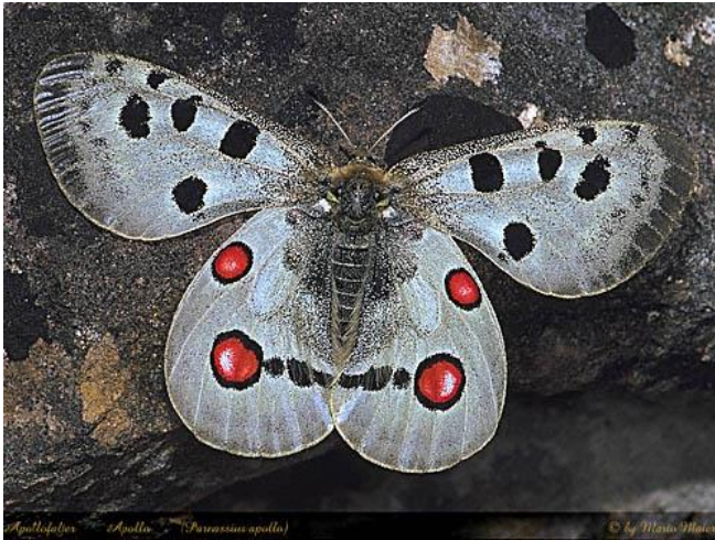
Slika 7. Apolon

Apolon je zaštićena leptir iz porodice lastinrepaca. Bijela krila promjera 6 cm krase crni obrub i crveno crne pjege. Leti krivudavo kao da ide sa cvijeta na cvijet.