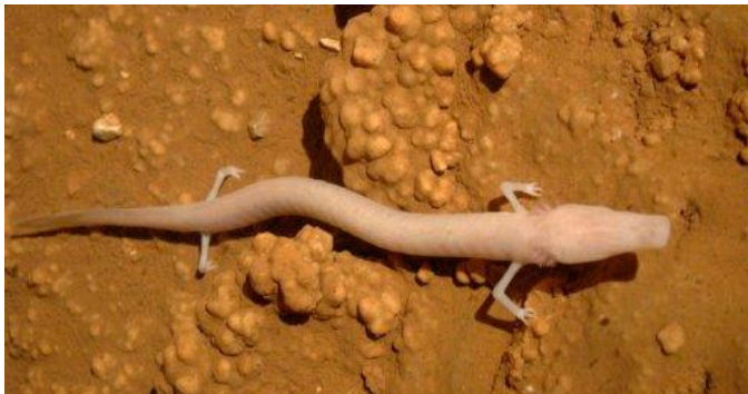
Slika 10. Čovječja ribica

Lat. Proteus anguinus , je endem Hrvatskog primorja. Spada u skupinu vodozemaca I teži svega 17 grama. Živi u podzemnim vodama I mračnim špiljama na određenoj temperaturi. Diše plućima I kožom ali zadržala je čupave škrge na glavi.