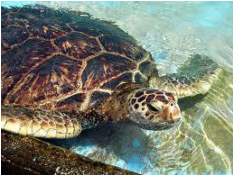
Slika 3. Golema želva

Golema želva ( Chelonia mydas ) je morska kornjača. One žive do 50 godina, a spolno zrele postaju sa 10 godina. Imaju specifičan način ishrane. Tek izležene male želve su mesožderi, dok su na primjer starije kornjače biljojedi. Golema želva prijeđe velike udaljenosti i možemo ju naći u svim tropskim i subtropskim oceanima.