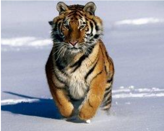
Slika 5. Sibirski tigar

Sibirski tigar je najveća divlja mačka na svijetu. Nastanjuje sibirske šume. Gotovo je istrijebljen krivolovom. Ubija ih se zbog crvenkastog krzna sa crnim prugama.