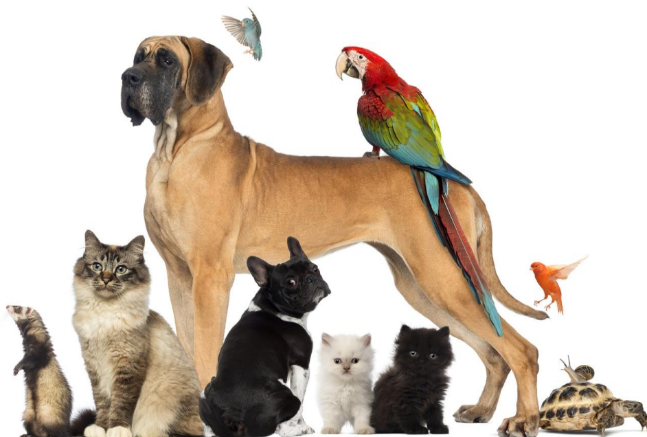
Slika 2. Kućni ljubimci

Udruga za zaštitu životinja Split – Split