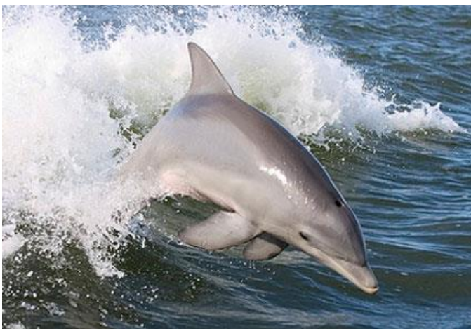
Slika 8. Dobri dupin

Najinteligentnija životinja i vjerovatno najomiljenija morska životinja. Dupin je sisavac, iz tog razloga nije stalno pod vodom jer udiše kisik iz zraka.