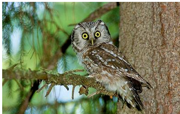
Slika 6. Ćuk u mirovanju

Ptica aktivna isključivo noću, rasprostranjen je u Europi, Aziji, a zimuje u Afričkoj Sahari. Njihov plijen su životinje koje ne uspiju naći noćno sklonište. Hvata ih nožnim kandžama u letu. Prednost mu je što ima istančan noćni vid.