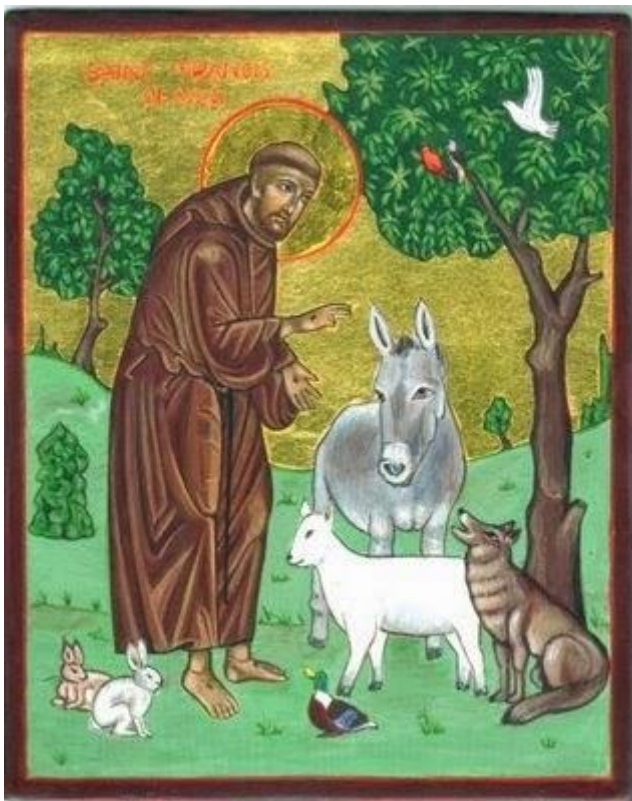
Slika 1. Sv. Franjo Asiški sa životinjama

Prvi put Svjetski dan životinja spominje se 1924. u zahtjevu njemačkog pisca Heinricha Zimmermanna. 1929. u Beču se održao treći Međunarodni kongres zaštite životinja. Ondje je prihvaćen popis zahtijeva, te je posljednja točka zahtijeva bio Dan zaštite životinja. Na konvenciji ekologa u Firenci 1931. proglašen je Svjetski dan zaštite životinja. Datum 4. listopada je simbolično odabran, jer se taj dan obilježava svetkovina zaštitnika životinja, sv. Franje Asiškog.