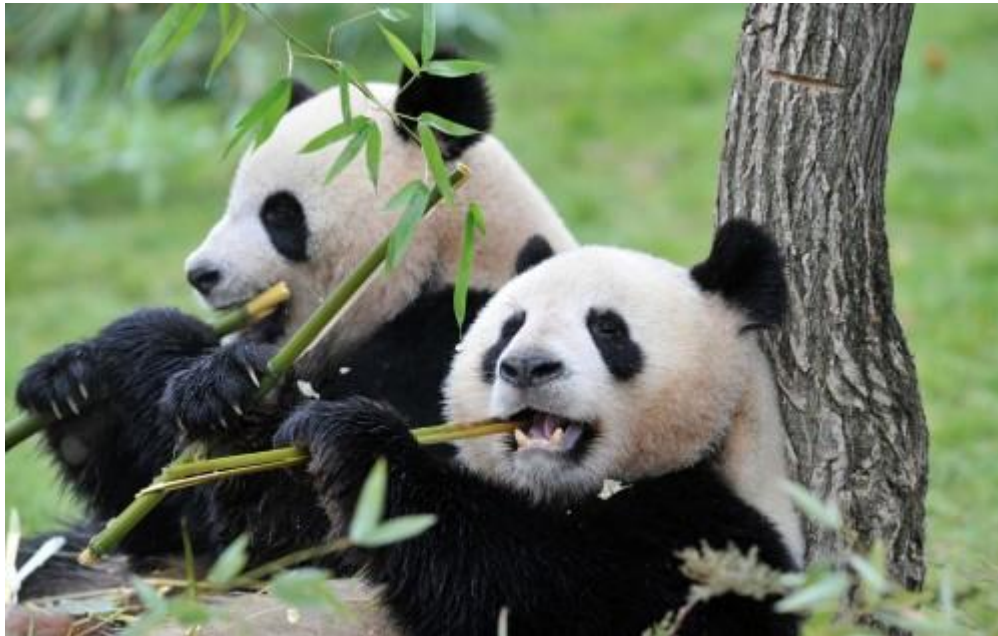
Slika 4. Pande

Panda je jedna od najugroženijih vrsta, često je simbol svih ugroženih vrsta. Nastanjena je u Kini. Miroljubivi je medvjed i hrani se isključivo bambusovim mladima. U svijetu postoji samo 600-tinjak panda koji žive na slobodi. Do 14 sati dnevno provedu haneći se. Navodno nisu zainteresirane za reprodukciju pa to također doprinosi smanjenju broja jedinki.