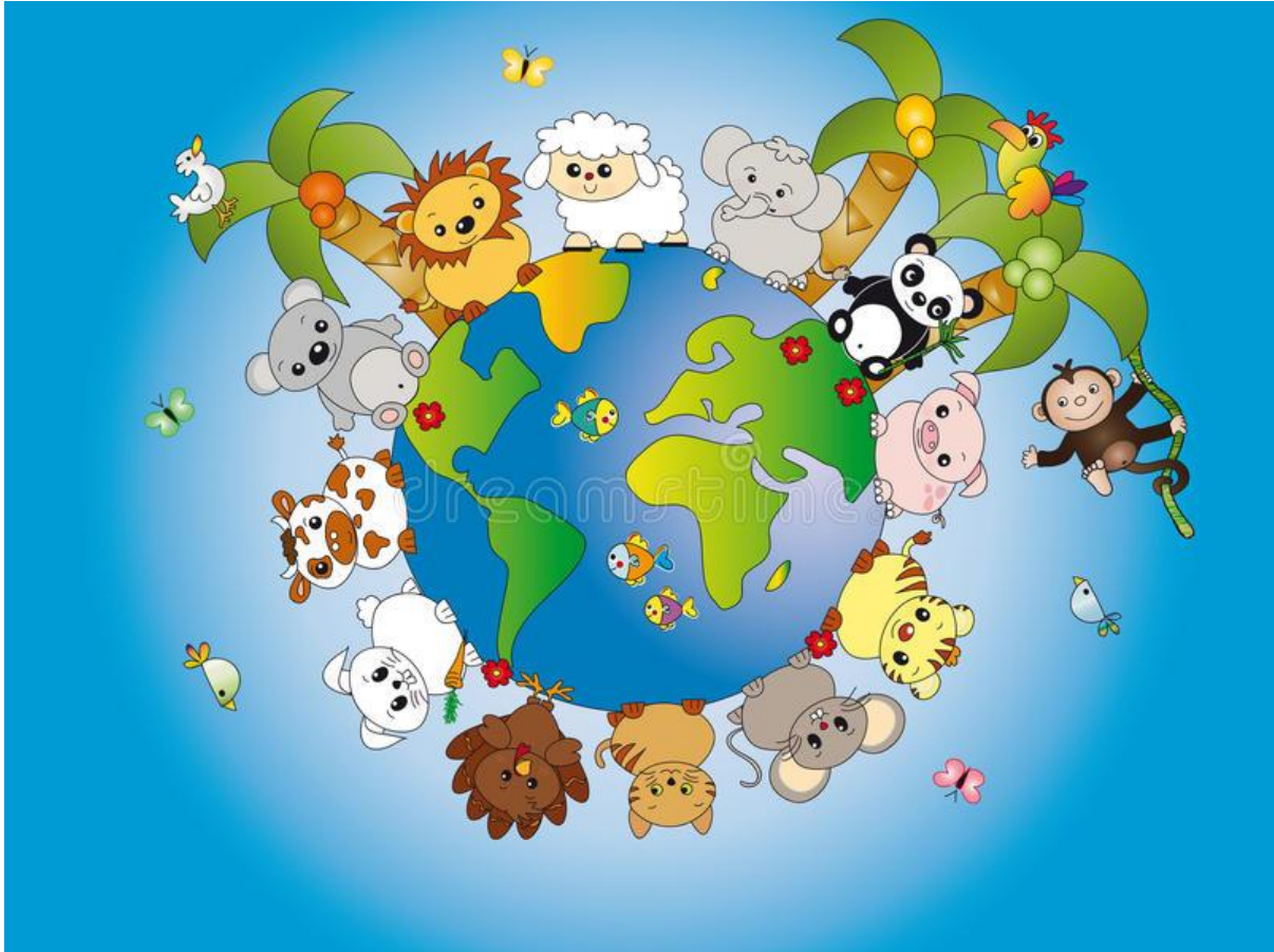
Slika 11. Životinje zajedno