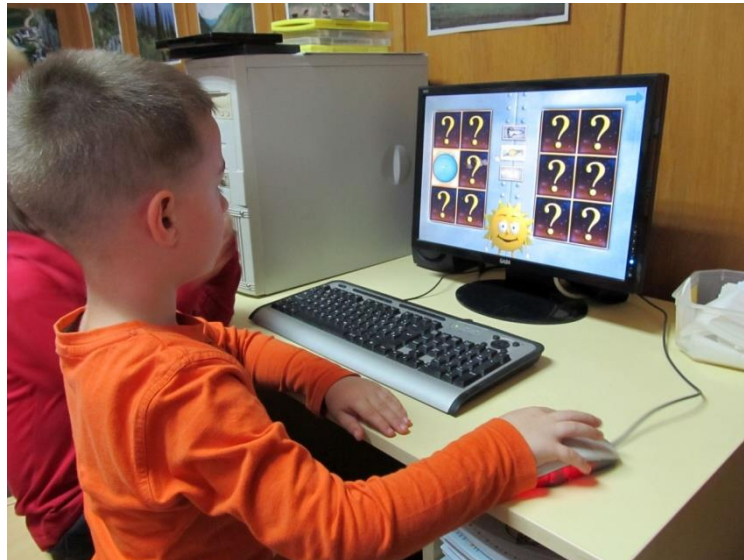
Slika 4: Pozitivni učinci računalnih igrica