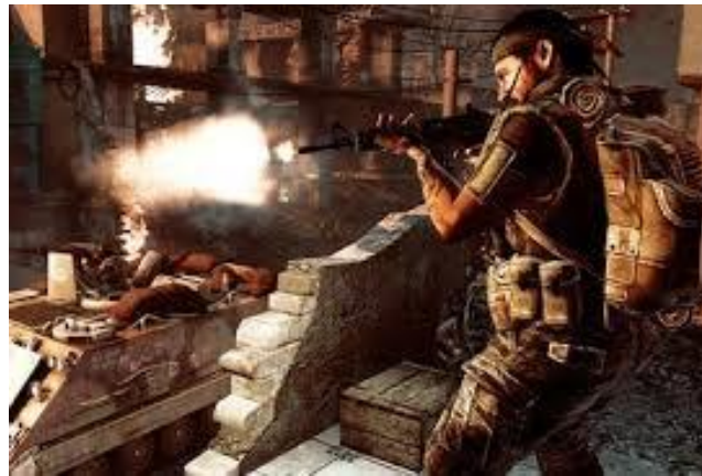
Slika 1: Primjer junaka u igrici koji je u ulozi ubojice

Izjava maloljetnog djeteta koje igra nasilne igrice: „Moram da ubijam jer to mi je misija. Ubijam robote, udaram ih dok ne umru ili dok ne eksplodiraju. Uzimaš puške, tenkove, imaš helikoptere, ulaziš u vodu, kradeš aute. Pucaš, pucaš... i ne znam više.“