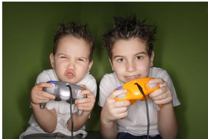
Slika2. Zaokupljenost računalnm igrama

Kad se zbog učestale uporabe odnosno igranja poremete duševne funkcije, a time i socijalno ponašanje, možemo govoriti o prekomjernoj uporabi (Davis, 2001.), tj. preokupaciji sve do zlouporabe.