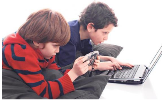
Slika 3: Ignoriranje problema