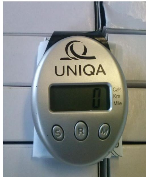
Slika 2. Pedometar

Pri provedbi istraživanja za diplomski rad koristio se pedometar Uniqa (kao što se vidi na slici 2.) koji je vrlo jednostavan za korištenje. Sastoji se od tri tipke: Set, Reset i Mode. Kada pritisnemo tipku Set, pedometar pokazuje broj napravljenih koraka. Tipkom Reset pedometar se resetira, a pritiskom na tipku mode Mode možemo vidjeti preračunate korake u milje, kilometre i utrošene kalorije. Korištenje pedometra na nastavi tjelesne i zdravstvene kulture motiviralo je učenike na povećanu fizičku aktivnost te na aktivnije sudjelovanje na nastavi.