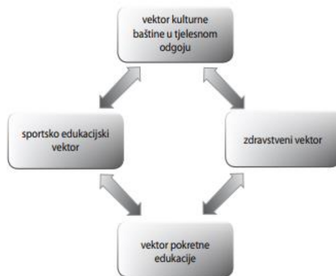
Slika 1. Podjela na vektorski model (Naul, 2001. prema Prskalo, I., Badrić, M., 2014).

Programi nastave Tjelesne i zdravstvene kulture kao nastavnog predmeta u nekim europskim zemljama s vremenom su se mijenjali. Procesom zbližavanja i ujedinjenja Europske unije dolazi do formiranja strukture tjelesnog odgoja kao vektorskog modela. Četiri glavna vektora u Europskom tjelesnom odgoju mogu se objasniti kao vektor kulturne baštine u tjelesnom odgoju, sportsko edukacijski vektor, vektor pokretne edukacije i zdravstveni vektor (vidi slika 1.) (Naul, 2001. prema Prskalo, I., Badrić, M., 2014).