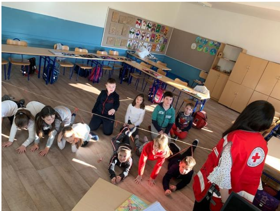
Slika 5. Učenci izvršavaju aktivnost „Paukova mreža“