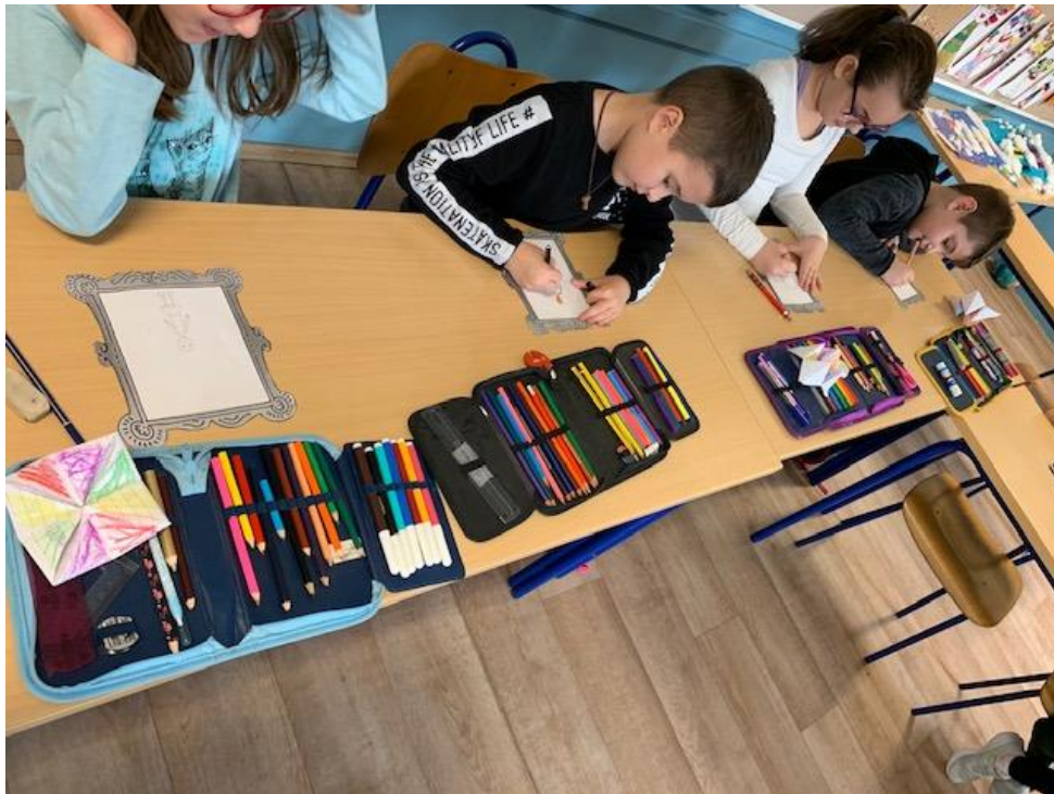
Slika 2. Učenci crtaju autoportret