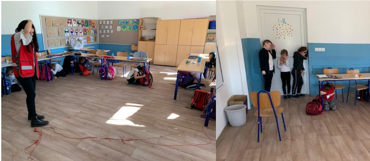
Slika 6. Učenci izvršavaju aktivnost „Potres“

Učitelji su promatrali, sudjelovali i upijali ideje koje će moći primjenjivati u svojem budućem radu. Primijetila sam pozitivan utjecaj, kako na učitelje, tako i na učenike. Učenci su međusobno surađivali, manje se svađali tijekom izvođenja određenih aktivnosti, razvijali empatiju, odnosno spoznali su o važnosti poštivanja pravila zajednice i prihvaćanja odgovornosti. Učitelji su tijekom provođenja aktivnosti mogli primijetiti potencijalne probleme s kojima se učenici susreću u svom razredu.