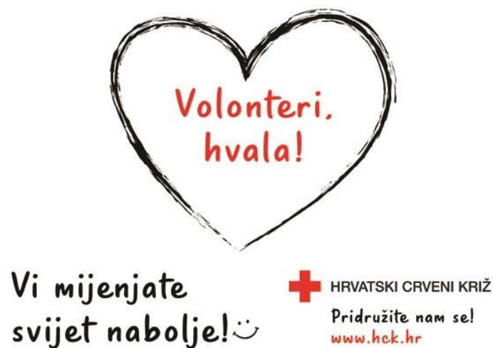
Slika 1. Zahvala volonterima

Hrvatski Crveni križ prepoznaje važnost volonterskog rada i promocije volonterstva, pa povodom toga vrši dodjelu godišnjih priznanja. Nagrađivanje volontera se vrši u tri kategorije, a to su „volonter godine“, „volonterski tim godine“ i „posebno volontersko priznanje“ (HCK, 2018).