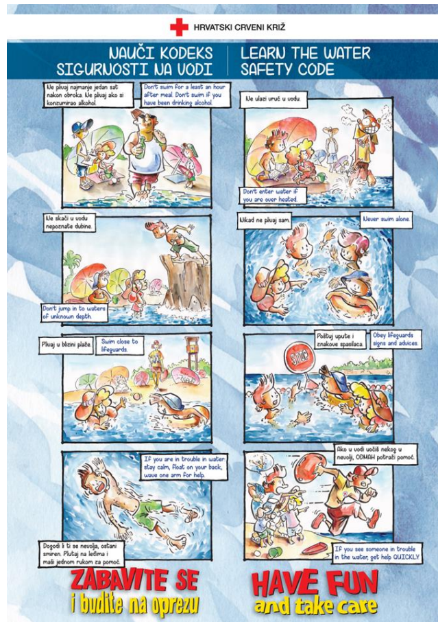
Slika 7. Kodovi sigurnosti na vodi.