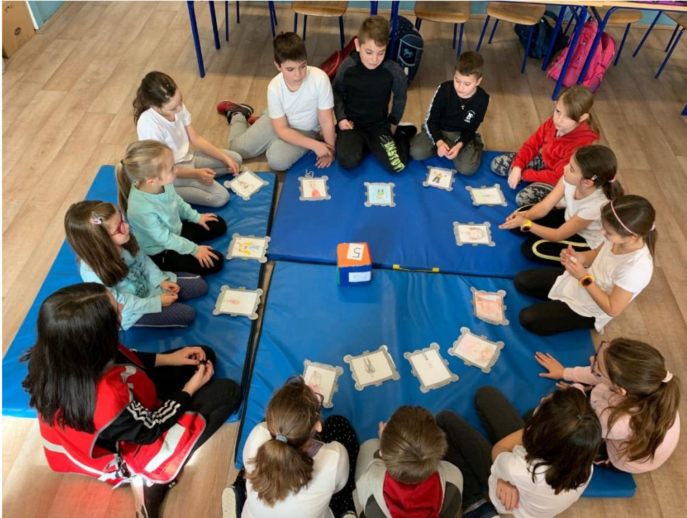
Slika 4. Učenci bacaju kocku te govore svoje vrline