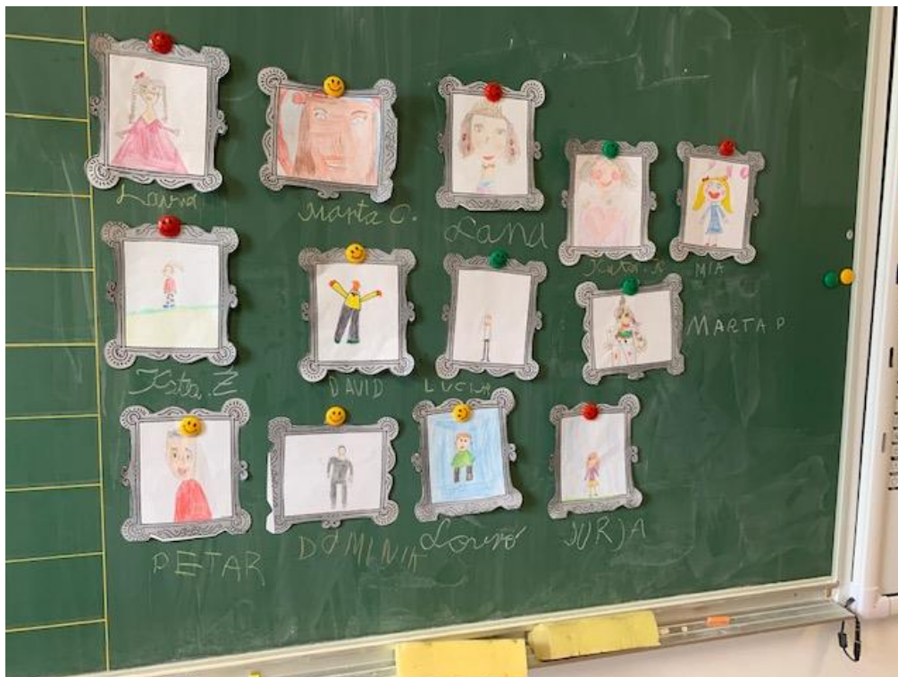
Slika 3. Autoportreti učenika