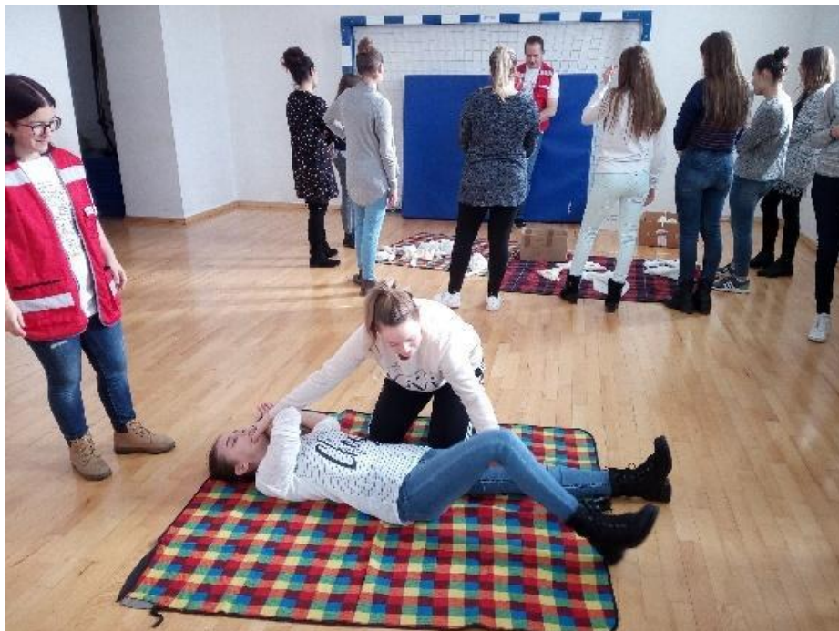
Slika 8. Edukacija studenata Fakulteta za odgojne i obrazovne znanosti u okviru projekta Sigurnost na vodi .