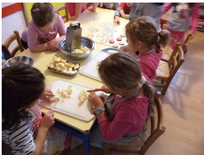
Slika 3. Projekt „Snjeguljica kuha zeleno“