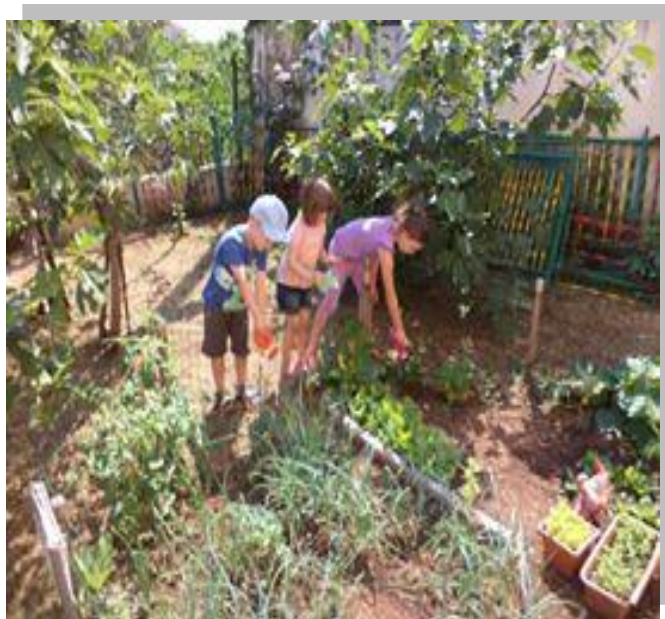
Slika 2. Briga o biljkama u dječjem vrtiću „Snjeguljica“