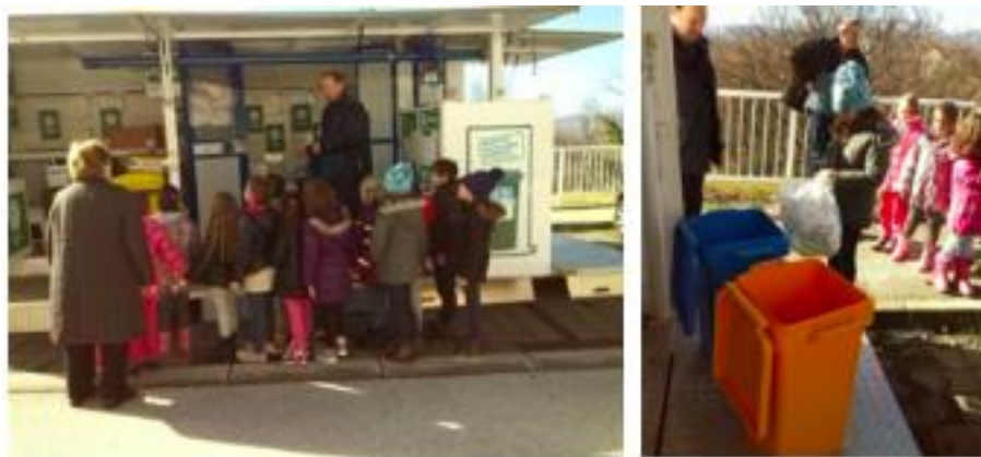
Slika 4. Projekt „From trash to treasure“