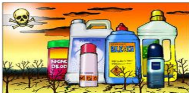
Slika 10. Opasni otpad 10

- otpad koji dolazi iz industrijske proizvodnje, raznih pogona ali i kućanstava, farmaceutskih kompanija i poljoprivrede, a prikuplja se na mjestima s posebnom namjenom za opasni otpad