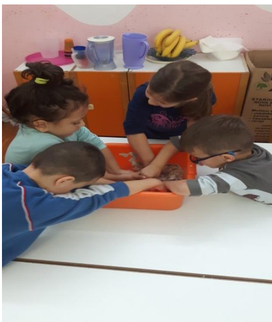
Slika 17. Močenje kartona u vodi