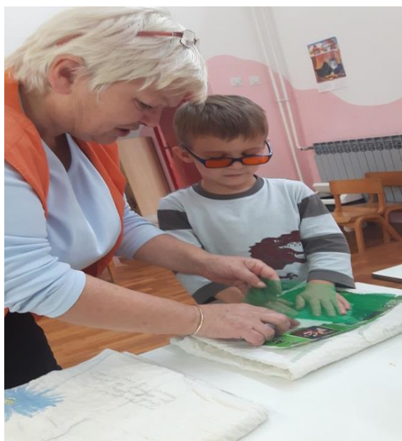
Slika 23.. Skidanje mrežice s novina