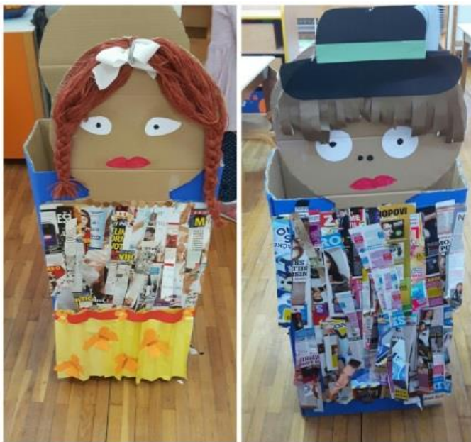
Slika 5. Dječji rad srednje skupine dječjeg vrtića „Jelenko“