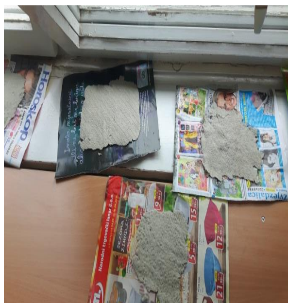
Slika 24. Sušenje novog papira