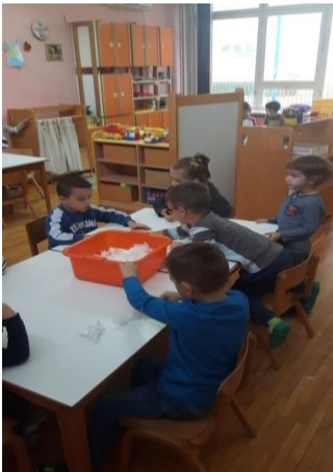
Slika 13. Kidanje ubrusa u posudu

Cijeli postupak recikliranja starog papira prikazan je na idućim fotografijama.