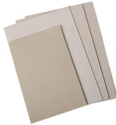
Slika 4. Obični karton 5