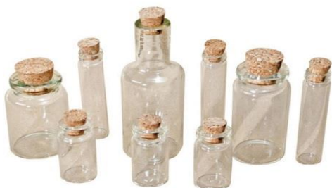
Slika 6. Staklene boce i staklenke 6

- razvrstava ga se zasebno u zelene kontejnere, a u njih ubrajamo staklene boce i staklenke svih oblika i vrsta