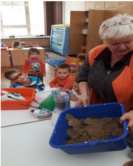
Slika 20. Stavljanje iskidanog kartona u mikser