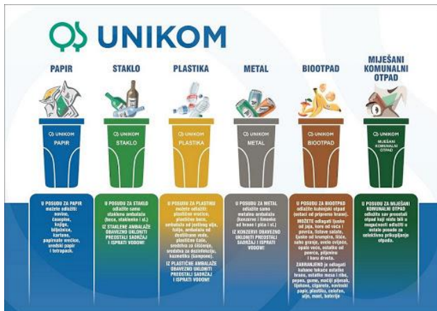
Slika 11. Kontejneri za recikliranje otpada 11