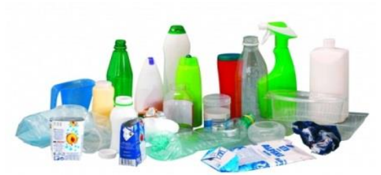
Slika 8. Plastične boce 8