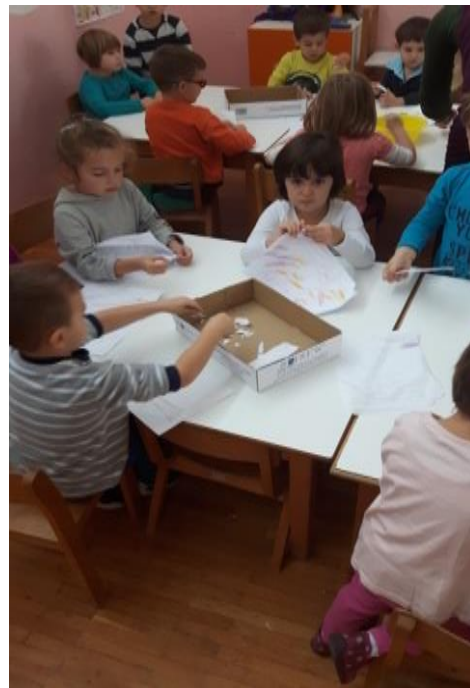
Slika 14. Kidanje dječjih radova u kutiju