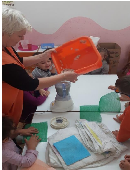
Slika 18. Stavljanje iskidane salvete u mikser Slika 19. Stavljanje iskidanog kartona u mikser