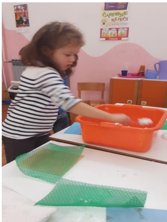
Slika 21. Vađenje papirne kaše na mrežu

Potom smo napravili mrežice na koje smo istresli količinu kaše ovisno o debljini papira koju želimo dobiti. Dobivenu kašu stavili smo na mrežu, poravnali je te odstranili višak vode. Nakon toga smo na mrežu stavili obični papir pa lagano odvojili mrežu i stavili da se osuši, kao što je prikazano na slikama 21, 22 i 23.