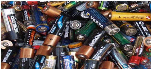
Slika 9. Baterije 9

U elektrotehnici, spoj dvaju ili više istosmjernih i istovrsnih izvora električne energije u kojima se kemijska, toplinska, sunčeva ili nuklearna energija pretvara u električnu energiju. One su opasan otpad koji treba odložiti u crvene posude koje se nalaze na ulazima trgovina i mjestima za skupljanje opasnog materijala.