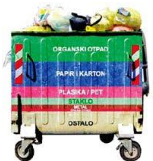
Slika 2. Interaktivan prikaz kategorizacije vrsta otpada po bojama 2