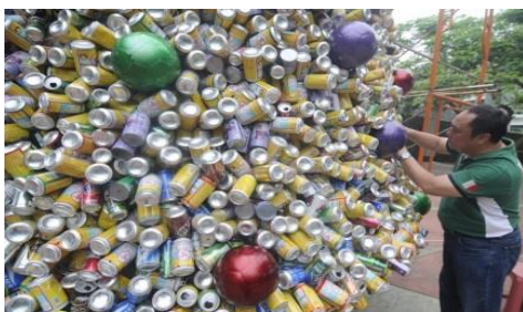
Slika 7. Limenke od pića 7

- razdvajamo ih se zasebno u sive kontejnere