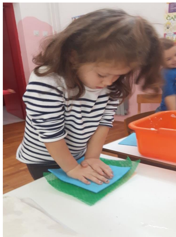
Slika 22. Cijeđenje viška vode sa mreže