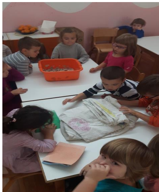
Slika 16. Karton natopljen u vodi