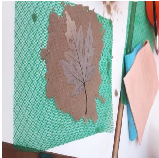
Slika 25. Sušenje novog (recikliranog) papira .

Završna faza pri recikliranju papira je sušenje novodobivenog recikliranog papira kako je i prikazano na slikama 24 i 25.