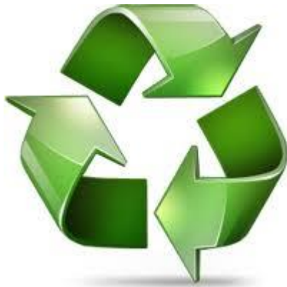
Slika 12. Simbol za recikliranje 12

Prvi simbol za recikliranje dizajnirao je 1970. godine student Gary Anderson na Sveučilištu Južne Kalifornije u Los Angelesu pri natjecanju za dizajnersko rješenje koje je održano na prvi Dan planeta Zemlje koji se tom prilikom slavio. Potrebno je razlikovati dva pojma različitog značenja. „Reciklirano“ (engleski “Recycled”) – predmet koji je već nastao procesom reciklaže i „može se reciklirati“ (engleski “Recyclable”) – predmet koji tek trebamo odvojiti u kantu za reciklažu.