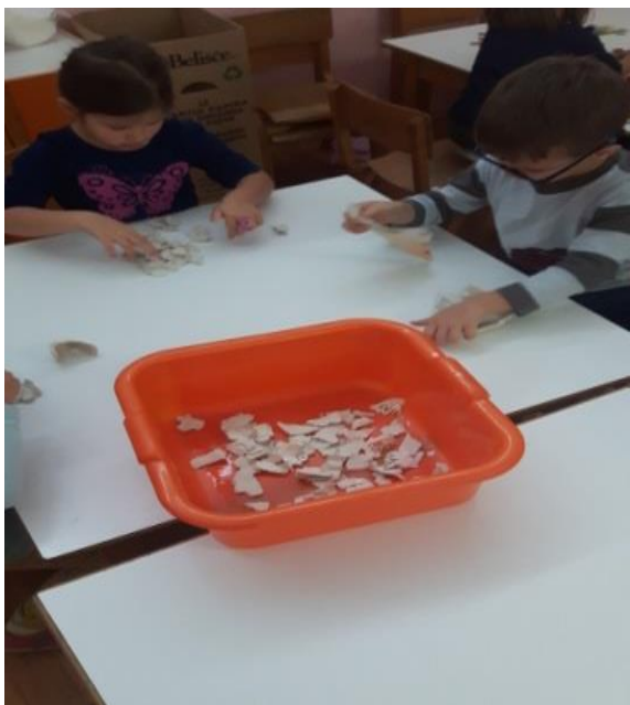
Slika 15. Kidanje kartona u posudu s vodom