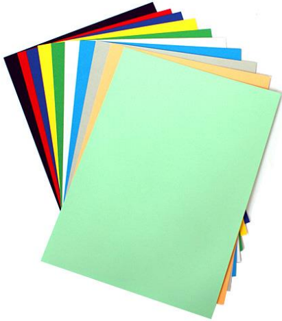
Slika 3. Karton u boji 4

- razvrstavamo ih zasebno u plave kontejnere, a to mogu biti sve vrste publikacija: novine, promotivni materijali, katalogi, sva vrsta pismena, tvrdi papir i karton, bilježnice