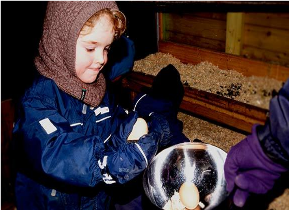
Slika 6. Skupljanje jaja u dječjem šumskom vrtiću Stockholmsgave Centrum.

objektima ili u šatorima. Osim navedenog djeca u šumskim vrtićima usvajaju i one vještine koje se uče i stječu u klasičnim vrtićima, od slikanja, pjevanja, plesanja, čitanja, pisanja i matematičkih vještina (Muhić, 2020.).