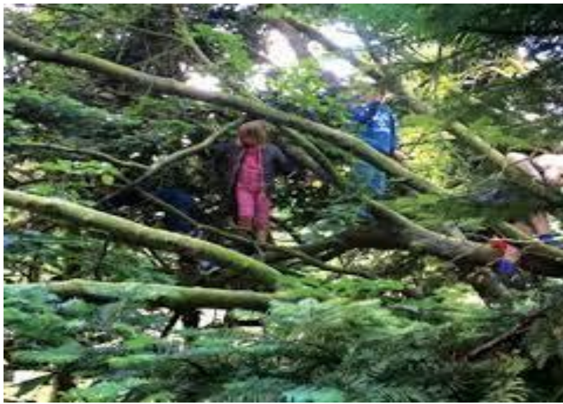
Slika 2. Spretnost i okretnost djece šumskih vrtića. Izvor: Early horizons, 2017.

https://www.asg.com.au/doc/default-source/early-horizons/asg_eh_2017_issue_6-1_web_fa.pdf?sfvrsn=2 , pristupljeno:26.08.2021.