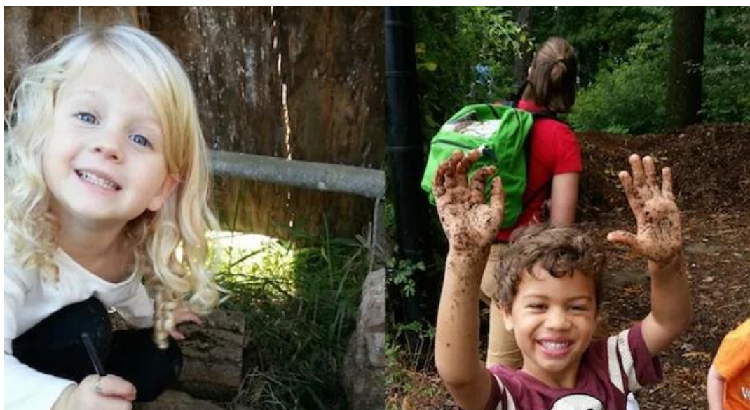
Slika 4. Djeca danskog šumskog vrtića.

U šumskim dječjim vrtićima u Danskoj aspekt obrazovanja za djecu od tri do šest godina odvija se bez formalnog nastavnog plana i programa. Djeca i odgojitelji u prirodnom okruženju pronalaze prilike za učenje koristeći dostupne prirodne didaktičke materijale iz šume kao obrazovne alate (Mills, 2009.). Djeca su sretna i vesela u istraživanju prirode kao što je pokazano slikom 4.