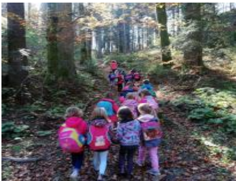
Slika 7. Istraživači šumske čarolije.

Polazeći od činjenice da je kretanje osnovna ljudska potreba koja za dijete ima važnu ulogu u jezičnom, socijalnom i kognitivnom razvoju, da djeca, upoznajući prirodu i njezine blagodati izravno stječu pozitivan i odgovoran odnos prema prirodi, prije će zavoljeti prirodu i razviti ekološku osviještenost, veliki dio svoga vremena provode u šetnji po prirodi kroz obližnje šume kao „Istraživači šumske čarolije“ ( https://more.rivrtici.hr/istrazivaci-sumske-carolije , pristupljeno: 27.08.2021.).