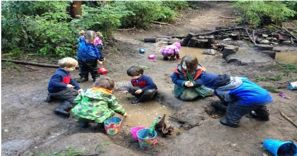
Slika 1. Igra djece u prirodnom okruženju.

šumskom okruženju (Valjun Vukić, 2013.). Kako to u stvarnom životu izgleda prikazano je na slici 1.