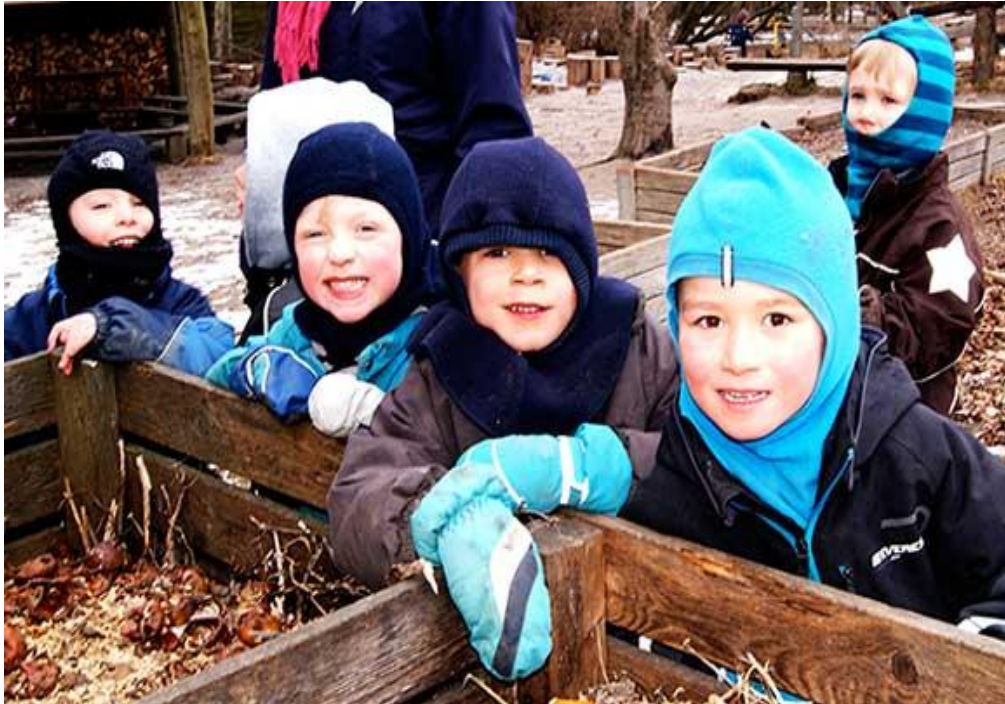
Slika 5. Provjera posuda za kompost u šumskom dječjem vrtiću Stockholmsgave Centrum.