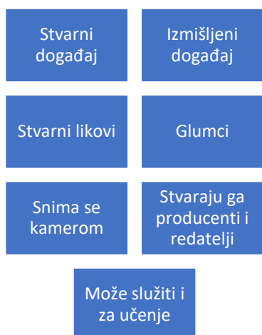
Prilog 1: karakteristike igranog i dokumentarnog filma