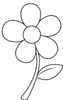
Prilog 3: cvjetić osobina