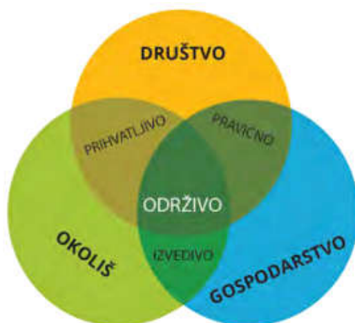
Slika 1: Sastavnice održivog razvoja

Prirodni okoliš nazivamo još i ekološkom komponentom. Ona govori o tome kako je priroda temelj za razvoj društva i gospodarstva. Važno je shvatiti da su neki resursi, bez kojih ne možemo zamisliti život, zapravo neobnovljivi i ograničeni. Takve resurse moramo naučiti koristiti racionalno te im tražiti zamjenu.(Agencija za odgoj i obrazovanje, 2011) Ova komponenta uključuje razvoj strategija za očuvanje okoliša i stabilnosti klime. (Savez društava distrofičara Hrvatske, 2021)