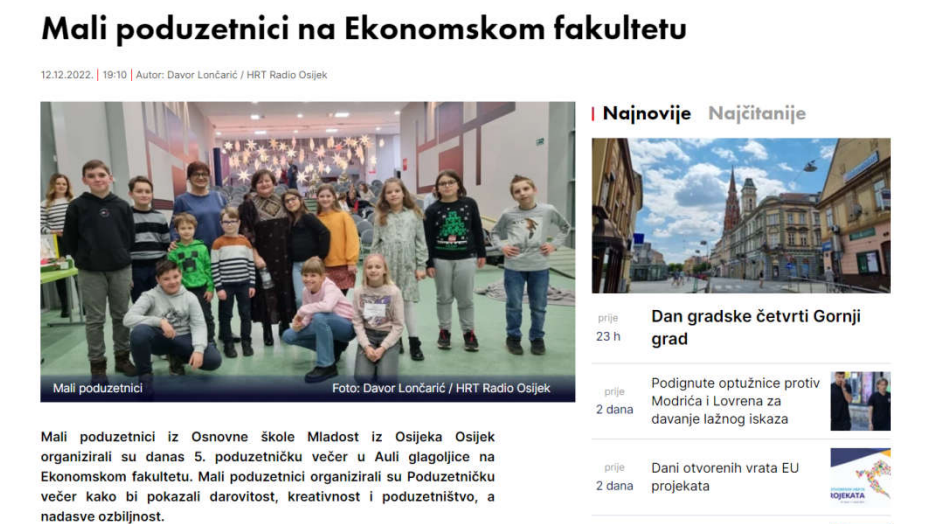
Slika 8: Internet objava o Večeri poduzetništva na Ekonomskom fakultetu u Osijeku

U prosincu 2022. godine održana je Večer poduzetništva na Ekonomskom fakultetu u Osijeku. Na Večeri poduzetništva učenici su uz prigodan program predstavili svoju izvannastavnu aktivnost i sve čime se oni bave.