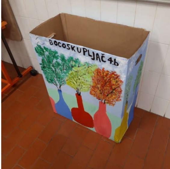
Slika 9: Razredni bocoskupljač

Učenici su izradili razredni bocoskupljač. U njega odvajaju plastične boce, prodaju ih te na taj način zarađuju za izlete.