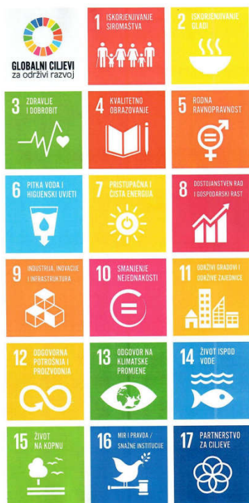
Slika 2: Prikaz 17 ciljeva za 2030. godinu

održive oblike potrošnje i proizvodnje, poduzeti postupke protiv klimatskih promjena, očuvati oceane, mora i morske resurse, spriječiti uništavanje biološke raznolikosti, promovirati miroljubivo i uključivo društvo te učvrstiti globalno partnerstvo. (Odrasz, 2015)