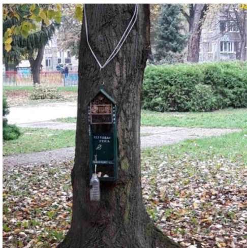
Slika 10: „Restoran“ za ptice i „hotel“ za kukce

U drugom razredu napravili su „restoran“ za ptice i „hotel“ za ptice. „Restoran“ za ptice i „hotel“ za kukce objesili su na drvo pored njihova razreda te se brinu da ptice i kukci imaju hrane i vode. Na taj način razvijaju brigu o životinjama.