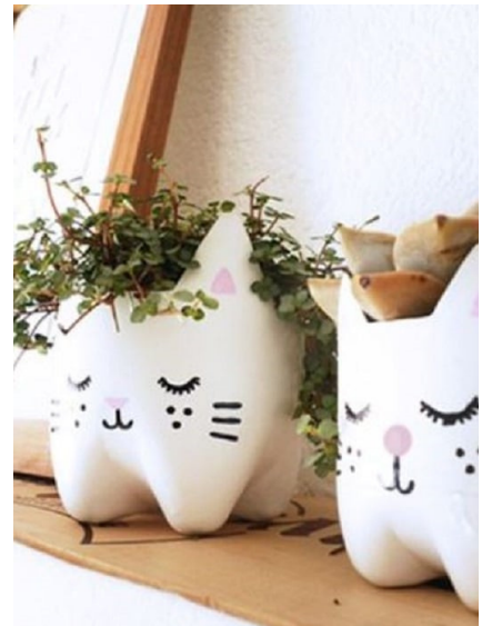
Slika 11. Sadilica za biljke od plastičnih boca.