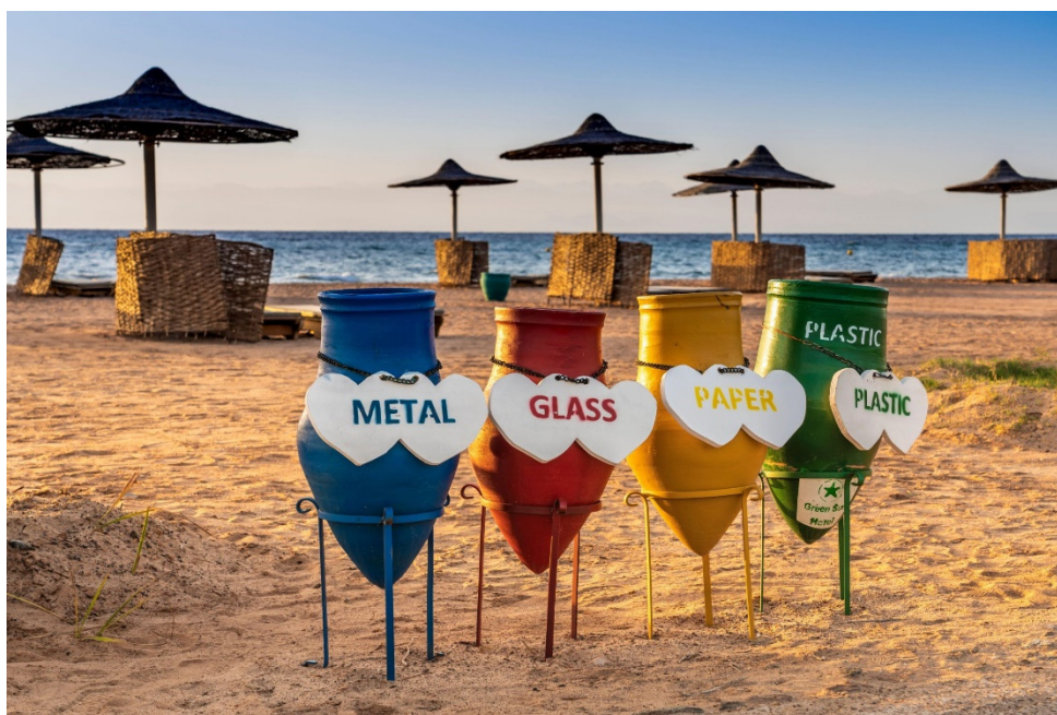
Slika 3. Razvrstavanje komunalnog otpada.