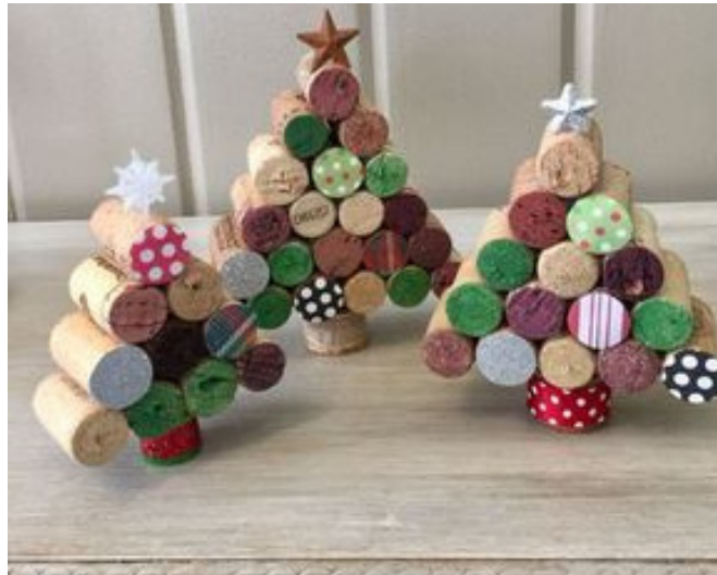
Slika 14. Ukraši od plutenih čepova.