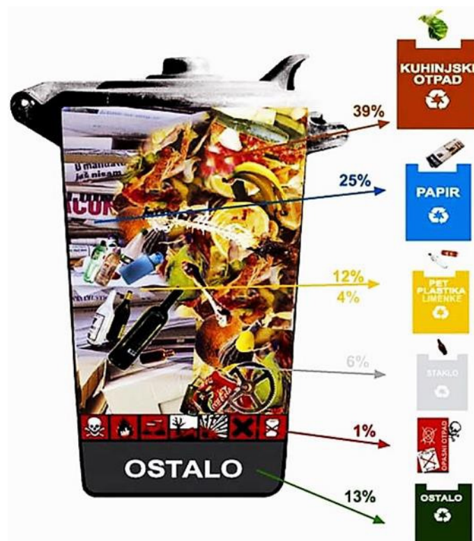
Slika 2. Sastav miješanog komunalnog otpada.

Pravilno postupanje s otpadom mora biti prioritet svakog pojedinca, države, te posebno jedinica lokalne i regionalne samouprave. Njihov zadatak je uspostaviti cjeloviti sustav održivog gospodarenja otpadom i zaštititi okoliš“ (Bogut i sur., 2021, str. 32)