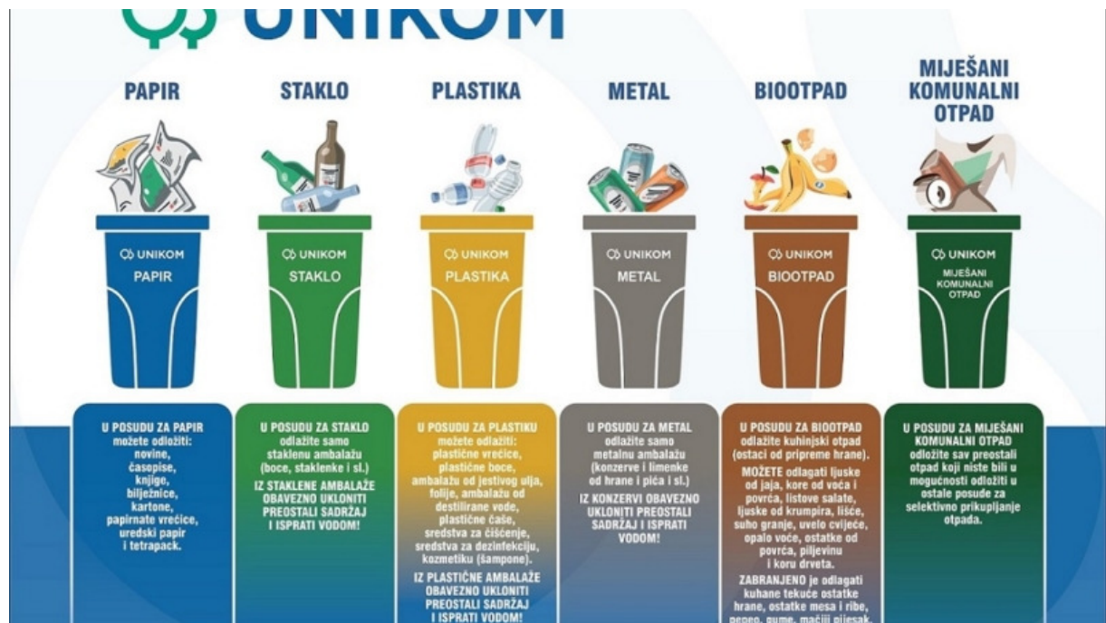
Slika 17. Odvajanje otpada.

Baterije su se smjestile u kategoriju opasnog otpada jer sadrže teške metale (živa, olovo, kadmij) koji su vrlo otrovni. Recikliranjem baterija smanjuje se emisija teških metala (živa, olovo, kadmij) u prirodu. Baterije se prema zakonu ne smiju bacati u komunalni otpad. Treba ih skupljati te bacati u spremnike namijenjene isključivo baterijama.