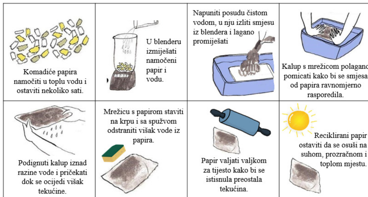
Slika 19. Kućno recikliranje papira

Cilj je kod učenika razviti svijest o važnosti razvrstavanja, odlaganja zbrinjavanja i iskorištavanja otpada u školi i domu, te poticanje pravilnog načina odlaganja otpada koji nastaje tijekom dana. (Pap, T., 2012)