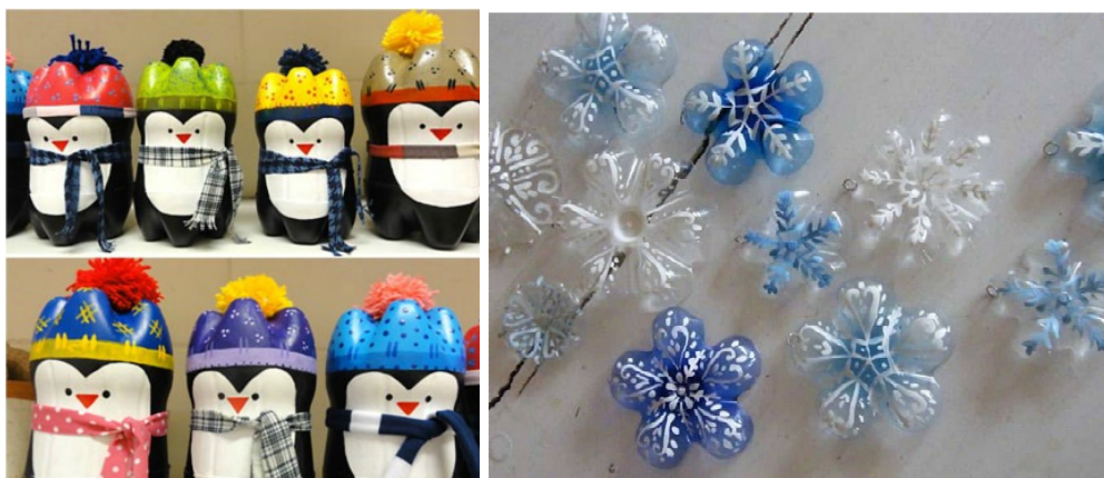
Slika 13. Ukrasi od plastičnih boca.