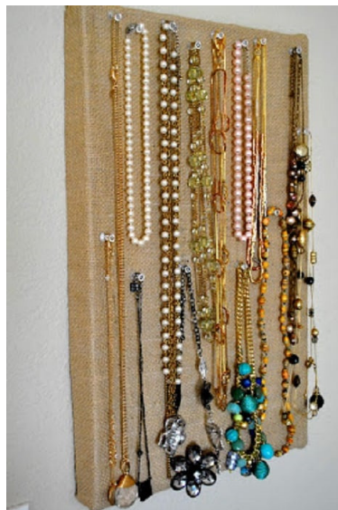
Slika 10. Organizator nakita od kutije za cipele.