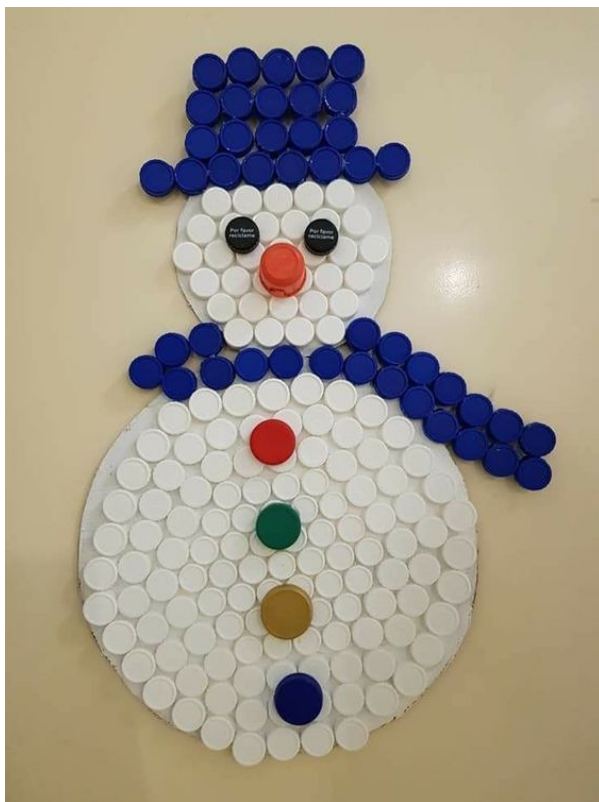
Slika 15. Ukraši od plastičnih čepova.