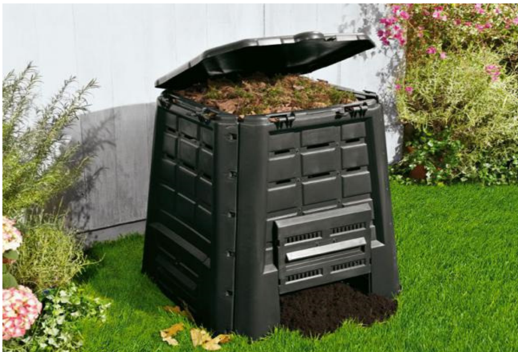
Slika 21. Kupljeni komposter.

Kućno kompostiranje vrlo je jednostavno i praktično. Proces je moguće svesti u svega nekoliko koraka koji se mogu vidjeti niže u prilogu.