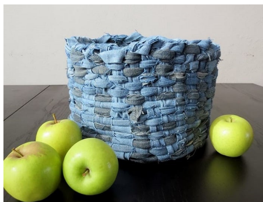
Slika 7. Posuda za voće od stare odjeće.

Prenamjenom namještaja, kućanskih aparata i sličnoga mogu se izraditi neobični, jedinstveni kreativni, ali i korisni predmeti. Na slikama sljedećim slikama nalazi se nekoliko primjera prenamjene starih predmeta koji su umjesto da završe kao otpad dobili novu namjenu.