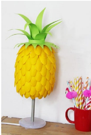
Slika 9. Lampa od plastičnog posuda.