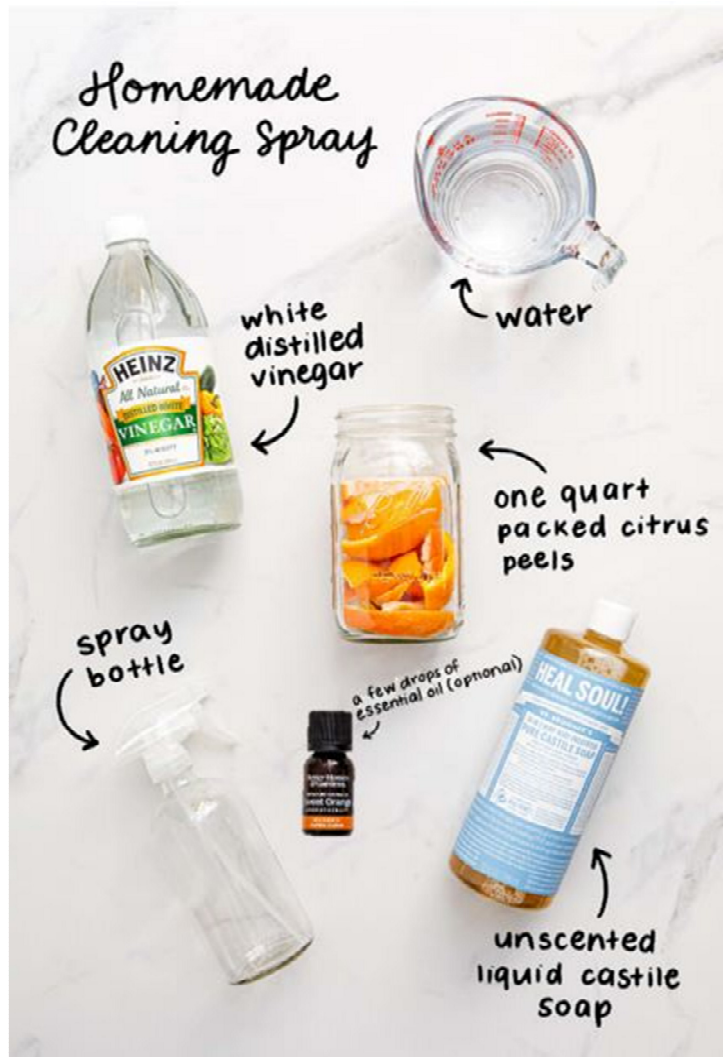
Slika 6. Sredstvo za čišćenje.