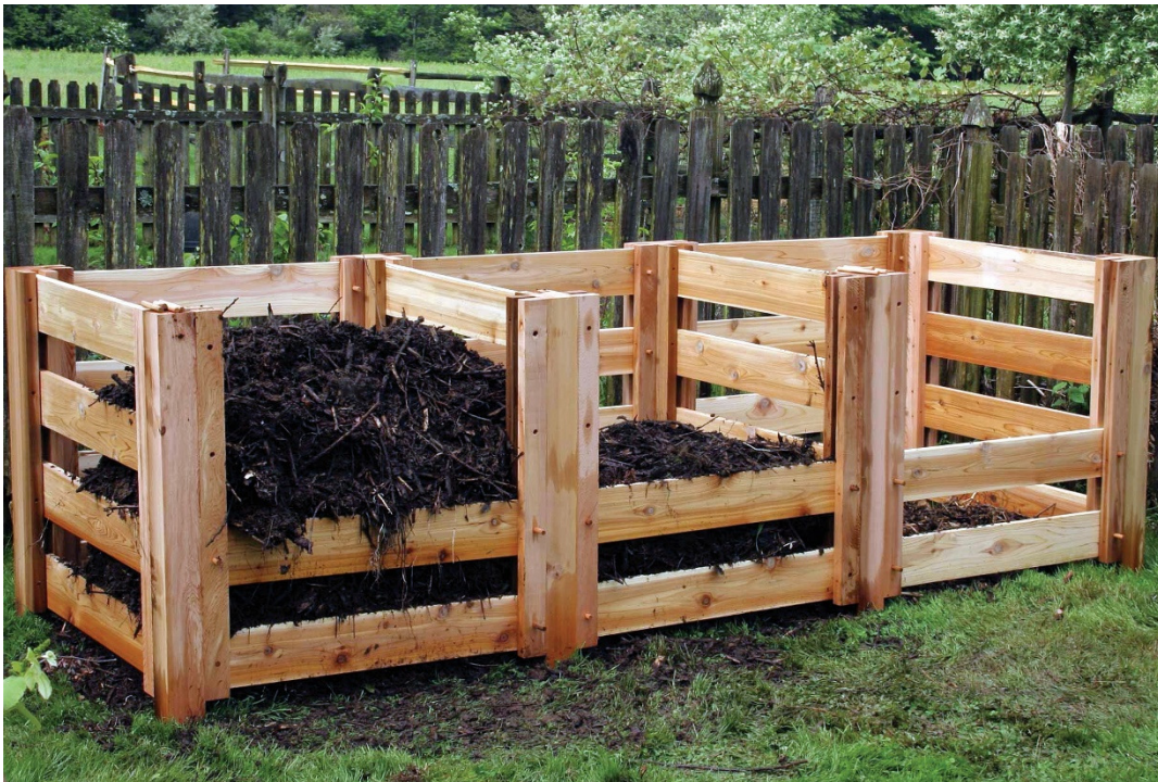
Slika 20. Izrađeni komposter.

Prije samog procesa kompostiranja potrebno je nabaviti komposter. Komposter se mogu izraditi od jednostavnih materijala (palete, žica) ili kupiti.