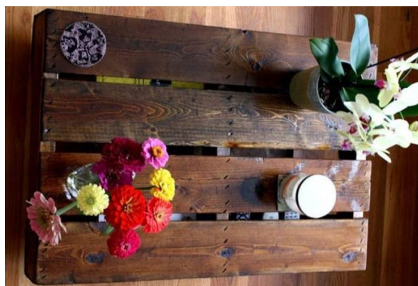
Slika 8. Stolić od paleta.