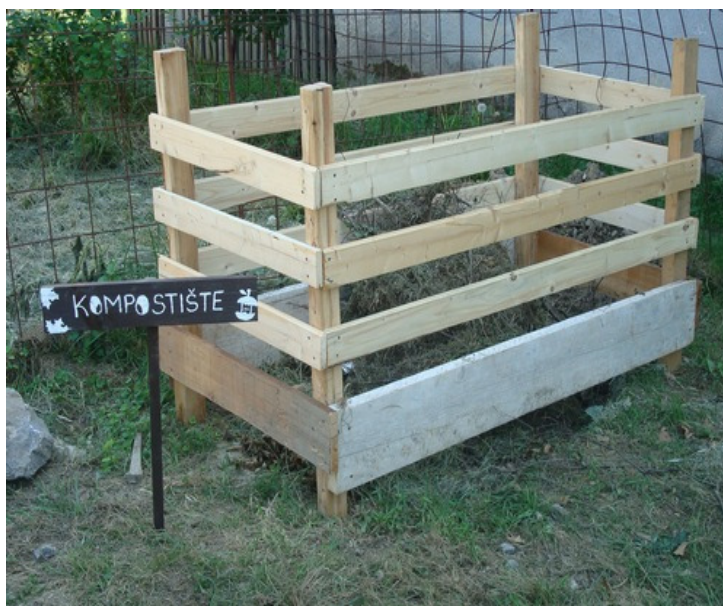
Slika 23. Izrada školskog kompostišta.