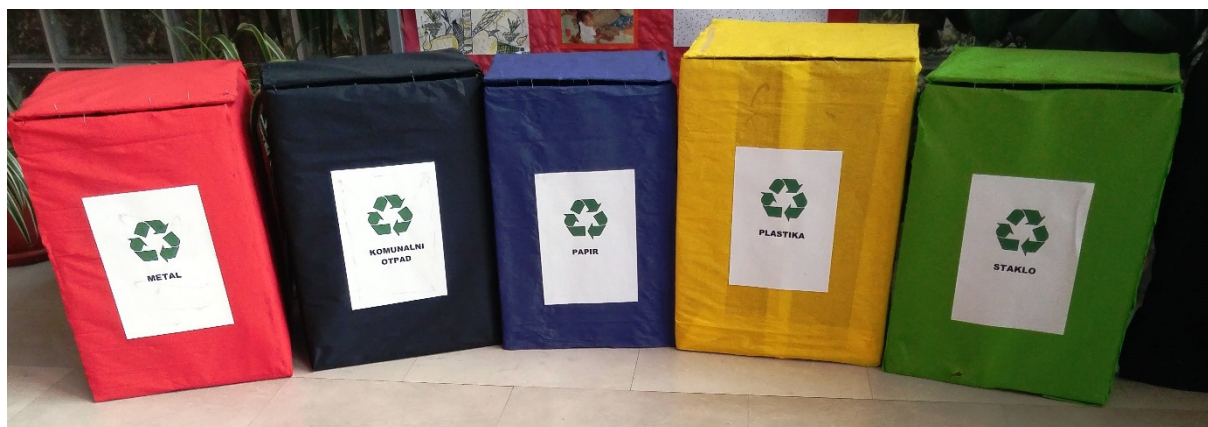
Slika 18. Primjer zelenog otoka u školi.