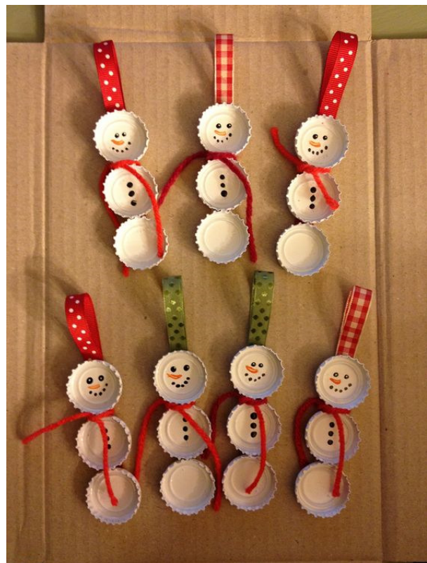
Slika 16. Ukraši od metalnih čepova. Izvor: https://www.pinterest.com/pin/422281203171278/