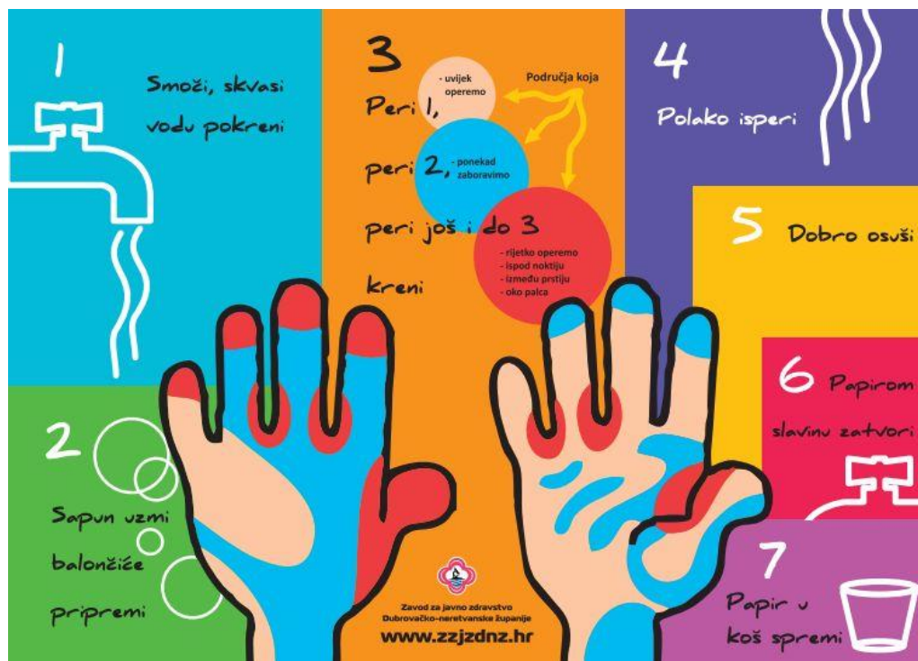
Slika 1. Plakat o pranju ruku za dječje vrtiće (Matić, 2020, str. 16)

Lendić (2020) naglašava kako osim važnosti higijene o pravilnom pranju ruku, naglasak se