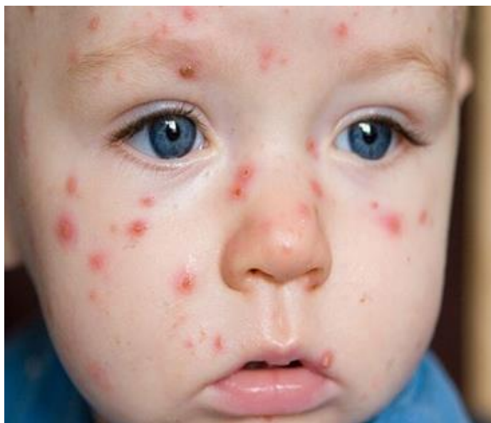
Slika 4. Vodene kozice (Burmas, 2018, str. 15)

Prema Mardešić i sur. (2000) inkubacijsko razdoblje može trajati od 10 do 20 dana, zaraza se javlja s povišenom tjelesnom temperaturom, osjećajem umora i izbijanjem osipa, kod