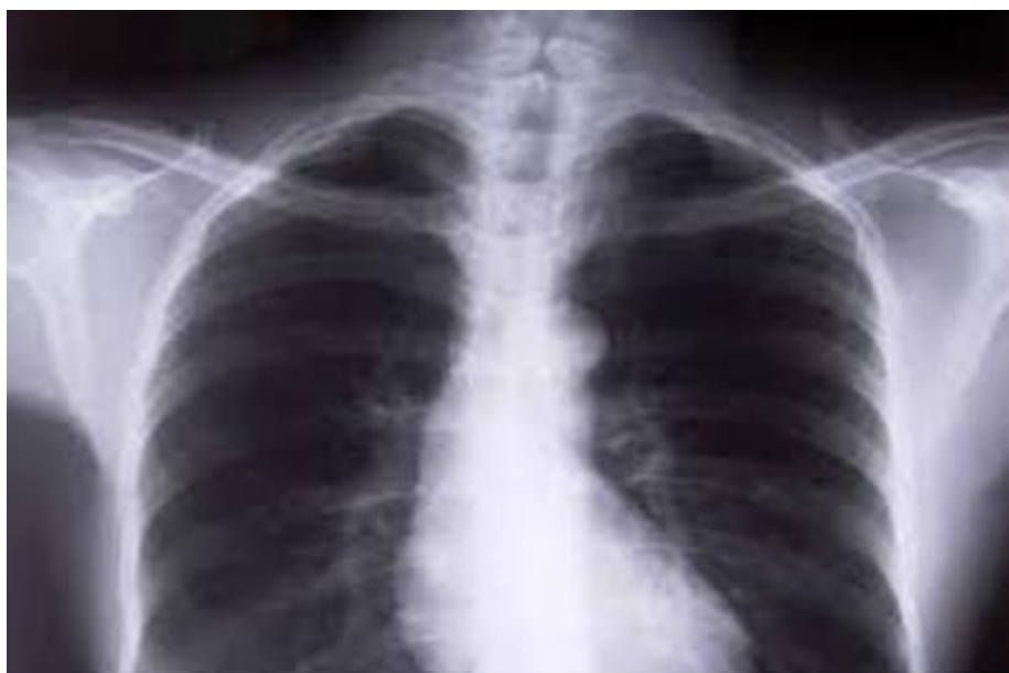
Slika 2. Prikaz RTG slike upale pluća (Matić, 2020, str. 7)

(Matić, 2020). Upala pluća predstavlja vodeći uzrok smrtnosti kod djece diljem svijeta, virusi i bakterije koji su uobičajeno prisutni u nosu djeteta ili njegovom grlu, imaju mogućnost da zaraze pluća ako ih osoba udiše, širenje se također može pojaviti putem kašljanja ili kihanja, a sama pneumonija može se širiti i putem krvi, posebno tijekom i neposredno nakon djetetovog rođenja (Matić, 2020). Liječenje pneumonije uključuje primjenu antibiotika te stvaranje optimalnih uvjeta okoline odnosno provjetravanje zraka u prostorijama sa zagađenim zrakom (Matić, 2020). Djecu koja pokazuju blaže i umjerenije simptome bolesti preporučuje se da se liječe kod kuće gdje se usmjerava važnost na snižavanje povišene tjelesne temperature antipireticima te zadovoljavanje veće potrebe za unos tekućine kao i praćenje mogućih promjena simptoma, dok u slučaju djece kod kojih je oblik bolesti teži, djeca se trebaju hospitalizirati gdje će im se omogućiti dodatna dijagnostika putem radioloških i mikrobioloških testova da bi se potvrdila pneumonija i identificirao uzročnik same bolesti (Lendić, 2020). Na slici 2. prikazan je RTG slike upale pluća.