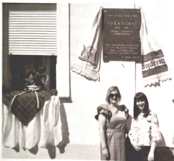
Fotografija 1. Spomen-ploča Luki Lukiću povodom manifestacije „Lukićevi dani“.

Indirektna komunikacija glazbom i pomoću glazbe može se ostvariti i drugim simbolima. Jedan od načina kojima se može komunicirati s glazbenicima iz prošlosti je i pomoću simbola (tragova) koji su postavljeni njima u čast. Primjer takve komunikacije je spomen-ploča koja označava kuću u kojoj je boravio neki istaknuti glazbenik, a kao primjer može poslužiti spomen-ploča postavljena u čast Luki Lukiću na kuću u Zagrebačkoj ulici 328 u Slavonskom Brodu (Križ, 2015). Ploča obilježava kuću u kojoj se rodio i umro taj učitelj, etnograf i etnomuzikolog (fotografija 1.). Još jedan recentni slavonskobrodski primjer je i spomenik Miji Čorak Slavenskoj (fotografija 2.) postavljen 2022. godine. Ova prva hrvatska primabalerina, koreografkinja i baletna pedagoginja, iako po primarnoj vokaciji nije glazbenica, ipak simbolizira i glazbu, jer balet i glazba imaju čvrstu međusobnu asocijativnu poveznicu. Priložene fotografije potvrđuju lokalnu važnost takvih simbola, jer pokazuju da se lokalni događaji (manifestacija Lukićevim stopama i otkrivanje spomenika povodom 20. obljetnice smrti Mije Čorak Slavenske) vezuju uz njih čineći ih tako aktivnim dionicima kulturnog života.