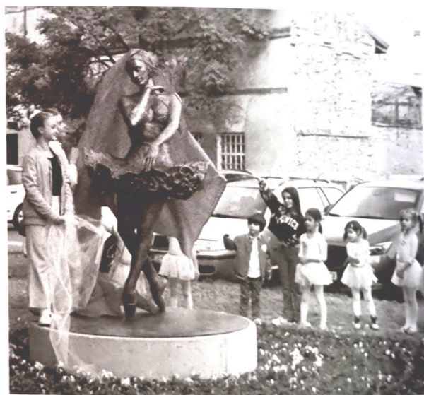
Fotografija 2. Svečanost otkrivanja spomenika Miji Čorak Slavenskoj (Grad Slavonski Brod. Otkriven spomenik Mije Čorak Slavenske).

Različite javne ustanove također mogu imati i funkciju simbola glazbe, pa se tako Slavonski Brod može pohvaliti s Glazbenom školom Slavonski Brod i Kazališno-koncertnom dvoranom Ivana Brlić-Mažuranić . Osim postavljanjem spomenika ili različitih spomen-obilježja, kao trajni podsjetnik na doprinos nekog glazbenika, po njemu se može nazvati i ulica ili trg nekog grada, primjerice: Trg Vatroslava Lisinskog u Osijeku ili Ulica Ferde Livadića u Zagrebu (Popović, 2022).