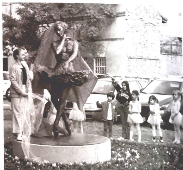
Fotografija 2. Svečanost otkrivanja spomenika Miji Čorak Slavenskoj (Grad Slavonski Brod. Otkriven spomenik Mije Čorak Slavenske).

Različite javne ustanove također mogu imati i funkciju simbola glazbe, pa se tako Slavonski Brod može pohvaliti s Glazbenom školom Slavonski Brod i Kazališno-koncertnom dvoranom Ivana Brlić-Mažuranić . Osim postavljanjem spomenika ili različitih spomen-obilježja, kao trajni podsjetnik na doprinos nekog glazbenika, po njemu se može nazvati i ulica ili trg nekog grada, primjerice: Trg Vatroslava Lisinskog u Osijeku ili Ulica Ferde Livadića u Zagrebu (Popović, 2022).