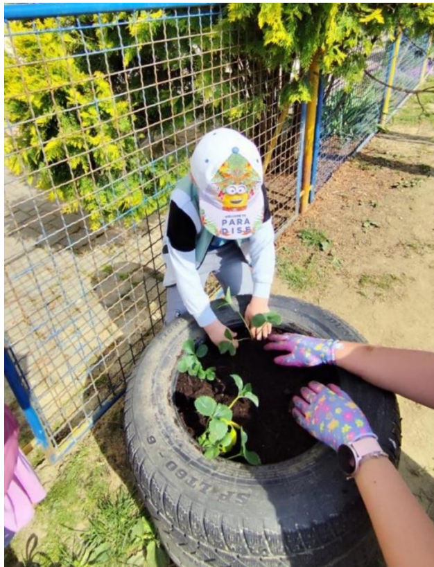
Slika 5. Dio ekološkog vrta DV „Smokvica”, Luka

Što se tiče aktivnosti uređenja vrta u kojoj sudjeluju djeca i odgojitelji, najvažnije je to da se sve ubere i iskoristi, a djeca znaju da sve što se ne iskoristi baca se u kompost. U pravilu imaju jednu akciju jesenskog čišćenja vrta kada se ubiru zadnji plodovi, ako je ostao koji korijen cikle, mrkve i sl. Zatim se pograba lišće i to se sve stavi u kompost. One teže poslove odrađuju sudionica intervjua i domar vrtića, oni pripremaju gredice i zemlju za sadnju. Najvažnije je to da se aktivnosti odrađuju dobrovoljno prema želji i interesu. Dječji vrtić „Smokvica” doista se može pohvaliti sa svojim „zelenim tetama” koje imaju sve potrebne kompetencije i interes za održavanje ekološkog vrta. Princip odlaska u vrt je kao i za svaki centar aktivnosti. Aktivnosti se ponude djeci, a svatko sudjeluje prema svojim interesima i mogućnostima. Mlađa djeca su npr. malčirala jagode slamom ili skupljala puževe dok su starija djeca zalijevala i sadila. Dječji vrtić „Smokvica” vodi se kao ekološki vrt, jer nema kemijske prihrane, kemijske zaštite, nema umjetnih sredstava za tretiranje štetočina, imaju vlastiti kompost, skupljaju kišnicu za zalijevanje i doista imaju jednu predivnu i zaokruženu ekološku priču. Imaju i manji vrt u područnom vrtiću u Luki u kojem uglavnom zbog manjka prostora imaju povišene gredice napravljene od guma. (Slika 5)