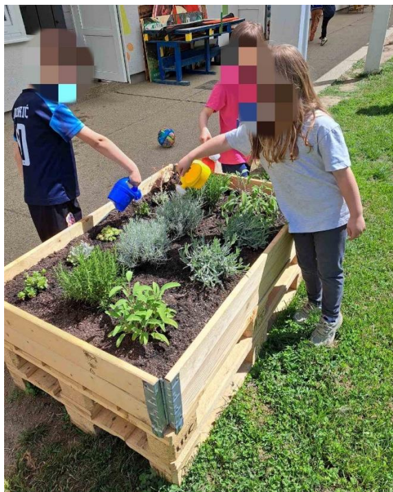
Slika 6. Zalijevanje biljaka u vrtu DV „Cvrčak”, Virovitica (ustupila R. Vedrinski 5. lipnja 2024.)