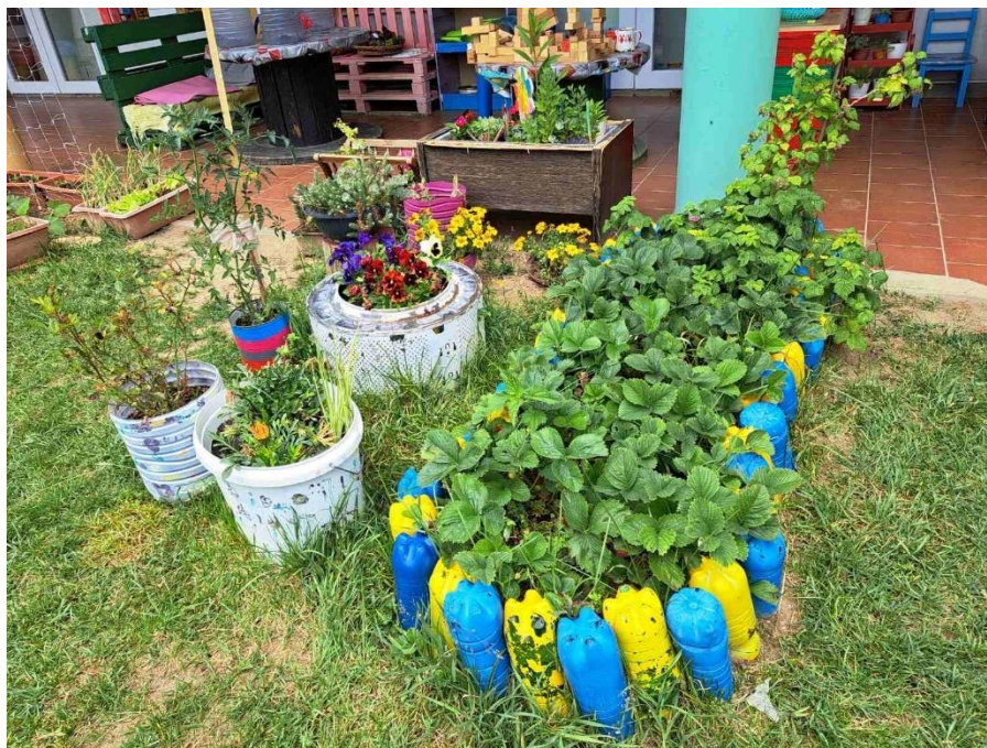
Slika 7. Dio ekološkog vrta DV „Cvrčak”, Virovitica