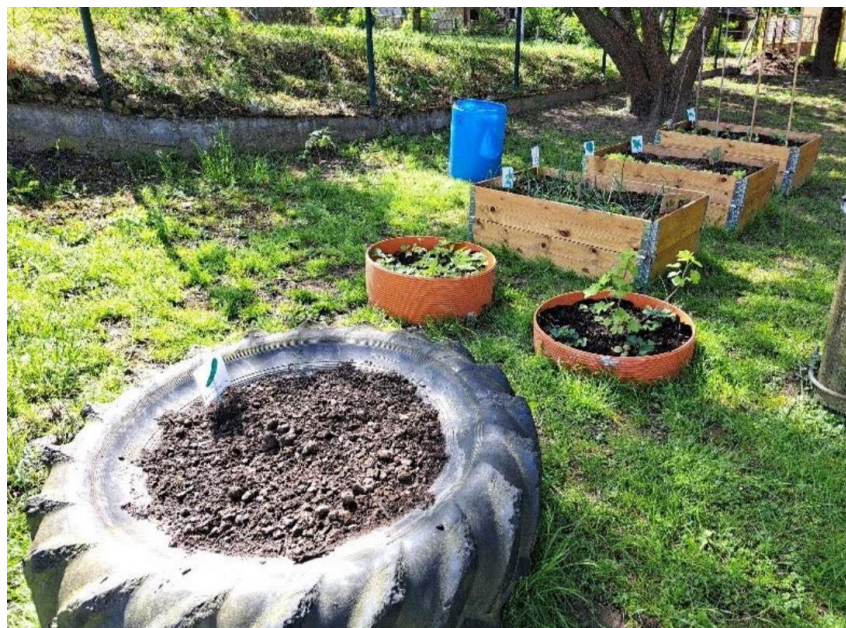
Slika 3. Ekološki vrt DV „Smokvica”, Dubravica

sastavni dio vrta, traktorske su gume prenamijenjene za gredice ili su iskoristili neke druge materijale i tamo se također uspješno sije i sadi. Fotografiju vrta u Dubravici (Slika 3) i primjera dijela „tržnice” (Slika 4) možete pogledati u nastavku poglavlja.