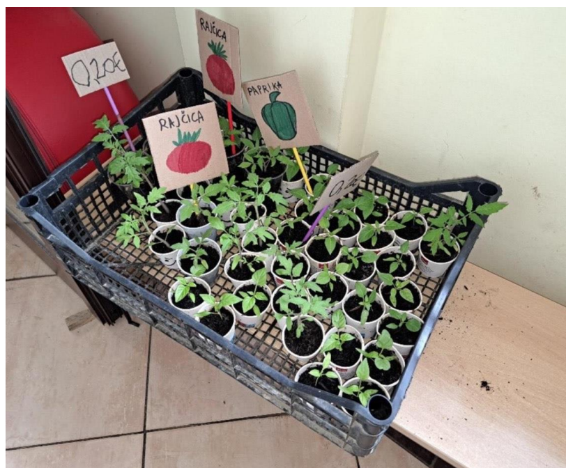
Slika 4. Dio „tržnice” sadnica DV „Smokvica”, Dubravica