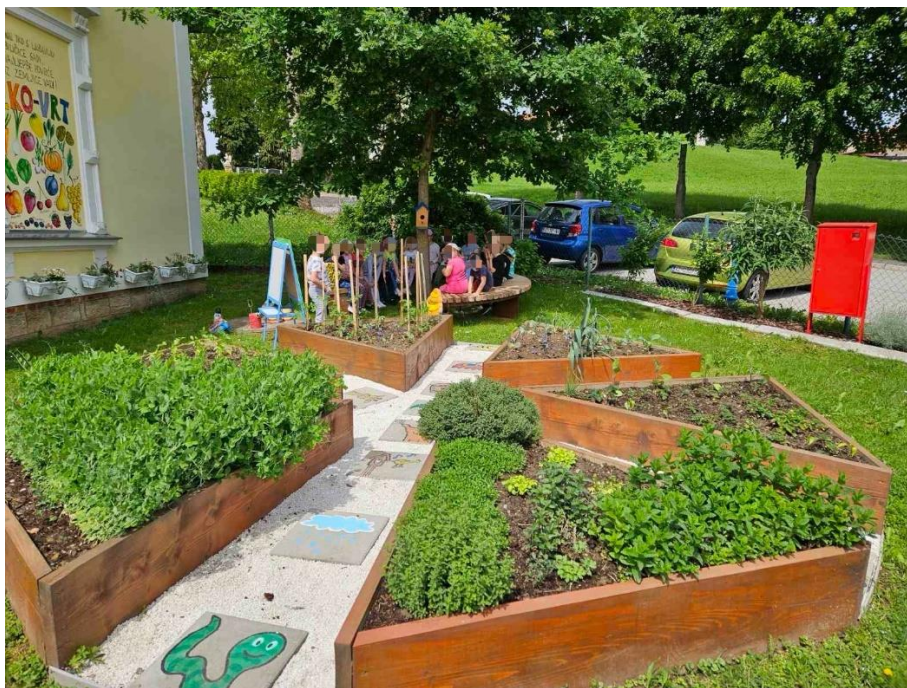
Slika 1. Ekološki vrt DV „Vinica” – Povišene povrtno gređice

materijala s time da je napomena na ekološkom održavanju vrta. Od uvjeta potrebnih za kvalitetno održavanje vrta navodi prije svega dobru organizaciju i volju odgojitelja te suradnju s roditeljima i lokalnom zajednicom. Glavni cilj uzgoja ekološkog vrta je da djeca ubiru i cijene plodove svoga truda i rada, ali i da sljedećim generacijama pokažu važnost vođenja ekološkog vrta i koliko je on vrijedan za djecu vrtićke dobi. Kao odgojno-obrazovnu ulogu navodi poticanje strpljivosti, samokontrole, radnih i praktičnih aktivnosti. Samo uređenje vrta i okoliša djeci predstavlja veliku radost, osjećaj postignuća i ponosa, iako iziskuje mnogo vremena i truda. S vremenom djeca primjećuju napredak te stječu sve više znanja i vještina. Ekološki vrt Dječjeg vrtića „Vinica” ima i nutritivnu vrijednost, svi plodovi vrta se koriste u prehranbene svrhe, zajedno s djecom prave se različite povrtno ili voćne salate, okušali su se i u pripremanju zimnice, brali maslačke i pokušali praviti med koji će djeca konzumirati kada dozrije. Humek navodi da je vrt Dječjeg vrtića „Vinica” ekološki iz razloga što sve uzgajaju na prirodan način, nema nikakvih pesticida, uključene su ručice djece i odgojitelja. Dječji vrtić „Vinica” doista može biti ponosan na svoj ekološki vrt. Proizvode zdrave i raznolike plodove, povrće, voće i začinsko bilje na ekološki prihvatljiv način koje i upotrebljavaju, uglavnom u prehranbene svrhe. (Ksenija Humek, 3. lipnja 2024., prema prijepisu intervjua, Prilog 1)