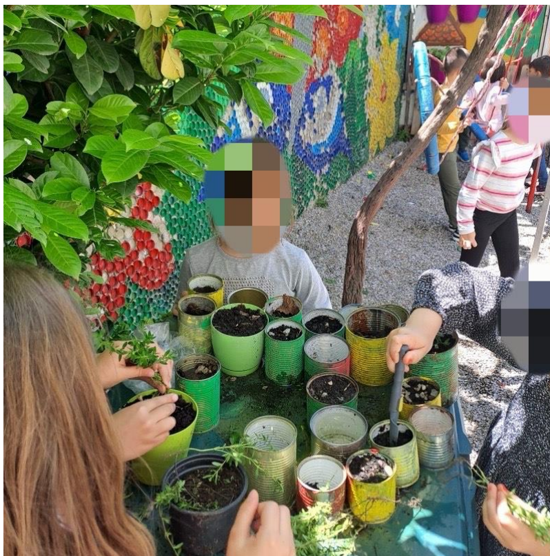
Slika 8. Sadnja sadnica - DV „Šareni leptirić”, Solin

Što se tiče prostorno-materijalnih uvjeta vrt su u početku stavili u sredinu dvorišta dječjeg vrtića, ali to je djeci uzimalo prostor za igru i bilo ga je teže održavati, zatim su ga premjestili na prikladniji dio dvorišta. Delić smatra da roditelji i djeca zbog užurbanosti gradskog života i jednostavnosti brzih i gotovih proizvoda nemaju mogućnost proizvoditi vlastitu hranu i da je ekološki vrt pravi primjer omogućavanja takvog iskustva. Želja im je roditelje i djecu osvijestiti o važnosti zdrave prehrane, hrane koju jedemo i njezine uravnoteženosti. Navodi kako je odgojno-obrazovna uloga održavanja ekološkog vrta sama mogućnost pružanja djeci onog što je dobro i korisno za njih i svijet u kojem žive, radom u vrtu razvijaju se motoričke sposobnosti, senzorna integracija te razvijanje pozitivne slike o sebi, doživljavanje sebe kao vrijednog pojedinca koji sudjeluje u aktivnostima važnim za zajednicu u kojoj živi. Djeca uče o vještinama koje će im biti korisne u životu, ali će i osvijestiti važnost sudjelovanja u vrtlarskim aktivnostima. Plodovi iz vrta koriste se u pripremi ručka ili užine, a prošle godine, s obzirom na to da je marelica bila doista