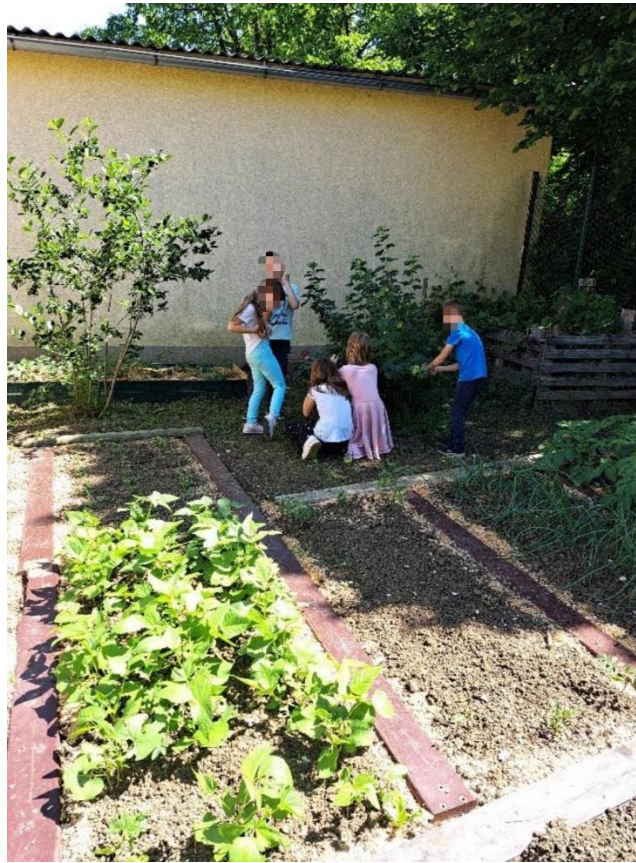
Slika 2. Ekološki vrt DV „Smokvica”, Pojatno. (ustupila M. Prstačić Ljubić, 4. lipnja 2024.)

proizvodi vrta, ideja je od početka bila da djeca osvijeste proces od sjemena do tanjura i da sve što je u tanjuru „ nije došlo iz dućana, nije palo s neba ili da to mama ima negdje skriveno u kuhinji. ”