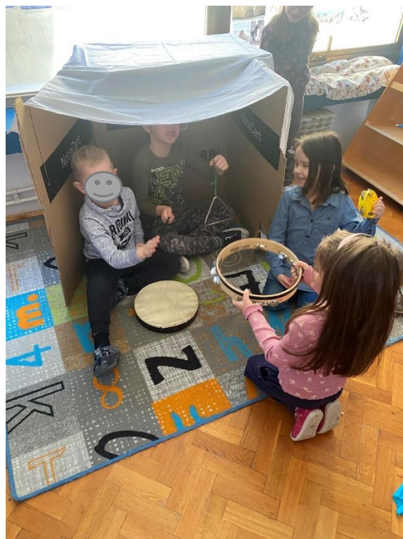
Slika 10. Djeca u korištenju glazbenih instrumenata