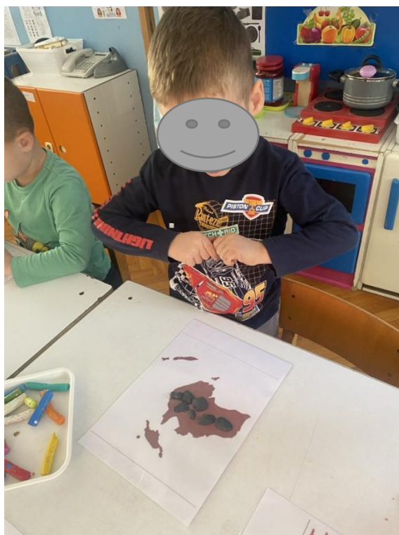
Slika 3. Korištenjem plastelina dječak oblikuje kontinent

Na stolovima je djeci bio ponuđen plastelin i plastificirane karte svijeta (Slika 3). Djeca su međusobno raspravljala koji bi sve kontinenti mogli to biti. Zatim je dječak K. M. uzeo atlas koji se nalazi u našoj sobi dnevnog boravka i otvorio atlas te su djeca, gledajući u kontinente koji se nalaze na plastificiranim fotografijama, uspoređivala s kartama u atlasu i zajednički dolazila do naziva kontinenata. Dok su neka djeca poučavala kontinente, druga su uzela plastelin i upotpunjavala plastificiranu fotografiju kontinenta bojama plastelina po vlastitom odabiru, slobodno se izražavala te usavršavala finu motoriku koristeći plastelin.