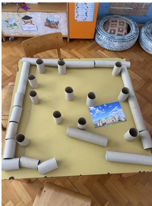
Slika 20. Djevojčicina konstrukcija Stonehengea (preuzeto 28. kolovoza 2024. s: