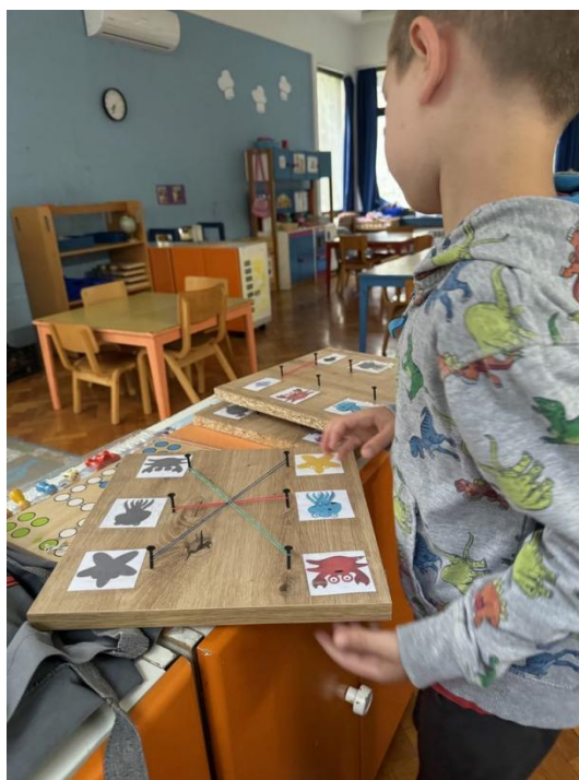
Slika 24. Stolno-manipulativna aktivnost "Spoji životinje"

Tijekom svibnja i lipnja naglasak smo stavili na mora i jezera te aktivnosti koje smo provodili, a da su vezane uz projekt, bile su upoznavanje sa životinjskim i biljnim svijetom koji živi u moru. Djeca već poznaju morski životinjski i biljni svijet pa smo njihove spoznaje, vještine i znanja proširili, nadopunili i nadogradili. Započeli smo slikovnicom "Kornjača i more" u kojoj su djeca pronalazila biljni i životinjski svijet, a najviše od svega je to da ne smijemo zagađivati morski okoliš, kao ni okoliš oko nas samih. Najveći interes djeca su imala za stolno-manipulativnu aktivnost pod nazivom "Spoji životinje". Na drvenoj ploči nalazili su se čavli te kartice s morskim životinjama i njihovim sjenama. Djeca su koristeći gumicu spajala motiv životinje s njegovom sjenom (Slika 24).