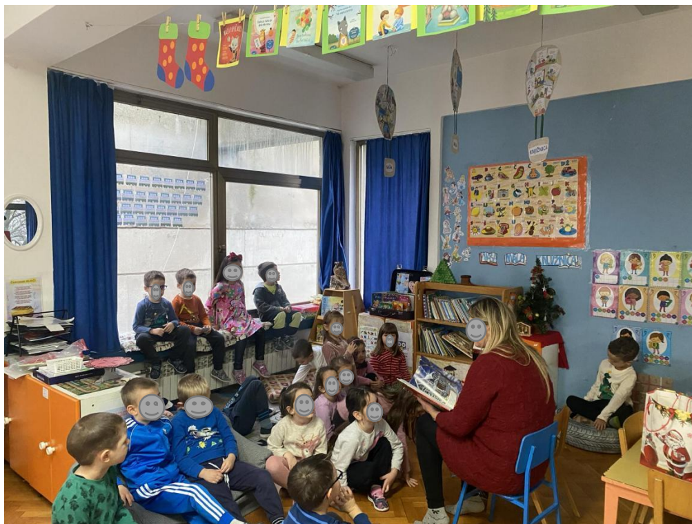
Slika 5. Dolazak majke u skupinu i čitanje slikovnice

nogometašima: "30 nogometaša koji su ušli u povijest", tako da su se djeca susrela s raznim nogometašima iz različitih država svijeta i zastavama tih država.