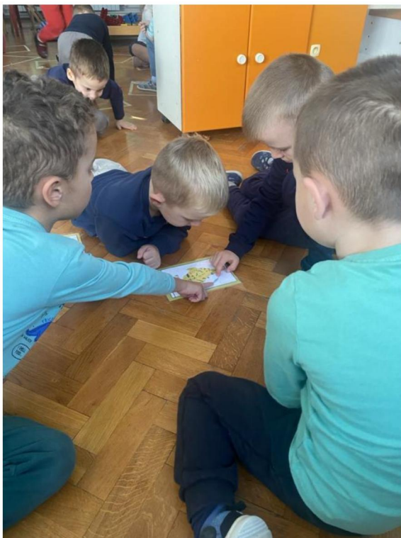
Slika 2. Proučavanje životinjskog svijeta