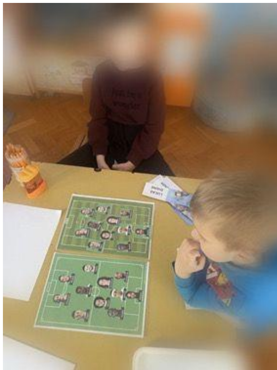
Slika 17. Dječaci proučavaju nogometnu momčad

Također jedna od aktivnosti bila je kartica s igračima i njihovim imenima. Tijekom aktivnosti dječaci su gledali u fotografiju i ime te prepisivali ime i prezime igrača na papir. Osim Turske i Francuske upoznali smo se i s Engleskom. Proučavali smo englesku zastavu i boje na njoj, upoznali se s likom kraljice Elizabete, tko je ona bila i zašto nam je važna, a također ništa bez nogometa pa se tako upoznali i s nogometnim klubovima i stadionima. Budući da grupa dječaka i djevojčica voli provoditi vrijeme u centru građenja njima za poticaj bile su engleske znamenitosti i građevine.