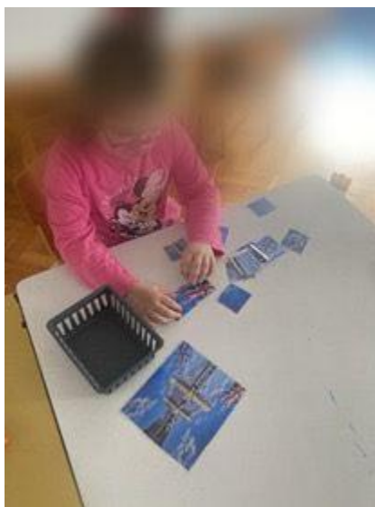
Slika 21. Djevojčica tijekom stolno-manipulativne aktivnosti

Djeci je bila ponuđena stolno-manipulativna aktivnost u kojoj su djeca slagala Tower Bridge (Slika 21).