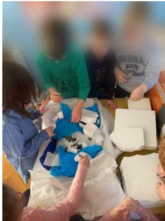
Slika 12. Proučavanje životinja s područja Antarktike

Dok je jedna skupina pjevala, plesala i zabavljala se (Slika 10, Slika 11). Druga skupina proučavala je stiropor koji su djeca iskidala da izgleda kao puknuti snijeg i led s Antarktike. Uzeli su kutiju u koju su stavili pingvine, polarnog medvjeda, dupina, morskog psa, soba, tuljana, morža i razne ribe. Promatrajući djecu, jedan dječak predložio je drugima da uzmu plavi kolaž papir kako bi ga mogli staviti u posudu da izgleda kao voda ispod snijega i leda u kojoj će živjeti životinje. Djeca su dobila kolaž papir i krep papir kojeg su kidali i tako stavljali u kutiju da izgleda poput vode (Slika 12).