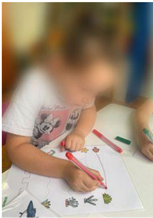
Slika 27. Razvoj fine motorike

Budući da će od jeseni naša skupina biti predškolska, pokazuju veliki interes za aktivnosti koje su vezane uz razvoj fine motorike, posebno za spajanje raznih crta i krivulja. S toga je djeci bila ponuđena plastificirana fotografija s biljnim i životinjskim morskim svijetom u kojoj su djeca flomasterom spajala krivulje koje su se nalazile na predlošku (Slika 27).