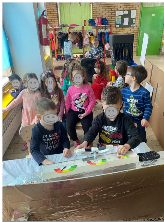
Slika 13. Putovanje u Antarktiku