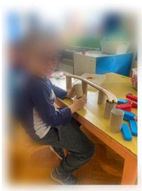
Slika 23. Dječak tijekom konstruiranja Golden Gate-a (preuzeto 29. kolovoza 2024. s:

Pitala sam dječaka što misli je li to most te je dječak rekao da misli da je most koji ima debele noge zbog kojih može stajati u vodi. Nakon kratkog razgovora s dječacima morala sam dječake ostaviti u centru građenja i otići u obiteljski centar jer su me ondje trebale djevojčice. Nakon nekog vremena vratila sam se opet u centar građenja i vidjela da dječak T. Š. nešto radi.