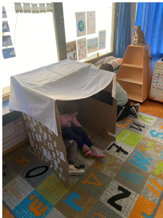
Slika 11. Završna izgrada iglooa