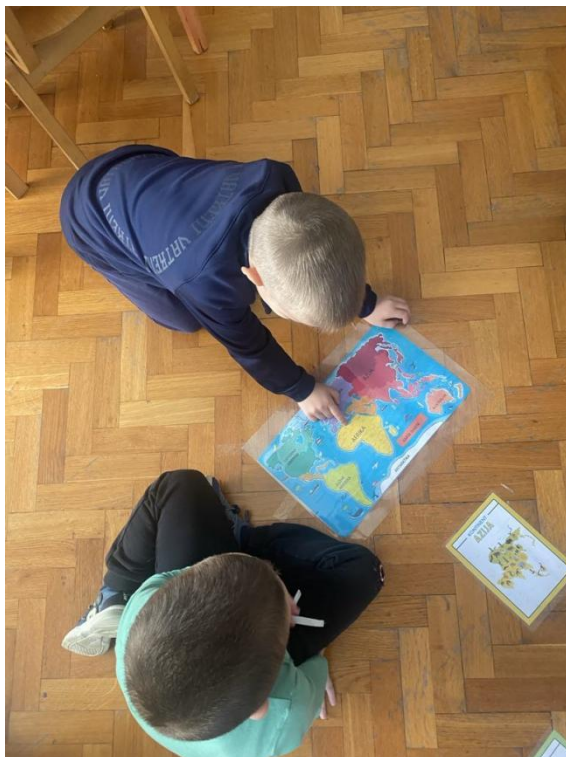
Slika 1. Proučavanje karte svijeta (preuzeto 25. kolovoza 2024. s https://dvzc.hr/projekt-put-oko-svijeta-2/ )