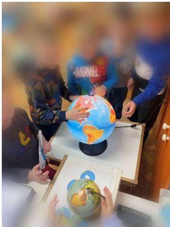
Slika 8. Istraživanje Antarktike

Nakon čitanja, slikanja, pisanja i istraživanja globusa, dječak D. K. pitao je gdje žive ljudi u Antarktici kada je tamo tako hladno, na što mu je dječak A. L. odgovorio da ljudi žive u igloo-u. Pojedina djeca nisu znala kako igloo izgleda pa smo im za poticaj stavili fotografije kako bi razvili veće spoznaje o samom igloo-u. Tijekom prosinca zajedno s odgojiteljicom iz srednje odgojno-obrazovne skupine, dogovorili smo se da bismo mogli djeci donijeti karton kako bi oni napravili svoj vlastiti igloo. Djeci smo ponudili, spužvu, bijelu plahu, komad kartona, bijelu temperu. Djeca su promatrajući fotografiju zajednički došli do zaključka da će spužvu umakati u temperu i tako nanositi na karton kako bi izgledalo kao blokovi snijega.