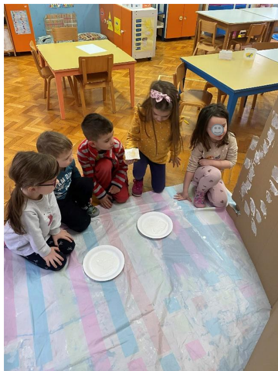
Slika 9. Djeca izrađuju igloo

Pravljenje igloo-a trajalo je dva dana te su se djeca nakon toga igrala u igloou, donosili razne slikovnice, igračke i didaktiku. U jednom trenutku je jedna djevojčica donijela glazbene instrumente i počela svirati. S pjesmom i sviranjem priključila joj se grupa djece. Kada sam ih pitala što oni sada rade, odgovorili su da su oni na Antarktici, da su Eskimi koji pjevaju i sviraju (Slika 9).