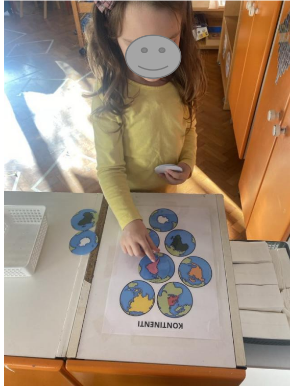
Slika 4. Spajanje kartica kontinenata