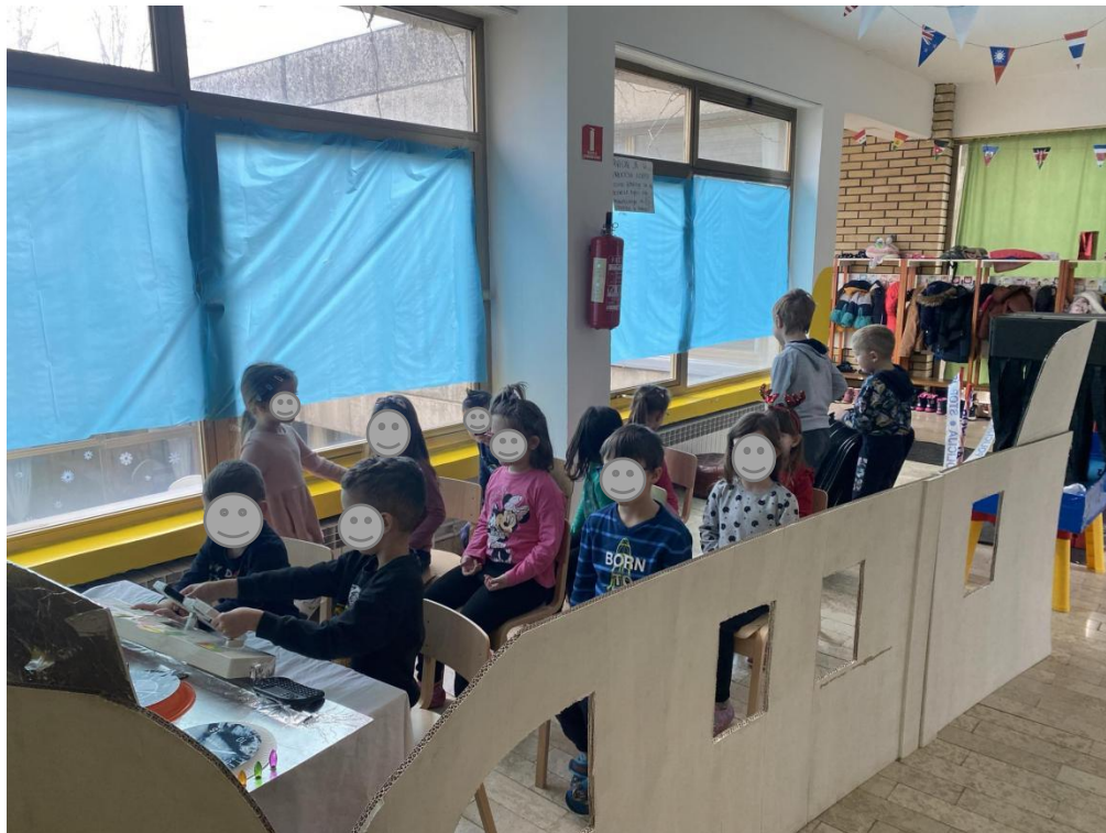
Slika 15. Polazak na južni pol Zemlje