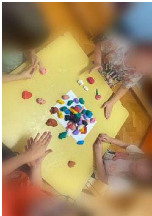
Slika 26. Korištenje plastelina za izradu morskog svijeta

Također, djeci je bio ponuđen akvarel i fotografija biljnog i životinjskog svijeta u morima. Djeca su ono što su vidjela na fotografiji prenijela na papir (Slika 26).