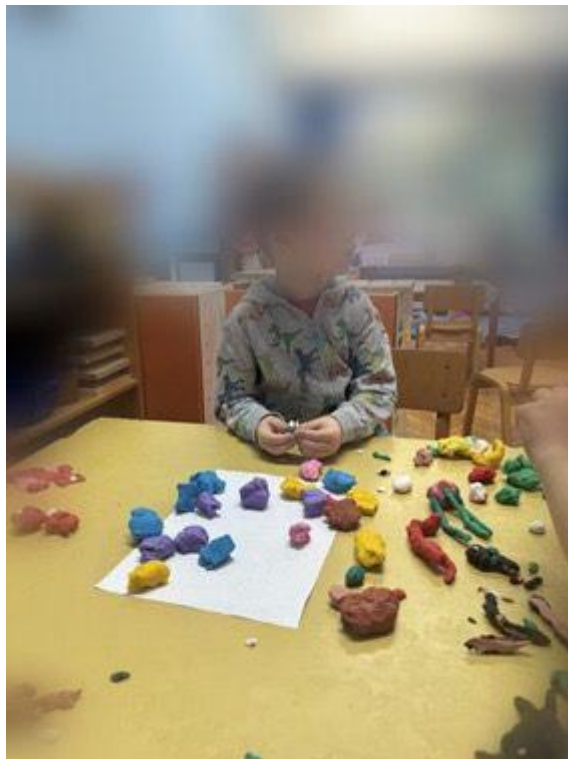
Slika 25. Dječak tijekom izrade morskog svijeta

Zatim su djeca, budući da imaju interes za rad s plastelinom, izradila svoje 3D oblike životinjskog i biljnog svijeta koji obitava u moru. Nakon izrade, ispred sobe našeg dnevnog boravka napravili smo izložbu trodimenzionalnog prikaza dječjih radova (Slika 25).