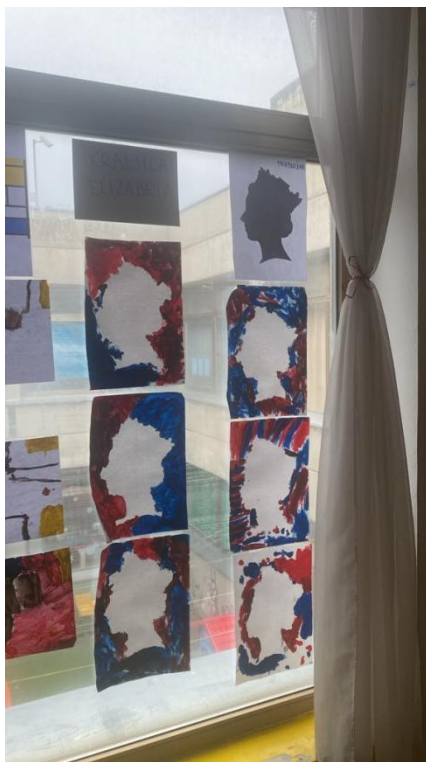
Slika 22. Izložba radova - kraljica Elizabeta

U likovno-umjetničkoj aktivnosti djeci je bio ponuđen predložak s likom kraljice Elizabete, štapići za uši, papir, plava i crvena tempera. Na predložak je bio zalijepljen lik kraljice Elizabete. Dok su djeca nanosila temperu na papir i kada se tempera osušila, odlijepili smo predložak i ostao je lik kraljice Elizabete, a radove smo izložili na prozorsko staklo ispred sobe dnevnog boravka (Slika 22).