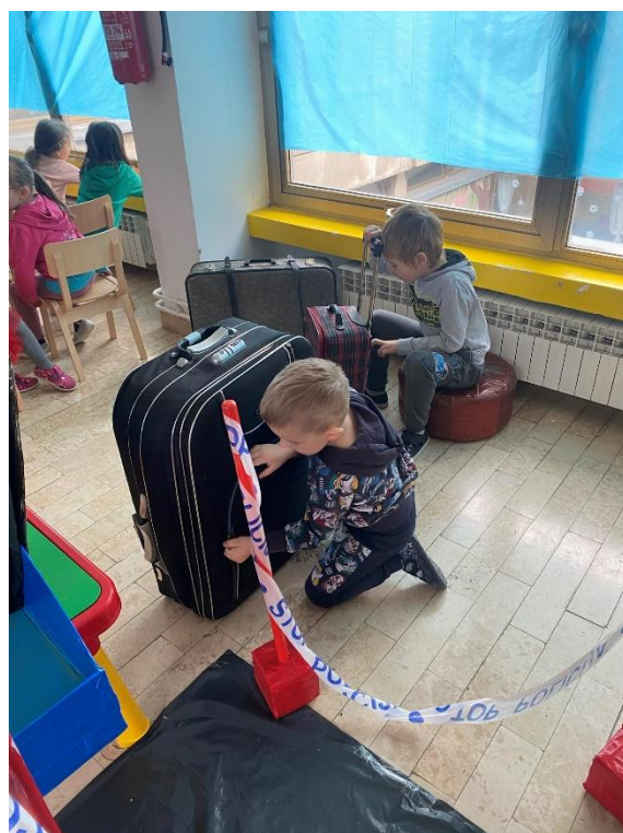
Slika 14. Spremanje prtljage na aerodromu