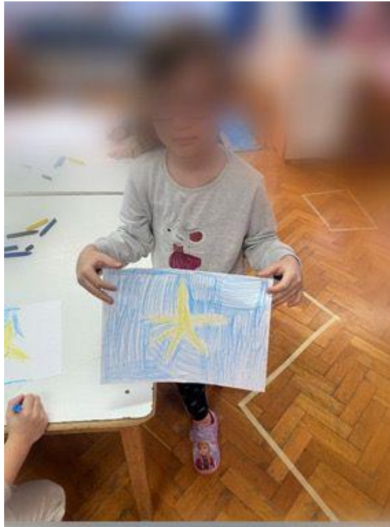
Slika 6. Djevojčici crtež nakon pročitane slikovnice o pingvinu Gašaru

Tijekom siječnja upoznali smo se s Antarktikom. Prvi korak u razradi druge etape bilo je čitanje slikovnice o pingvinu Gašparu. Nakon čitanja i razgovora o istome, djeca su svoje dojmove prenijela na papir (Slika 6).