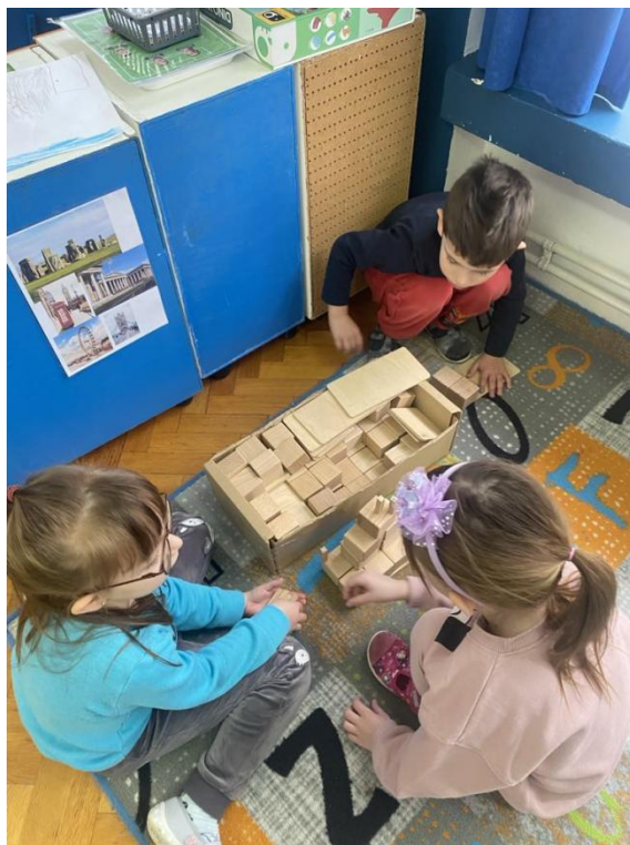
Slika 18. Početak konstruiranja Stonehengea

Fotografirala sam što oni rade, kako bi fotografije mogla izložiti u centru građenja kao poticaj za buduće aktivnosti.