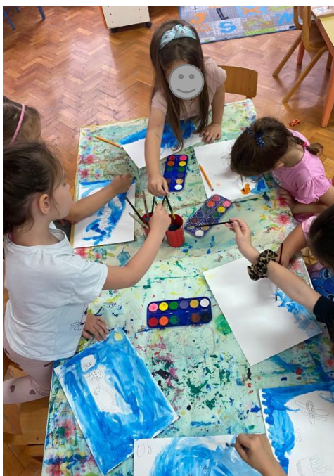
Slika 26. Morski svijet korištenjem akvarela

Također, djeci je bio ponuđen akvarel i fotografija biljnog i životinjskog svijeta u morima. Djeca su ono što su vidjela na fotografiji prenijela na papir (Slika 26).