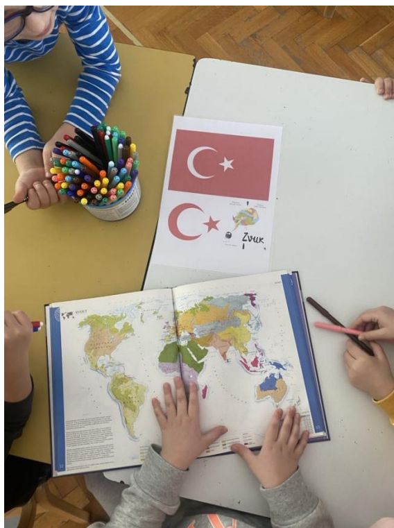
Slika 16. Proučavanje Turske

Slušali smo himnu Turske, na globusu pronalazili Tursku, a neka djeca su i flomasterima crtala zastavu. Zatim smo se upoznali s Francuskom. Dječak A .L. iz skupine pokazuje veliki interes za Pariz i nogometni klub Paris Saint-Germain FC. S toga smo odlučili detaljnije se posvetiti Francuskoj. Čitali smo slikovnicu "Vuk koji je htio obići svijet" te o njoj razgovarali. Dječak L. G. B. promatrao je plastificiranu fotografiju Eiffelovog tornja te ga je nacrtao voštanim i uljnim pastelama, a njegov rad izložen je na prozorskom staklu vrtića. Djeca su također proučavala gdje se nalazi Francuska na karti svijet, a gdje na globusu, kako izgleda zastava. Slušali smo i francusku himnu tijekom koje su djeca naučila da tijekom slušanja himne stojimo mirno i ne ometamo druge. Dječak D. K. vrlo je zainteresiran za brojeve pa smo došli do podatka da od našeg dječjeg vrtića do Pariza je udaljenost 1684 km. Dječak je došao do zaključka da smo mi od Pariza jako udaljeni, a to je usporedio s udaljenošću njegove kuće i dječjeg vrtića koja iznosi svega 1,2 km. Jedna od bitnih stvari za grupu dječaka bilo je nogometno igralište i igrački PSG-a. Za poticaj im je bilo ponuđeno isprintano i plastificirano nogometno igralište s igračima nogometnog kluba PSG (Slika 17). Cilj je bio da djeca postave nogometne igračke na isto ono mjesto koje igrači igraju gledajući fotografiju.