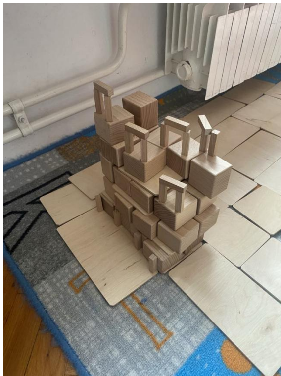
Slika 19. Stonehenge

Za stolom u istom tom centru, centru građenja, priključila se jedna djevojčica. Djevojčica M. P. uzela je fotografiju i rekla mi kako se na fotografiji nalazi Stonehenge. Uzela je fotografiju koju je stavila na sredinu stola i okolo stol "ogradila" tuljcima. Promatrala sam ju, a kada je završila rekla je da je ona napravila svoj Stonehenge (Slika 20).