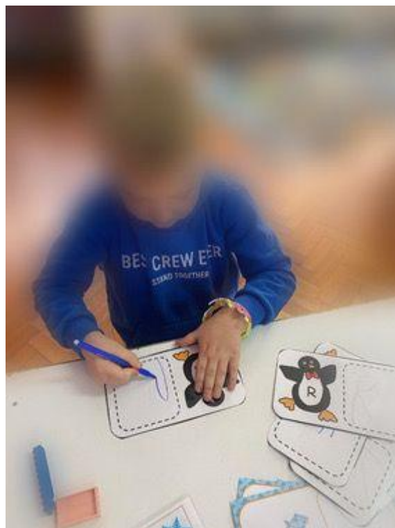
Slika 7. Dječak tijekom predčitalačke aktivnosti (preuzeto 25. kolovoza 2024. s: