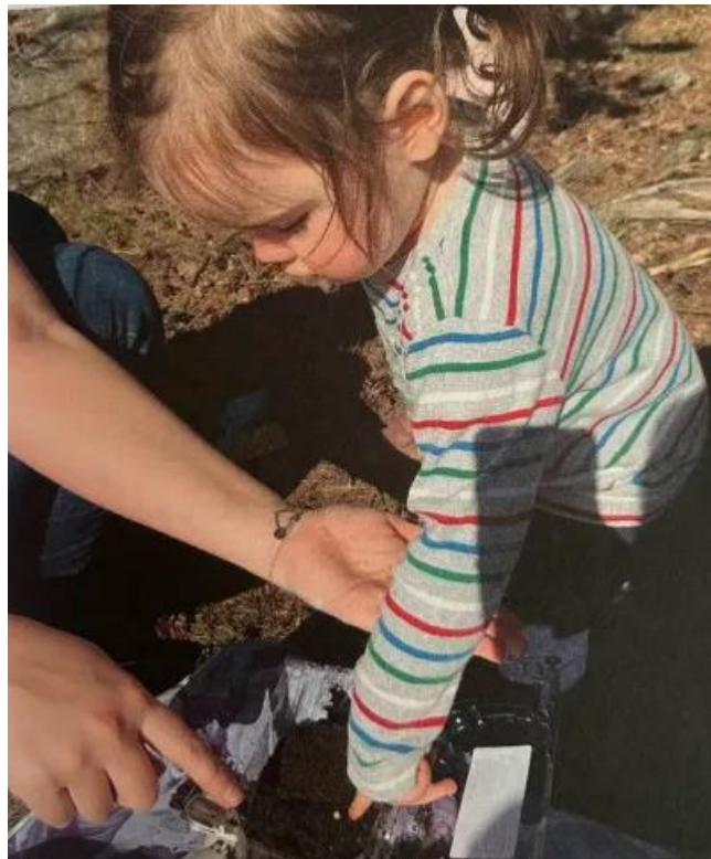
Slika 7. Sadnja biljke u dvorištu dječjeg vrtića