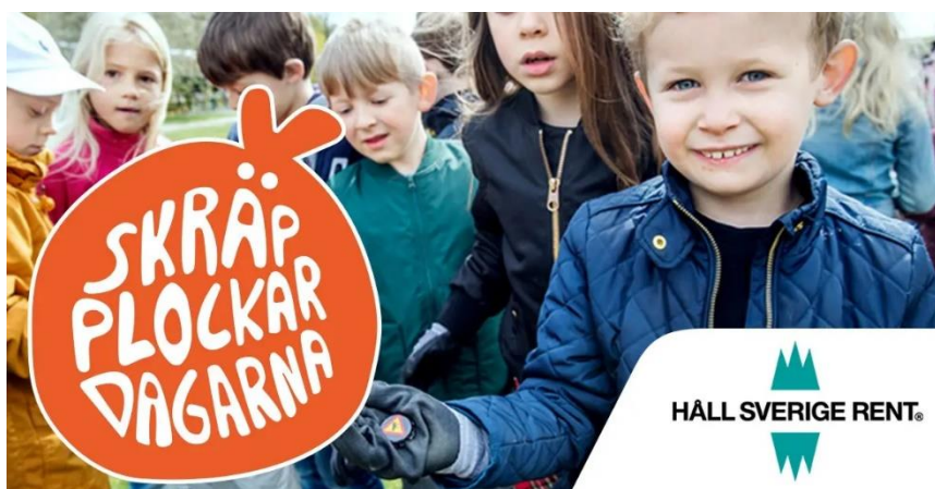
Slika 1. Håll Sverige Rent

Organizacija "Održimo Švedsku čistom" osnovana je 1983. godine, osnovala ju je Švedska agencija za zaštitu okoliša u suradnji s tvrtkom Returpack, koja upravlja sustavom povratne ambalaže u Švedskoj. Glavni cilj ove zaklade "Održimo Švedsku čistom" je smanjenje otpada i povećanje svijesti o pravilnom odlaganju otpada i recikliranju kroz obrazovanje i javne kampanje. Njihova misija je potaknuti promjenu u ponašanju prema otpadu, s naglaskom na zaštitu okoliša, osobito na obalnim područjima OŠvedske kroz praktične aktivnosti i igre – poput igara u kojima djeca traže otpad u okolini dječjeg vrtića i uče o važnosti pravilnog odlaganja otpada, izrađivanje različitih predmeta od recikliranih materijala ili drugih prirodnih resursa, aktivnosti koje potiču dječju kreativnost i pomažu podizanju njihove ekološke svijesti. Time se djeca od najranije dobi potiču na odgovornije ponašanje prema prirodi što je ključno za osiguravanje održivije i čistije budućnosti. ( https://hsr.se )