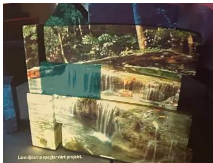
Slika 4. Okruženje za učenje za održivi razvoj