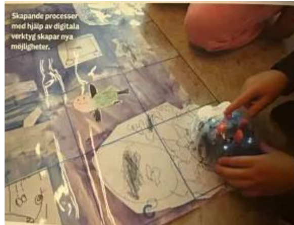
Slika 5. Kreativni procesi uz pomoć digitalnih alata