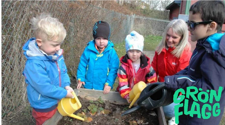
Slika 2 Grön Flagg