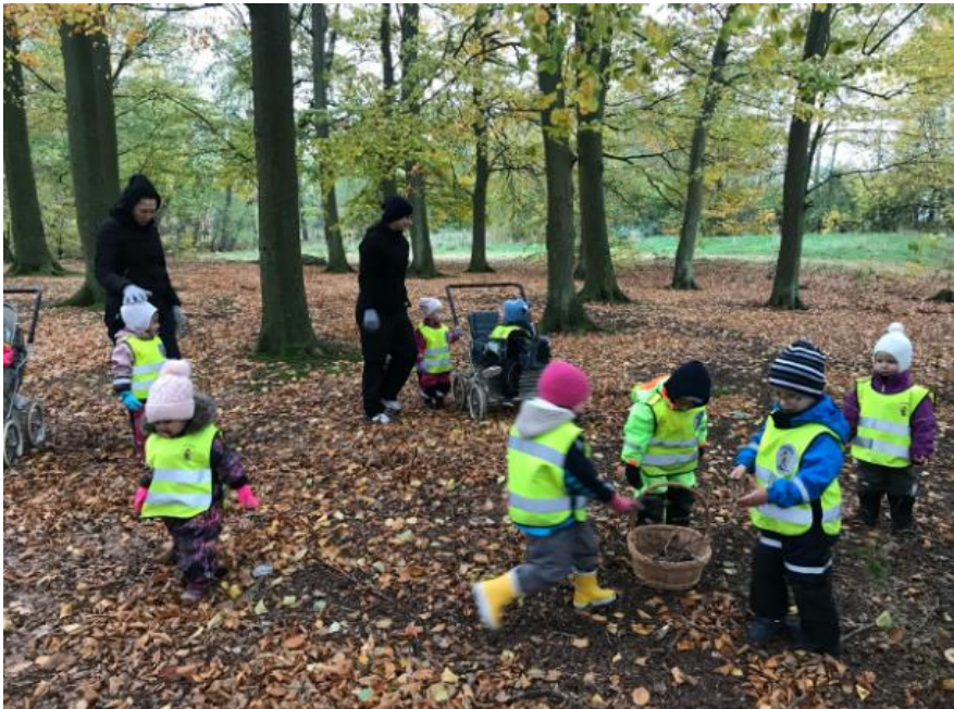
Slika 8. Djeca skupljaju granje

Jedan od primjera ovakvih dječjih vrtića nalazi se u Högdalenu, u gradu Stockholmu, u Švedskoj. Djeca provode značajan dio vremena istražujući lokalne parkove, šume i prirodna okruženja. Ovaj praktičan pristup potiče znatiželju, kreativnost i duboko razumijevanje svijeta oko njih. Dječji vrtić pridaje veliku važnost učenju o održivosti. U svoje svakodnevne rutine uključuju ekološki prihvatljive prakse, poput recikliranja, kompostiranja i korištenja prirodnih materijala. Skogens Förskola duboko je ukorijenjena u lokalnoj zajednici. Suradnju s obiteljima i lokalnim organizacijama koriste za obogaćivanje njihovih obrazovnih programa i pružanje bogatijih iskustava djeci. Djeca uče na radostan način cijelim tijelom i svim osjetilima, za razliku od boravka u sobi ili u drugim zatvorenim prostorima. ( https://forskola.stockholm/hitta-forskola/forskola/skogens-forskola#:~:text=Välkommen%20till%20Skogens%20förskola!,barn%20i%20åldrarna%203-5. )