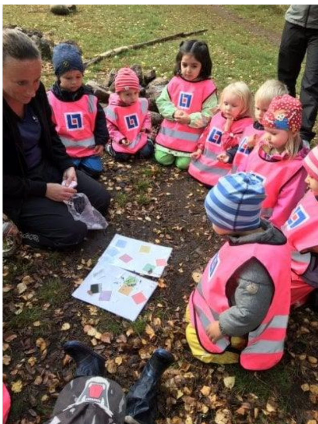
Slika 9. Primjer aktivnosti u prirodi