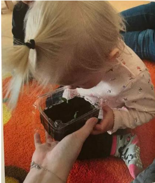
Slika 6. Promatranje rasta biljke