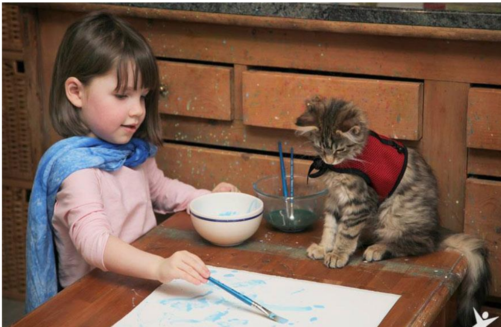
Slika 10. Autistična djevojčica i njena terapijska mačka

U proučavanju odnosa koji dijete ima sa svojim kućnim ljubimcem važno je taj odnos proučavati sustavno, razmatrajući i kvalitetu drugih obiteljskih odnosa, osobito odnose s roditeljima jer su to odnosi u djetetovu životu koji mijenjaju i definiraju ostale odnose. Ustanovljeno je da se djeca koja imaju ljubimca i koja žive u povoljnijoj obiteljskoj klimi bolje razvijaju u skladu sa svojom dobi. Prema Melson djeca jedinci ili najmlađa djeca u obitelji više se vežu za kućne ljubimce koji im mogu poslužiti za lakše izražavanje emocija i usvajanje ponašanja koja druga djeca usvajaju izravnom komunikacijom s mlađom braćom i sestrama. (Smojver, 2010)