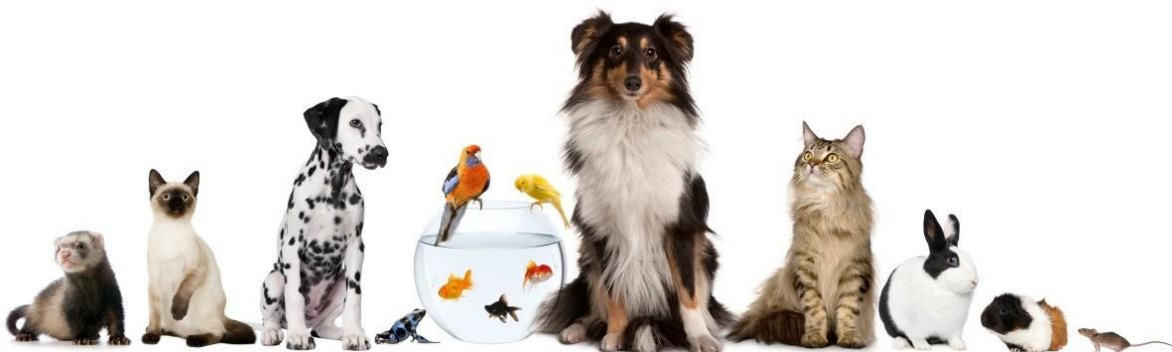
Slika 9. Najčešći kućni ljubimci http://celloplexskincare.com/ 18.11.2016.

O stilu privrženosti koji se razvio uz primarnu figuru može ovisiti hoće li osoba imati osjećaj povjerenja u druge i uspostavljati kvalitetne odnose s drugima ili će njezin život karakterizirati izoliranost, usamljenost i niska samoprocjena vlastitih sposobnosti.