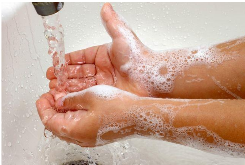
Slika 5. Higijena ruku kao prevencija bolesti

Kućni ljubimci više nisu toliko opasni za zdravlje jer se čiste od nametnika i cijepe. No, mogu u samoobrani napasti dijete, ugristi ga ili ogrebsti ukoliko dijete u igri učini životinji nešto što nije primjereno. Zato dijete treba pripremiti na dolazak kućnoga ljubimca i naučiti ga kako se ponašati prema njemu. Potrebno mu je objasniti da životinja osjeća bol i da se može uvrijediti ako se prema njima loše ponašamo.