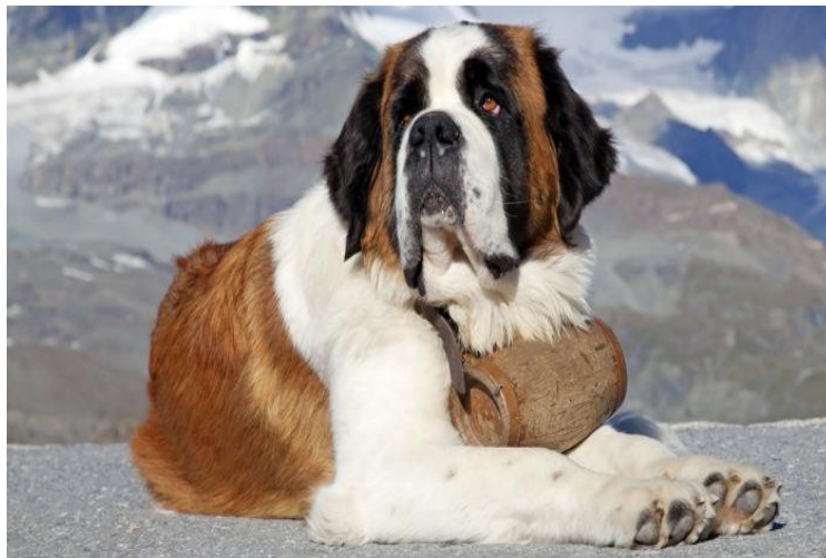
Slika 5. Bernardinac

Prvi specijalizirani psi spašavatelji i tragači bili su bernardinci. Pronalazili su i šapama otkopavali ljude koje je zatrpala lavina ili koji su upali u provaliju u švicarskim Alpama. Najpoznatiji bernardinac bio je Barry koji je spasio između 40 i 100 ljudskih živote te time zaslužio spomenik u Bernu. Od 1955. godine bernardinci se više ne koriste u takvim akcijama spašavanja. Psi imaju izuzetan njuh koji je od 1000 do 10 000 000 puta bolji od našega te se zato koriste za pronalaženje ljudi ispod ruševina ili onih koji su upali u provaliju.