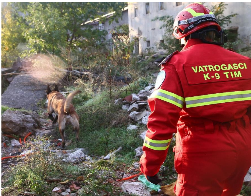
Slika 7. Vatrogasni pas

Kao i vatrogasci, potražni psi moraju u svakome trenutku biti spremni na izlazak na teren. Upravo zato što nikada ne znamo kada će nekome trebati pomoć, pas ide s vatrogascem na posao, provodi svoje slobodno vrijeme, ide na godišnji odmor odnosno postaje član obitelji. Punopravan je član tima i sudionik intervencije pa tako mora imati odgovarajuću opremu, a to je: pseći alpinistički pojas, zaštitne cipele od stakla, a po potrebi i GPS ogrlicu. Važno je naglasiti da oni nisu obučeni za potražnju mrtvih osoba jer je u trenucima nesreće najvažnije spasiti one koji se nalaze živi zakopani ili u vatri. 5