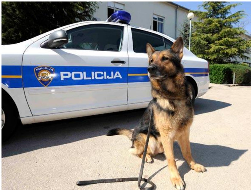
Slika 6. Policijski pas

„Ozljeđivanje ili ubijanje policijskog psa smatra se istim ili sličnim kaznenim djelom poput ranjavanja ili ubojstva policajca, pa se u mnogim zemljama tako i kažnjava.“ (Krizmanić, 2016: 79) Između šeste i devete godine policijski psi odlaze u mirovinu, a tada ih uglavnom udomljavaju njihovi voditelji.