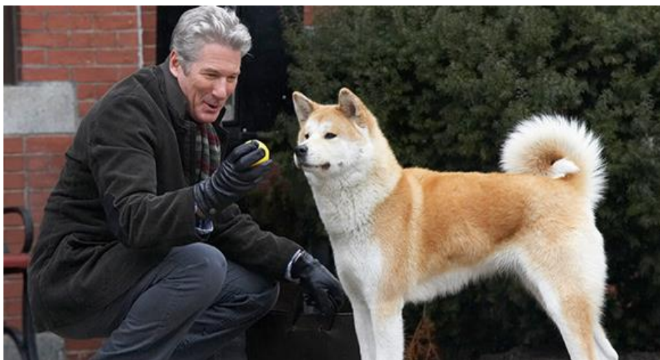
Slika 4. Isječak iz filma Hatchiko

Različiti su razlozi zbog kojih ljudi uzimaju kućne ljubimce. Nekima daju osjećaj povezanosti i sigurnosti te time čine da se osjećaju dobro, neki ih uzimaju kako bi ih netko dočekao kod kuće te kako bi stekli osjećaj da ih netko treba. Klinički psiholozi smatraju da nam kućni ljubimci omogućuju da se osjećamo voljeno. O privrženosti pasa najbolje svjedoči pas Hatchiko o kojemu je snimljen i film. On je nakon smrti svoga vlasnika desetak godina odlazio na mjesto gdje je dočekivao vlasnika s posla.