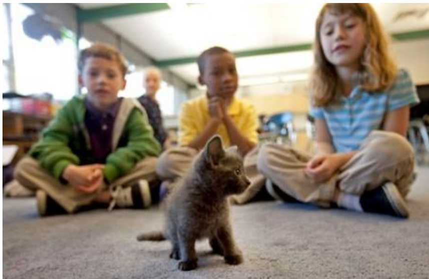
Slika 11. Mačka kao kućni ljubimac u razredu

U Americi je bio pokrenut program za djecu s ADHD-om u kojemu su oni mogli birati žele li sport ili posvojiti životinju u zoološkom vrtu i brinuti se za nju. Djeca koja su odabrala zoološki vrt, morala su naučiti hraniti i čistiti životinje. Od njih se tražilo da govore tiho i polagano kako se životinje ne bi prestrašile. Uspoređujući grupe, istraživači su uvidjeli da je 93 posto djece dolazilo u zoološki, a 71 posto na sportske aktivnosti. Djeca su bila koncentrirana i spremna na suradnju. Učitelji su uočili da su se njihovi negativni oblici ponašanja značajno smanjili, a samopoštovanje povećalo. (Krizmanić, 2016)