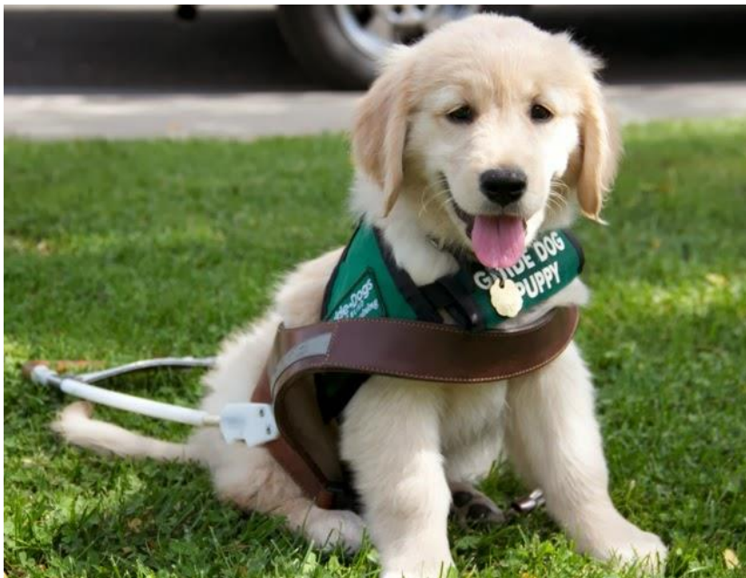
Slika 8. Pas vodič štene

Obitelji koje uzimaju štene, a imaju djecu, trebale bi unaprijed pripremiti djecu na činjenicu da će pas biti s njima samo godinu dana te im objasniti da sudjeluju u humanom djelu. „Uzimanje psa na socijalizaciju može tako biti izuzetan dodatak socijalizaciji i odgoju same djece, koja se odmalena uče raditi za dobrobit drugih, a ne samo na sebe.“ (Krizmanić, 2016: 85) Drugi je stupanj obučavanje u Silver centru i Hrvatskoj udruzi za školovanje pasa vodiča u Zagrebu u trajanju od dvije do tri godine. Važno je da pas vodič nauči okolinu gledati iz perspektive osobe koju vodi. Moraju biti pristojni, bistri, spremni i sposobni na učenje i dobro uočavati okolinu i događaje u njoj. Također, ne smiju biti strašljivi niti reagirati na nagle glasne zvukove ili promet, već moraju biti usmjereni na svoj zadatak. Psi vodiči ostaju u službi 7-8 godina, ovisno o njihovom zdravlju. (Krizmanić, 2016)