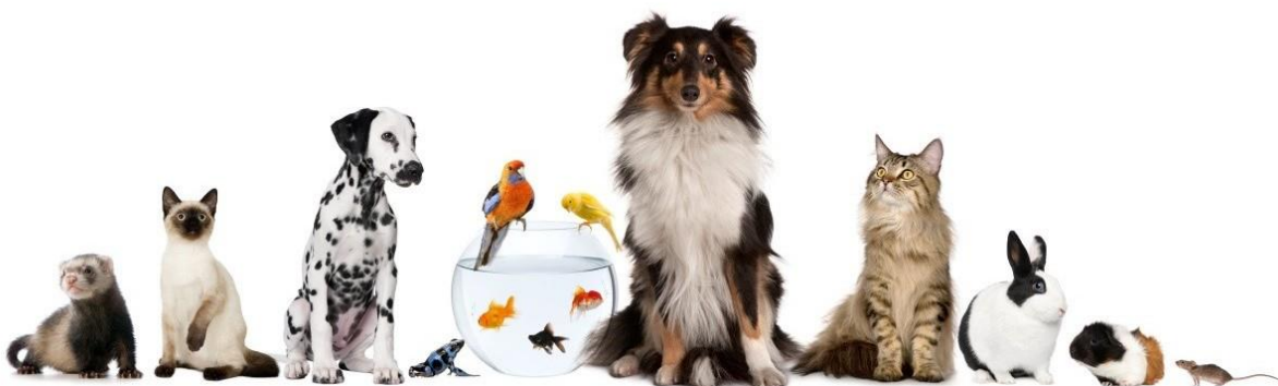
Slika 9. Najčešći kućni ljubimci

O stilu privrženosti koji se razvio uz primarnu figuru može ovisiti hoće li osoba imati osjećaj povjerenja u druge i uspostavljati kvalitetne odnose s drugima ili će njezin život karakterizirati izoliranost, usamljenost i niska samoprocjena vlastitih sposobnosti.