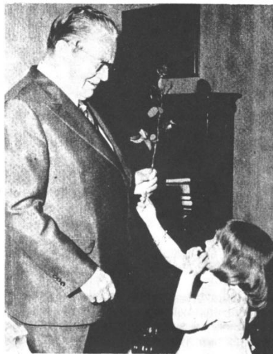
Na slici je drug Tito i njegova unučica Saša. Saša čestita svome djedu rođendan.