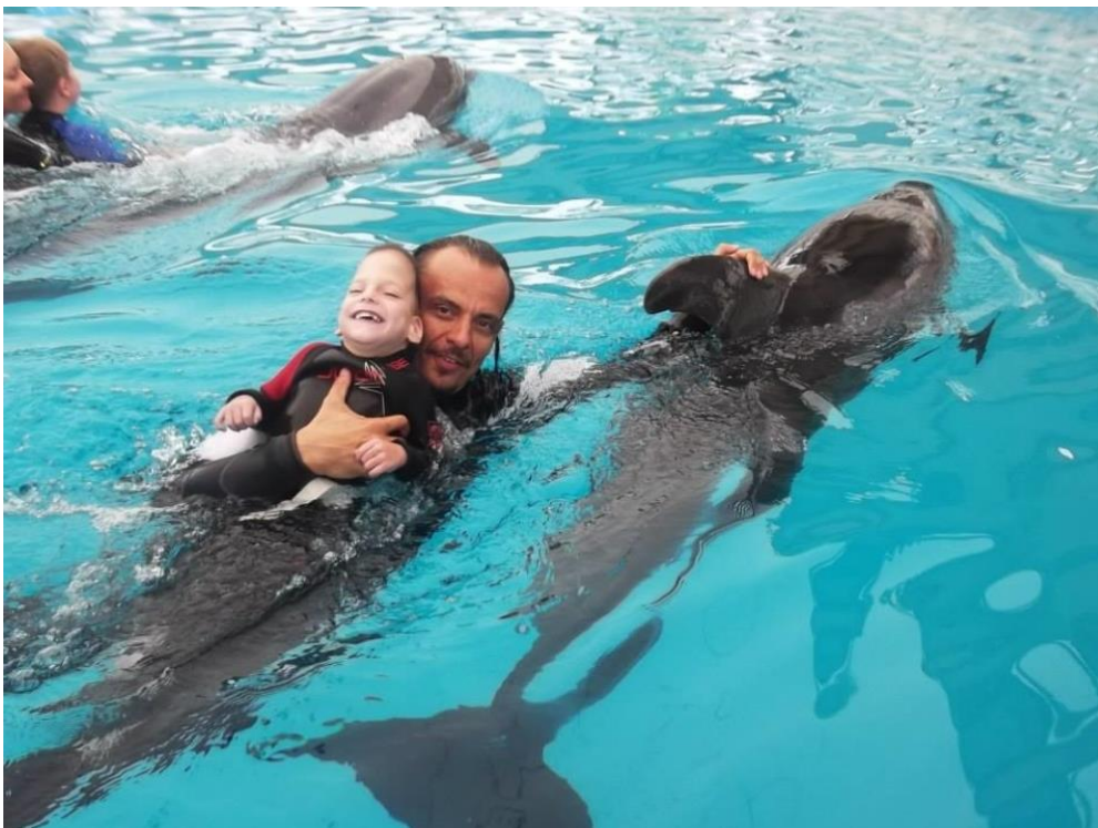
Slika 13 Terapija delfinima

„Terapija sa delfinima je pristup nastao i razvijen od strane Davida Nathanson, dr.sc., psihologa sa gotovo trideset godina iskustva u radu s djecom sa invaliditetom. Teorija i istraživanja terapije sa delfinima se temelji na činjenici sa će djeca i odrasli povećati pozornost i motivaciju za rad kao rezultat želje za interakciju s delfinima. Delfin terapija preporučuje se u sljedećim slučajevima kada odrasli i djeca pate od: sindroma kroničnog umora, emocionalnog stresa, fobija, depresije i sl. Terapijom se očekuje značajno poboljšanje zdravstvenog stanja kod djece koja pate od cerebralne paralize, te rezultati su vidljivi na povećanje aktivnosti i sposobnosti socijalnog prilagođavanja pa se preporučuje kod autizma.“ (izvor: http://www.ilearn-project.eu/documents/bhs/TERAPIJA_SA_ZIVOTINJAMA.pdf )