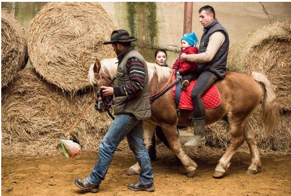
Slika 9 Hipoterapija (djeca)

Krmpotić (2006./07.) navodi kako je važno znati da ne smiju sva djeca jahati, npr. bilo kakva neugoda ili bol tijekom jahanja te naravno dječje odbijanje za takvom aktivnosti. Odbijanje je normalna pojava kod djece s autizmom ili djece koja se prvi puta susreću sa životinjom te se u takvim slučajevima preporučuje strpljenje.