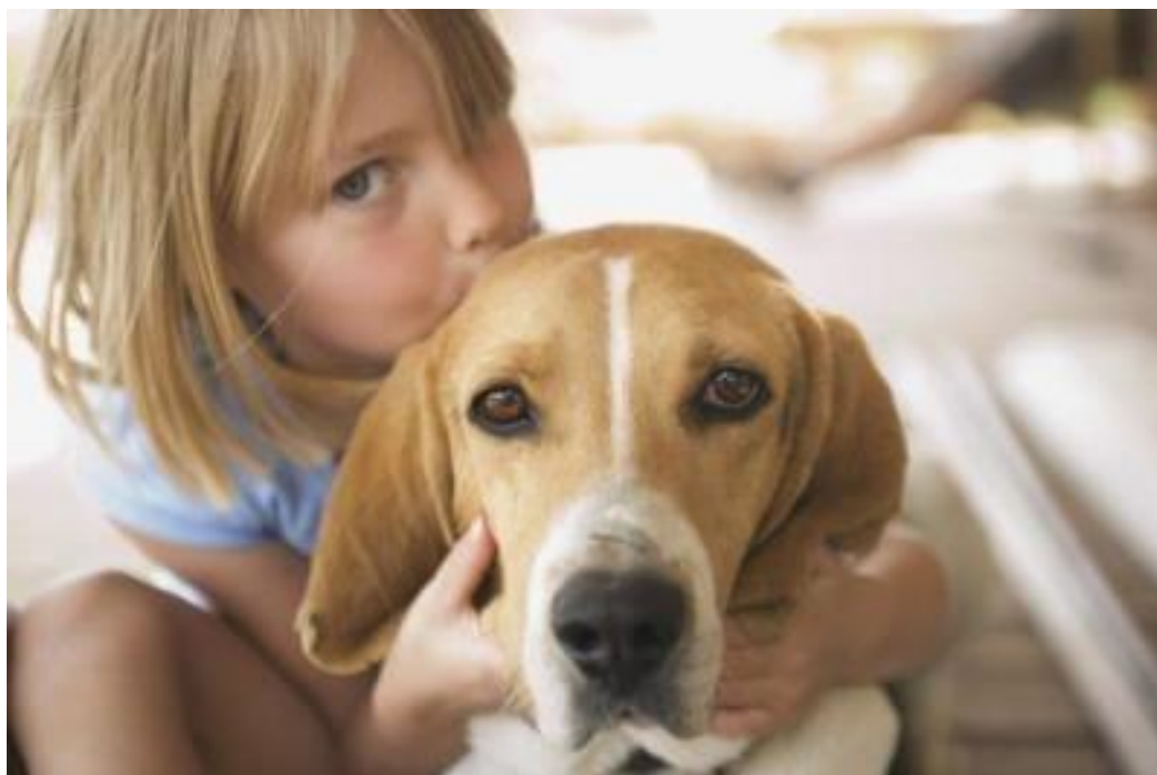
Slika 5 Pas

Prema Burić (2006./07.) roditelji često nabavljaju životinje zato što su uvjereni da će djeca pomoću njih razviti karakter, osjećaj odgovornosti i općenito će se bolje socijalizirati. Ovo je relativno nov predmet znanstvenih istraživanja.