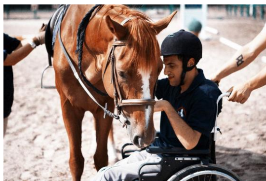
Slika 8 Hipoterapija

Hipoterapija je fizikalna strategija liječenja osoba sa invaliditetom koja koristi konjski pokret za postizanje funkcionalnih ciljeva. Hipoterapija znači liječenje uz pomoć konja (grčki hippo=konj; therapeia=liječenje) i odnosi se na upotrebu trodimenzionalnog načina kretanja konja kao sredstva liječenja osoba sa funkcionalnim ograničenjima, neuromotornim i senzornim disfunkcijama. Hipoterapija je dopuna postojećim programima rehabilitacije, gdje se konj koristi kao terapijsko sredstvo. Ovaj vid rehabilitacije koji je u svijetu priznat, namijenjen je osobama sa intelektualnim poteškoćama, razvojnim poremećajima, hiperkinetičkim sindromom, autizmom, tjelesnim invaliditetom, psihoemocionalnim oštećenjima, reumatskim bolestima. Može je izvoditi samo educirani viši fizioterapeut s dodatnom edukacijom. Korisnici su najčešće osobe s težim tjelesnim oštećenjima. Kao dodatnu metodu koristi i jahanje. To je metoda koja se upotrebljava kod pacijenata koji inicijalno ne osjećaju dovoljnu stabilnosti na konju te kod pacijenata koji ne mogu samostalno sjediti tj. nemaju dovoljnu kontrolu trupa i/ili glave. U terapijskom jahanju sudjeluju korisnici sa širokim spektrom dijagnoza, od tjelesnih oštećenja, oštećenja vida ili sluha, poteškoće u psihičkom razvoju, emotivne poteškoće, autizam.“ (izvor: http://www.ilearn-project.eu/documents/bhs/TERAPIJA_SA_ZIVOTINJAMA.pdf )