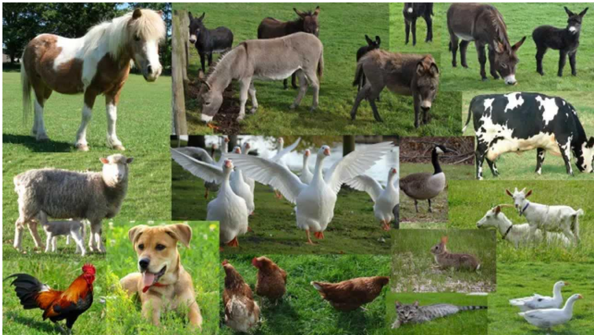
Slika 1 Domaće životinje

„Divlju životinju moguće je procesom pripitomljavanja pretvoriti u pitomu životinju. Nakon što životinja postane pitoma, procesom domestikacije ili udomaćivanja, životinja postaje domaća životinja. Domestikacija – lat. Domesticus odnosi se na proces preobraćenja divljih životinja u domaće.“ (Jovanovac, S., 1997.)