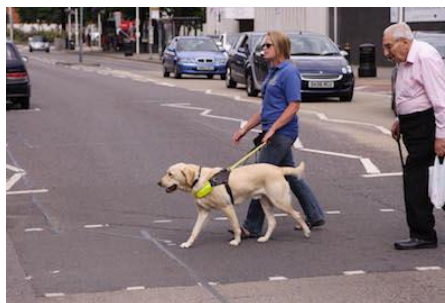
Slika 10 Pas vodič

„Pas vodič je školovani pas pomagač koji osobama s oštećena vida olakšava kretanje u prostoru. Školovanje psa vodiča traje 8 mjeseci a obuhvaća : markiranje rubnika, stepenica, zaobilazanje prepreka, pronalaženje pješačkih prijelaza, autobusnih i tramvajskih stajališta, te vođenje u prometu i sl. Uz ovladavanje naredbama pas mora znati samostalno pronalaziti najsigurnija i najprihvatljivija rješenja u brojnim situacijama čime će se povećati samostalnost, sigurnost i brzinu kretanja slijepe osobe. U zadnjoj fazi školovanja psa instruktor radi s povezom na očima kako bi mu kretanje bilo što sličnije kretanju slijepe osobe i izbjegavajući vizualnu komunikaciju sa psom. Osposobljavanje za kretanje uz pomoć psa vodiča provodi se kroz individualni rad s korisnikom u trajanju od 6 tjedana. Tijekom obuke slijepa osoba izgrađuje kontakt sa psom, stječe osnovna znanja o njezi i zdravlju psa te ovladava naredbama koje je pas tokom školovanja naučio. Kretanje sa psom vodičem od osobe zahtjeva dobru orijentaciju u prostoru.“ (izvor: http://www.ilearn-project.eu/documents/bhs/TERAPIJA_SA_ZIVOTINJAMA.pdf )