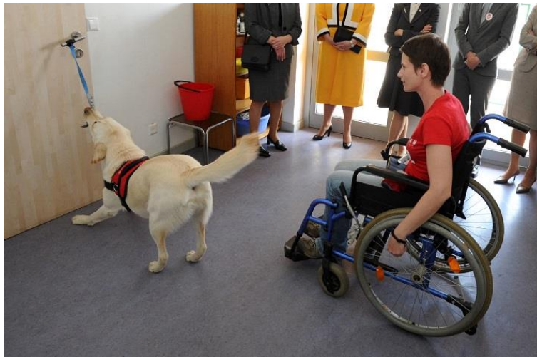
Slika 11 Rehabilitacijski pas

Rehabilitacijski pas omogućava teško pokretnoj osobi ili osobi u invalidskim kolicima ostvarenje samostalnijeg i kvalitetnijeg života. Radni vijek rehabilitacijskog psa s korisnikom je 7 do 8 godina, nakon čega se, prema procjeni stručnog tima, pas umirovljuje.“ (izvor: http://www.ilearn-project.eu/documents/bhs/TERAPIJA_SA_ZIVOTINJAMA.pdf )