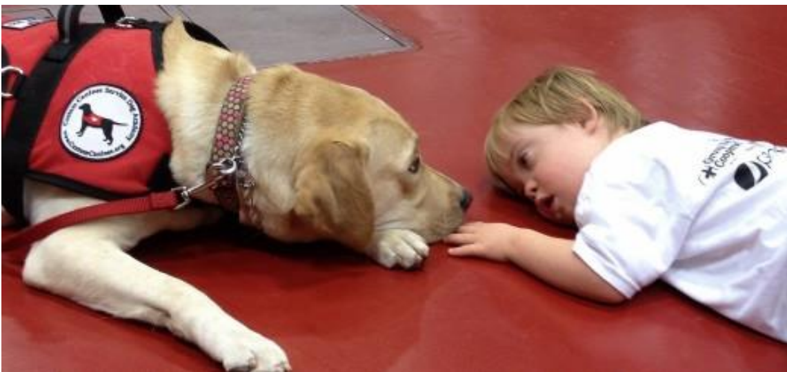
Slika 12 Terapijski pas