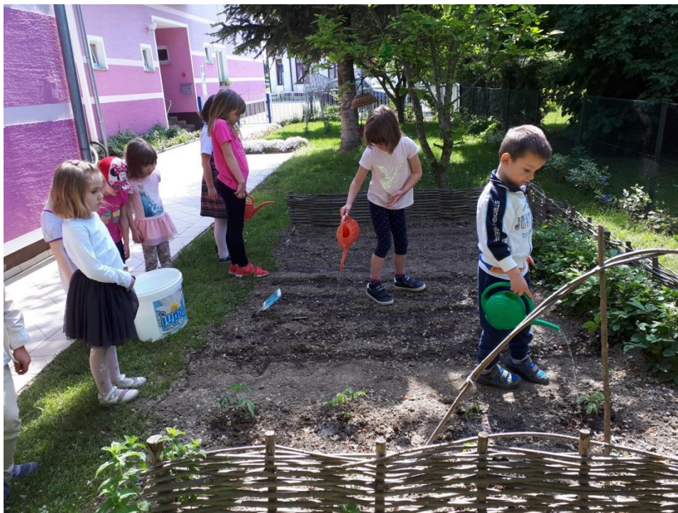
Slika 2: Vrt u sklopu dječjeg vrtića, preuzeto s https://www.vrtic-smijesak.com/ekologija-u-djecjem-vrticu-smijesak/ , 26.6.2018.