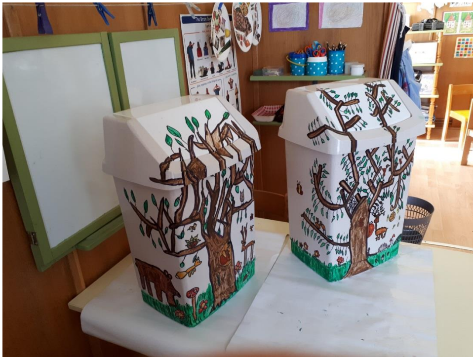
Slika 3: Likovne ekološke aktivnosti, preuzeto s http://www.vrtic-smijesak.com/wp-content/uploads/2018/04/20180420_142857.jpg , 26.6.2018.