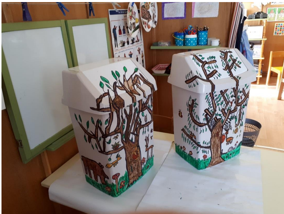
Slika 3: Likovne ekološke aktivnosti, preuzeto s http://www.vrtic-smijesak.com/wp-content/uploads/2018/04/20180420_142857.jpg , 26.6.2018.