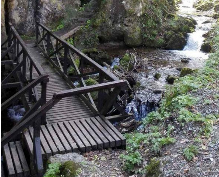
Slika 3. Grofova poučna staza