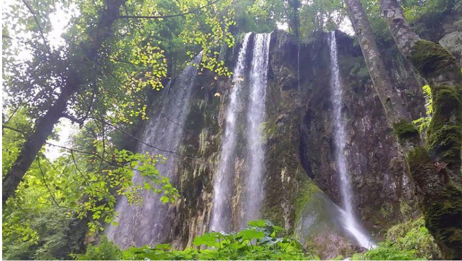
Slika 2. Slap Skakavac