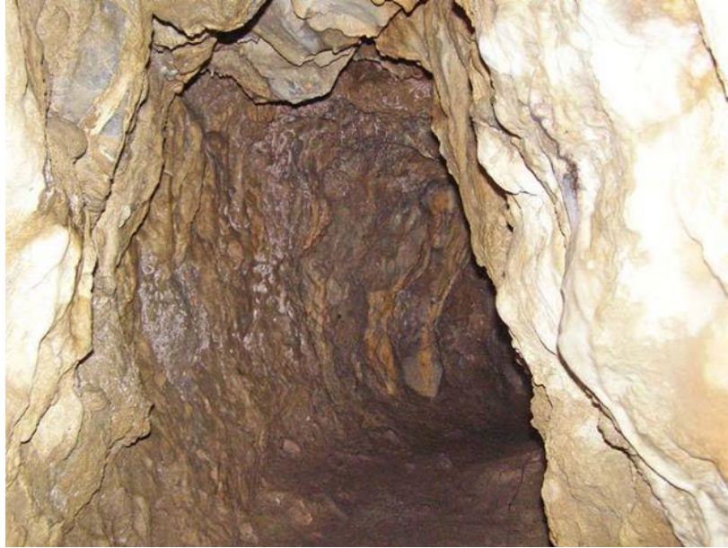
Slika 1. Izvor jankovačkog potoka u poluspilji