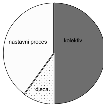
Grafički prikaz 1. Glavne skupine problema s kojima se u praksi susreću pomoćnici

Polovica problema s kojima se susreću pomoćnici odnose se na interpersonalne relacije, slijede problemi u samom nastavnom procesu i, iznenađujuće, problemi u odnosima s djecom (učenicima). Potonje se može tumačiti u kontekstu osposobljavanja, selekcije i praćenja, gdje pomoćnici trebaju imati jasnu sliku s kojom će populacijom raditi, koje su potrebe učenika s teškoćama u razvoju, a kada pomoćnik i naiđe na problem u komunikaciji s učenikom, da im se oboma pruži podrška. Animizitet prema učeničkim ponašanjima lako može odvesti u neprimjerno postupanje, ali i zlostavljanje, što svakako treba prevenirati.