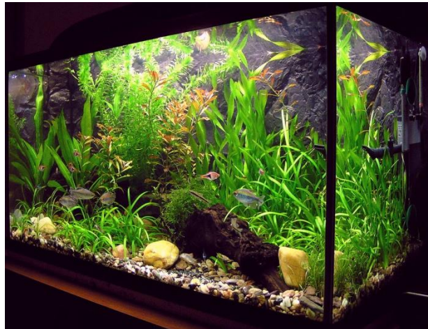
Slika 3. Akvarijske ribice.

Akvarijske ribice (slika 3.) su vjerojatno najjednostavniji tip kućnog ljubimca. Postoje neki osnovni koraci kako brinuti za ribice jednom kad se akvarij uredi. Neke stvari bi se trebale raditi na dnevnoj bazi, a neke stvari je dovoljno napraviti jednom na tjedan ili dva. Ribice moraju imati dovoljno svjetlosti i čiste vode. Većina ribica je dovoljno nahraniti jednom do dva puta dnevno. Filteri moraju biti čisti kako bi pH vode ostala povoljna, i kako bi voda naravno ostala čista.