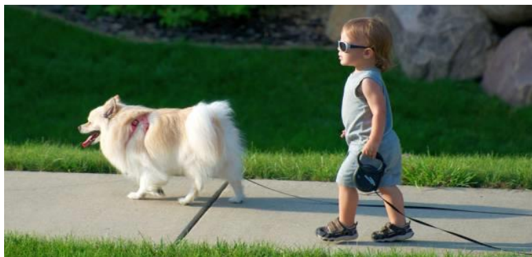
Slika 1. Pas je izrazito popularan kao kućni ljubimac.

Svakako je jedna od najpopularniji životinja pas . Psi (slika 1.) su inteligentni, vjerni i odani ljubimci. Odlikuje ih duboka privrženost prema ljudima. Psi potiču na aktivnost što je vrlo korisno jer se ljudi tako potiču na kretanje. Za djecu je ovo izrazito važno jer se umanjuje njihova ovisnost o tehnologiji i provođenju slobodnog vremena sjedilački. Imaju urođenu potrebu za životom u sustavu hijerarhije u kojem postoji red.