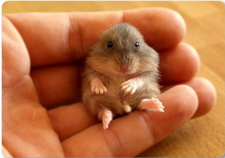
Slika 2. Hrčak.

Hrčak je zaigrana, umiljata i znatiželjna životinja (slika 2.). Ne treba puno prostora i lako se prilagođava okolini. Hrčka je poželjno svaki dan puštati iz kaveza, ali ga cijelo to vrijeme treba imati na oku. Hrčci su nestašni, vole se penjati i zavljučiti u najskrovitija mjesta. To može biti opasno zbog nepristupačnosti mjesta i mogućnosti da mali glodavci naprave štetu ili pojedu po njih opasan materijal. Hrčak je noćna životinja. Prespavati će većinu dana, a probuditi se navečer i biti aktivan cijelu noć.