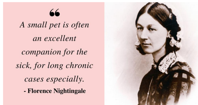
Slika 6. F. Nightingale; citat na hrv: Mali ljubimac je često odličan sudrug za bolesne, posebice za duge kronične slučajeve.

psihijatriji navode njihovi brojni pozitivni učinci (eng. animal-assisted therapy, skraćeno AAT) (Pužar, 2015.).