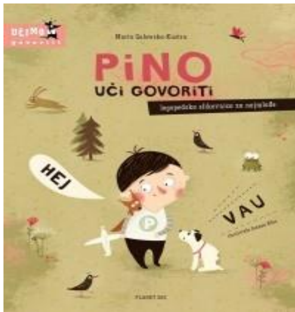
Slika 3. prikaz slikovnice Pino uči govoriti