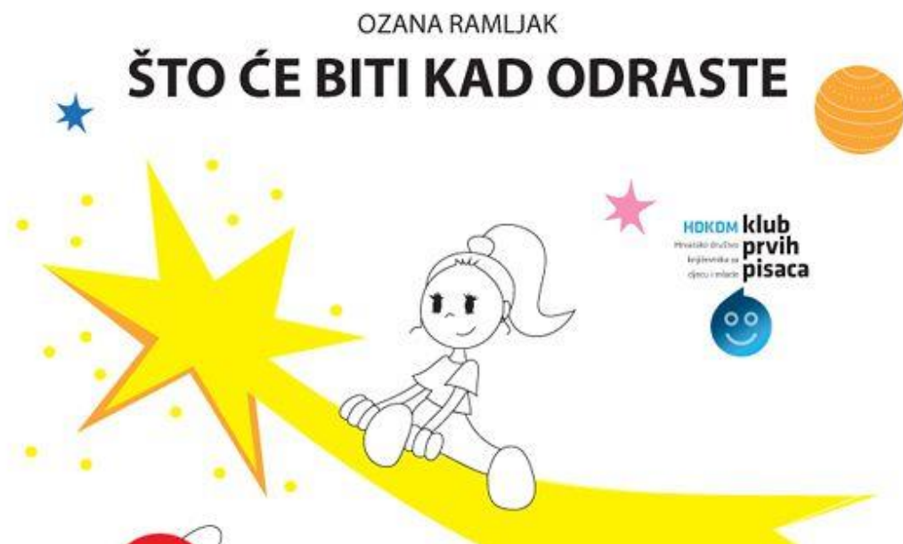
Slika 4. prikaz slikovnice Što će biti kad odraste

Stoga je ova slikovnica dobrodošlo štivo najmlađima, onima koji se tek sprijeteljuju s knjigama s kojima će se, toplo se nadamo, nastaviti družiti i tijekom odrastanja i zrelosti (Moderna vremena preuzeto sa: https://www.mvinfo.hr/clanak/dodjela-nagrade-pisirisiza-najbolju-slikovnicu , 2017).