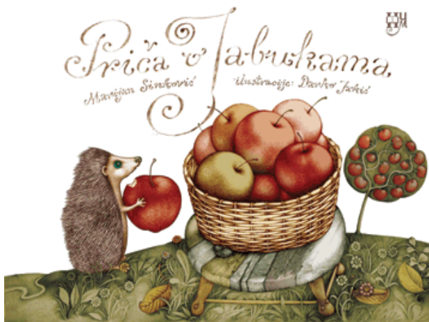
Slika 4. Eko priča – Priča o jabukama

„Ovo je još jedna knjiga za djecu na temu zaštite zdravog načina života i ekostandarda. Priča o jabukama u prvom planu zorno pokazuje razliku između lijepih crvenih, kemijski zaštićenih jabuka i malih, neuglednih, naboranih, neprivlačnih i točkastih jabuka. Na kraju priče djeca se upoznaju i s različitim sortama jabuka koje uspijevaju u našim krajevima. U knjizi je istodobno snažno naglašen kontrast između skućenog vidokruga i otuđenja od prirode u gradu i apsolutne slobode života na selu. Autori likovnim i literarnim slikama plastično upozoravaju na vizualne zamke koje vladaju svijetom i upućuju djecu na suštinsku ljepotu i doticaj sa zemljom i njenim plodovima.” (Marijan Sinković)