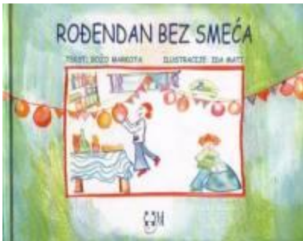
Slika 5. Slikovnica – Rođendan bez smeća

„Rođendan bez smeća, je prva od tri knjige u ciklusu na temu smanjivanja, iskorištavanja i termičke obrade otpadnog materijala. Vrlo domišljatim ilustracijama i zgodama na Kikovu rođendanu djeca se uče kako treba razvrstavati, odlagati i koristiti otpad s kojim muku muče sva kućanstva i gradska čistoća. Razvrstavanje viška materijala kroz igru postalo je dio veseloga rođendana. Tu su i dijalozi djece sa susjedom Vladom koji ima mnogo iskustva u sličnim poslovima i on dobro znade kako se razvrstava otpad počevši od omotnog papira do starih baterija. Tekst knjige je, dakle, pored svoje lagane čitljivosti i dinamičnosti, vrlo edukativan i primjenjiv u svim životnim prigodama, a isto tako knjiga je vrlo vješto i duhovito ilustrirana radovima akademske slikarice Ide Mati” (Božo Markota, 2006)