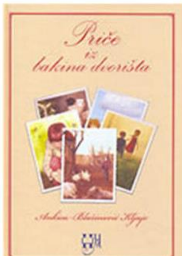
Slika 3. Eko priča – Priče iz bakina dvorišta

„Svaka od priča iz bakina dvorišta zaseban je svijet s uvijek novom porukom. Likovi koji u njima žive potječu iz ne tako davnih vremena, i svaki put nas podsjećaju na nekog nama bliskog i dragog prijatelja, a ponekad odjekuju u našim vlastitim strepnjama. Nit koja ih povezuje čas je krhka poput cvjetnih latica, čas snažna poput prijateljeva osmijeha. Bilo da je riječ o oblaku ili o djevojci, u središtu pozornosti je odrastanje. Ove male skice iz života zapravo govore o djetinjstvu koje je lijepo, bezbrižno i nestašno, ali je ponekad i uplašeno, nezadovoljno i razočarano. Bez imalo uljepšavanja stvarnosti autorica nas iz priče u priču vodi kroz dvorište sazrijevanja. Dijete će ove priče doživjeti s puno ljubavi koja ga neće 'zarobiti' već će ga svojom topline 'osloboditi'. Tako će na mjestu gdje su nekada stajali strah, sebičnost i nesmotrenost, uskoro početi rasti smjelost, brižnost i veselje.” (Tatjana Kotarski)