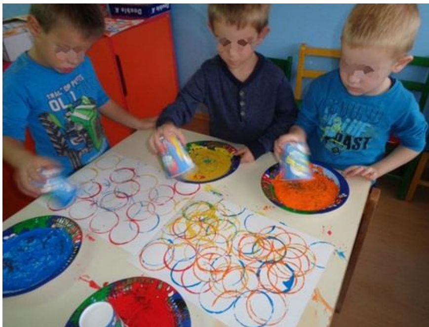
Slika 1. Dijete u ekološko-likovnoj aktivnost