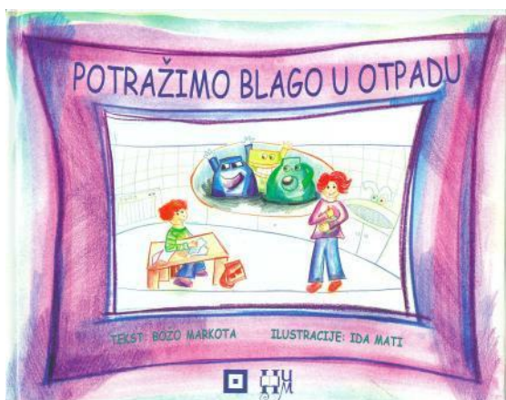
Slika 6. Eko slikovnica – Potražimo blago u otpadu

OD OTPADA NE SMIJEMO RADITI SMEĆE.” (Božo Markota, 2006)